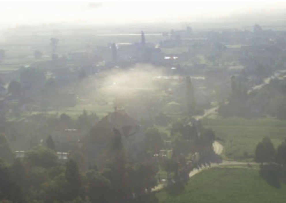
Dornava, pogled iz balona, foto: Andrej Doberšek, 2005

Ko je prišel s Polenšaka v Dornavo, je bilo zanj vse novo, privlačno in vabljivo. Živel je v preužitkarski hišici in v učiteljski hiši pri cerkvi in šoli, razmišljal o vaški skupnosti Lukovci ob reki Blatnici in popravljaj šolske naloge. K njemu so hodili poslušat radio, sam pa je prisluhnil njihovim prigodam z lukarskih poti. Kmalu je spoznal stisko dornavskih kočarjev in gostačev,