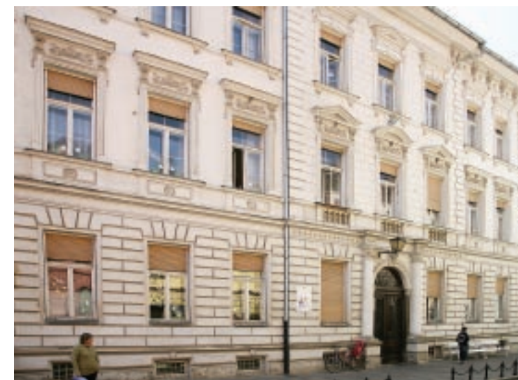
Zgradba gimnazije na Herrengasse, danes je v njej v Prešernovi ulici Osnovna šola Olge Meglič.