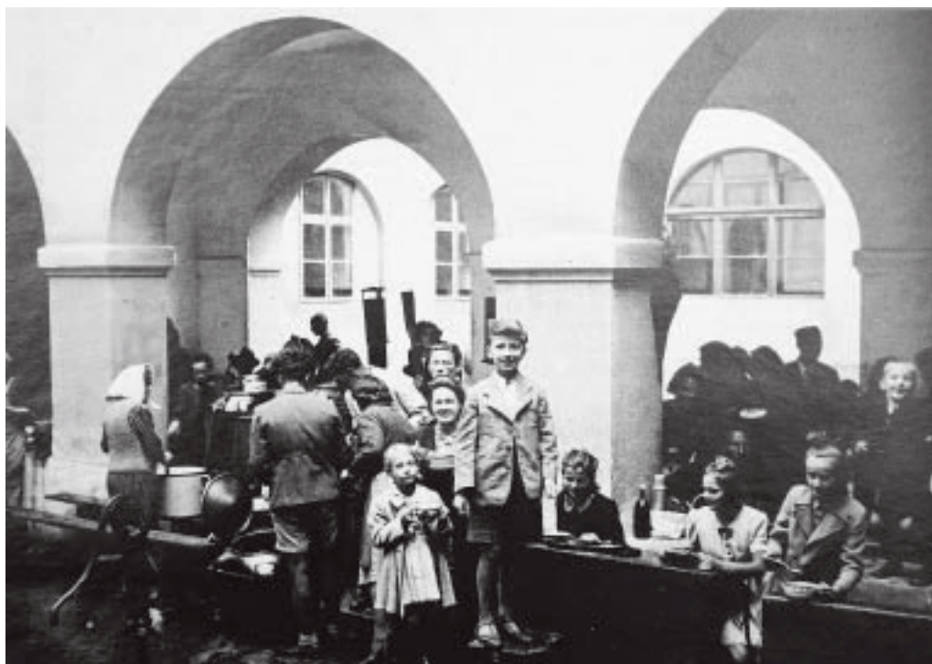
Paraćin 1941. Kuhinja slovenskih izgnancev. Na sliki sta pisateljeva otroka.

Izgnanstvo je preživel prve mesece v Paraćinu in Zaječaru, potem tri leta v Čupriji, nazadnje v Beogradu. Izgnali so ga s sinčkom, ki je komaj shodil, hčerko šolarko in bolno ženo. Vzeli so mu vse. V Zaječaru so jih lepo sprejeli, v Paraćinu je bilo zaradi folkdojčerskega župana življenje bedno, rešili so jih gostoljubni odposlanci iz Zaječara, dobil je profesorsko službo v Čupriji. Življenje je bilo kljub vsemu zelo težavno. Spominja pa se tudi četniških grozodejstev. Ker ni bilo igrač, je sinku pripovedoval pravljico, kako so iz ptujskega stanovanja šle igrače na pot v Srbijo. Nastala je Udarna brigada. Sinko je bil prepričan, da bodo igrače, ki jih je vodil general Blisk, premagale vse ovire. V letu 1943 je napisal tridejanko Mlatilnica.