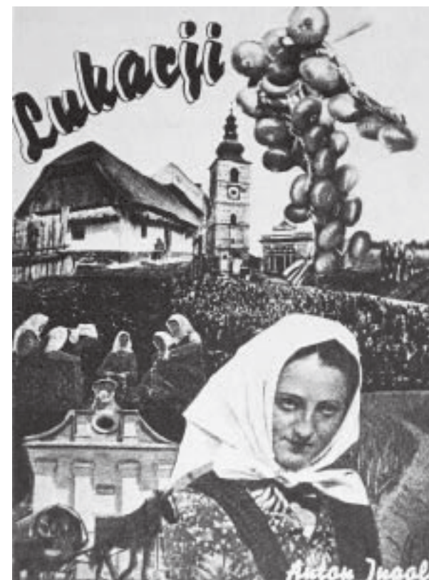
Anton Ingolič: Lukarji, naslovnica

Ob izidu Lukarjev je izšlo v slovenskih časopisih in revijah 22 precej nasprotujočih ocen, ki pa niso vplivale na Ingoličevo nadaljnje pisanje. Dekle iz naslovne strani so klerikalni krogi