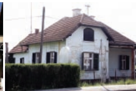
Z nastopom službe honorarnega suplenta na gimnaziji si je Ingolič najel sobico v Čučkovi vili.