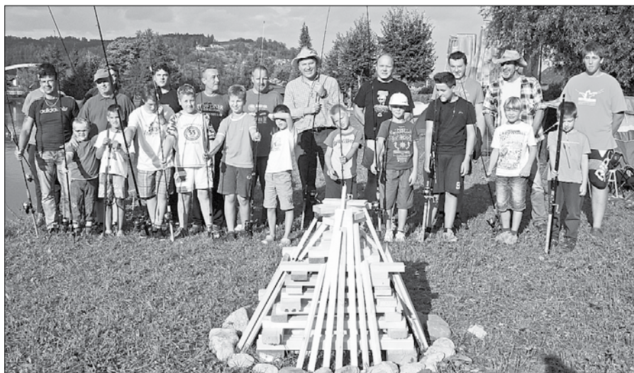
Enajst mladih ribičev je bilo v varstvu kar sedmih mentorjev.