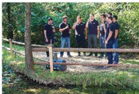
V Blatah so se številnemu občinstvu predstavili pevci vokalne zasedbe Oktet 9