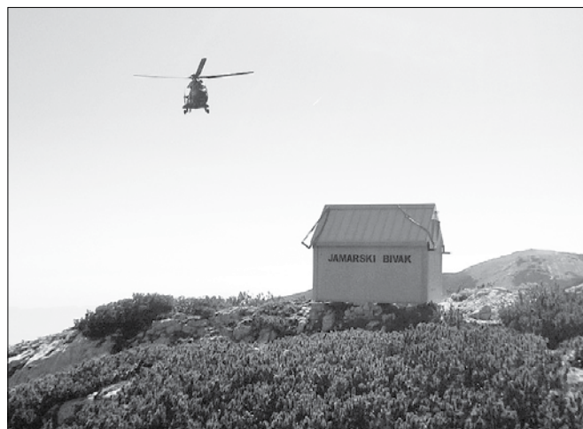
Bivak na Dleskovški planoti bo služil mnogim jamarjem ob raziskovanju velikega potenciala tega podzemnega območja in kdaj kakšnemu utrujenemu planincu.