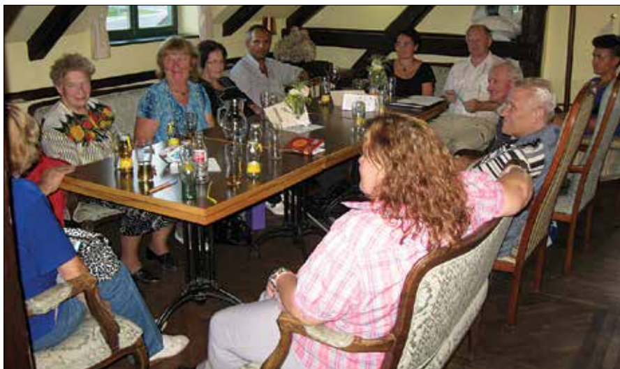
Člani Kulturnega društva Slap so se na delovnem srečanju dogovorili, da bodo tudi letos izdali knjigo, v kateri bodo zbrali svoje najnovejše literarno snovanje.