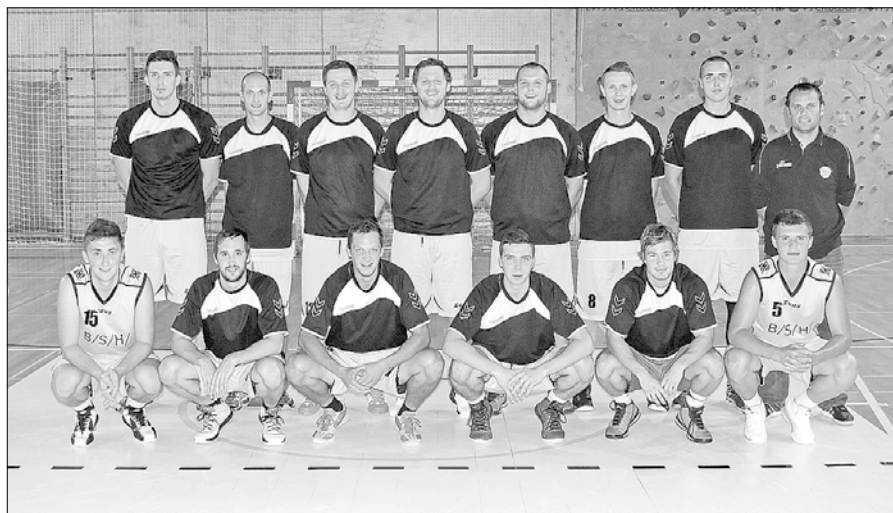
Nazarska članska ekipa se je predstavila na močnem pripravljalnem turnirju.

izpolnil vse pogoje za nastopanje v tretji ligi in ob nekaterih odpovedih klubov, ki so se v njo sicer rezultatsko uvrstili, je KZS ekipo povabil za igranje v tem rangu tekmovanja.