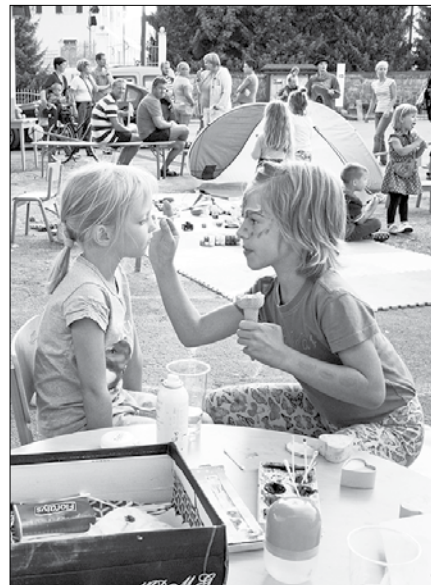
Otroci so ob igri in delavnicaх spoznavali čar gledališke igre in maske.