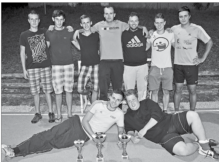
Glavna nit dogajanja je bilo predvsem druženje na prijateljskem nivoju.