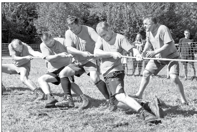
V planinskih gozdarcah in z grčastimi mišicami so Krničani v finalu potegnili do skupne zmage.