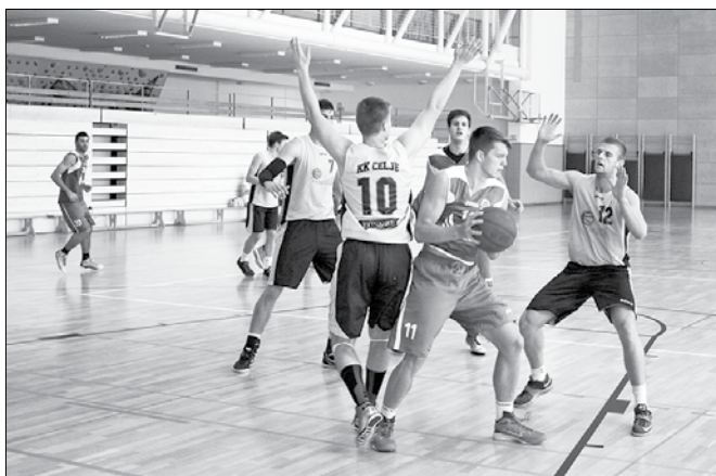
Košarkarji KK Triglav Elektro Gorenjska prodaja in KK ECE Celje so teden dni priprav sklenili z medsebojnim srečanjem na parketu športne dvorane v Mozirju.