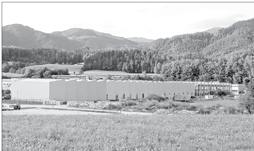
Ta mesec bodo v KLS-u dokončali gradnjo 4.200 kvadratnih metrov velike hale. Ta naj bi zadoščala njihovim potrebam po proizvodnih prostorih do leta 2020.