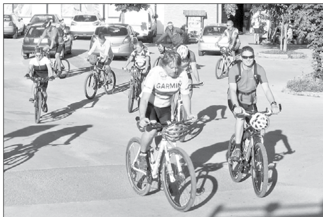
Zbralo se je lepo število kolesarjev željnih dobre rekreacije.

Kolesarji so se dobili v Nazarjah. Od tu jih je pot vodila proti Lokah pri Mozirju ter dalje do Podkrajja in Letuša. V Letušu jih je čakal prvi vzpon, saj so se povzpeli proti domu borcev na Dobrovljah ter naprej proti cerkvi svete Katarine. Od cerkve dalje so se kolesarji napotili proti planinskemu domu na Farbanci, kjer je vse udeležence čakalo zaslužno okrep-