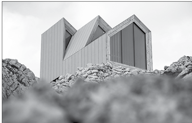
Bivak je bil zasnovan na osnovi študija znotraj Šole za arhitekturo Univerze Harvard iz Bostona.