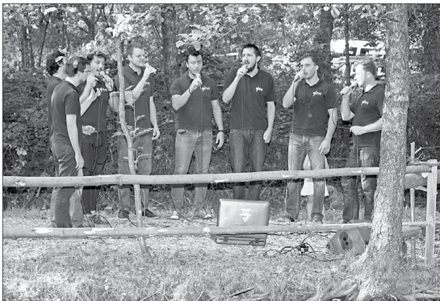
Fante vokalne skupine Oktet 9 so obiskovalcem pripravili pester program različnih glasbenih žanrov.

Maja letos so fante izdali novo zgoščenko z naslovom Svoboda!?, na katero so umestili program domoljubnih in borbenih pesmi od kmečkih puntov do druge svetovne vojne. Ok-