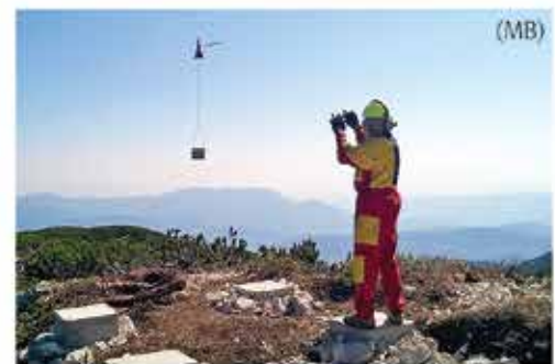
V Kamniško-Savinjskih Alpah postavili dva nova bivaka