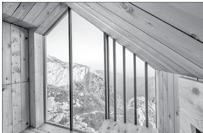
Z obeh strani bivaka se preko panoramskega stekla odpira prelep pogled v dolino Kamniške Bistrice in na severni strani na Skuto in okoliške gore.

Študentje so na osnovi tradicionalnih slovenskih alpskih arhitektur, stavbnih elementov, materialov, struktur in oblik pripravili različne koncepte. Izbran je bil projekt,