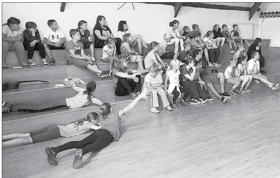
Otroci so ob katehezah, igrah in delavnicaх razmišljali, kaj lahko dobrega storijo za svoje bližnje.