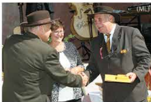
Mozirski čebelarji slovesno obeležili devet desetletij delovanja