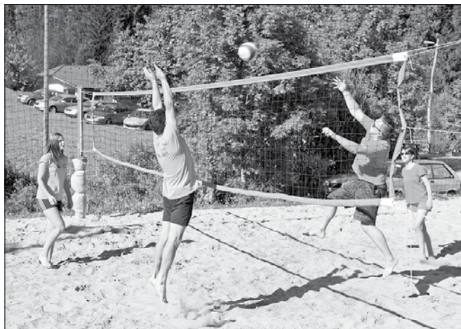
Odbojka četvork na mivki je bila paša za oči gledalcev.

Najbolj srčiti obračuni so bili z vlečenjem vrvi na travniku, kjer so bile pomembne izkušnje, moči, sestav ekip, obutev in ne nazadnje motivacija. Moči so merile posebej ženske in moški, v prepoznavnih dresih so ekipe lepo »poslikale« zeleno dolino, kjer je svoj čas vihtel teniški lopar tudi nekdanji državnik dr. Janez Drnovšek.