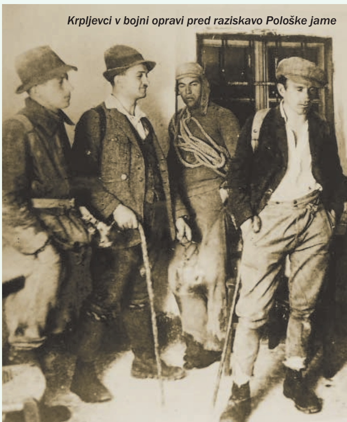
Krpljevci v bojni opravi pred raziskavo Pološke jame

»Bil je nebogljeno dete, porojeno po fašistični obsodbi primorskih Slovencev in Hrvatov na kulturno smrt,« pravi o Krplju njegov duhovni vodja Zorko Jelinčič. Na dan ustanovitve kluba, 16. marca 1924, je trojica mladeničev – Jože