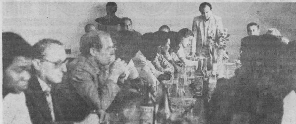
23. 9. je občinska konferenca SZDL priredila v skupščini občine Center sprejem za 17 namibijskih študentov, predstavnikov gibanja SWAPO. V mednarodnem centru za upravljanje podjetij v družbeni lasti v Ljubljani so študirali od marca do septembra 1982. To je bila že tretja skupina študentov, ki jih je poslal Svet za Namibijo pri OZN k nam na študij.