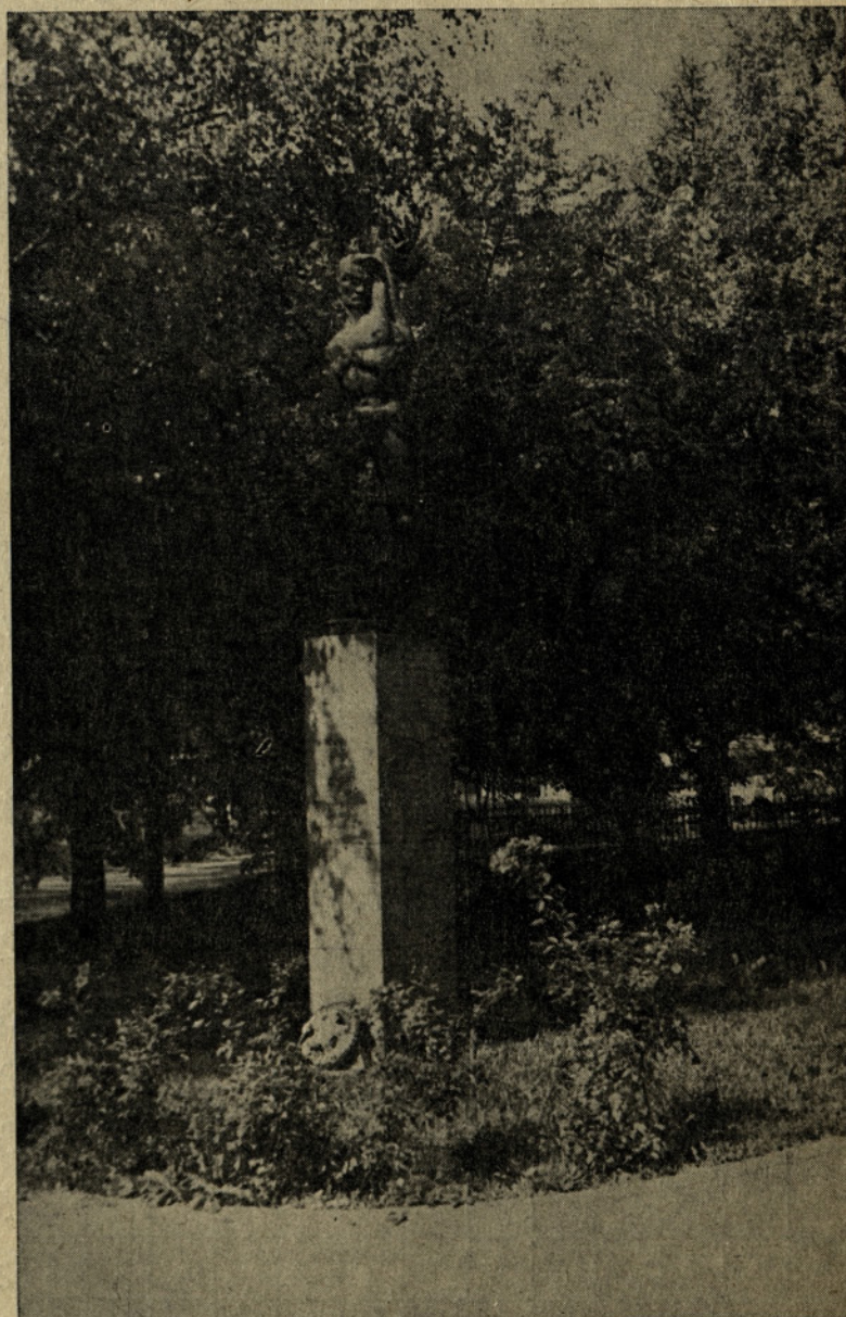
Šentjurčani se bodo spomnili vseh žrtev NOB ob komemoraciji pri tem spomeniku

številnih in zanimivih vprašanjih, ki jih po končanem predavanju postavljajo brigadirji predavatelju, lahko sklepamo, da je tematika mladim izredno zanimiva. Zanimivo je mladim tudi pehotno orožje, s katerim jih seznanjajo pripadniki, oziroma starešine naših teritorialnih enot. Pri streljanju z malokalibrsko puško, kjer je na strelišču vedno tudi vzorna disciplina, pa so enako kot fantje tudi dekleta dosegla lepe uspehe. Brigadirji in brigadirke preizkušajo svojo spretnost in zmožljivost še z metanjem bombe v cilj in s plezanjem po vrvi z vso resnostjo, da bi priborili svoji skupini čim več točk in boljše končno uvrstitev brigade, ki ji pripadajo. Najzanimivejši del obrambnega dne pa je za mlade orientacijski pohod. Predhodno se naučijo v ravnanju z busolo. Nekateri od brigadirjev jo že dobro poznajo, saj so številni med njimi taborniki, drugim pa je ta naprava neznan in jo na obrambnem dnevu vidijo prvič. Orientacijski pohod je načrtovan mimo nekaterih pomembnih obeležij iz NOB v okolici Planine, tako da spoznajo brigadirji poleg okolice svojega bivališča tudi marsikatero zanimivost iz revolucionarne preteklosti Kozjanskega. V taboru MDA v Šentvidu gledajo mladi ob obrambnih dneh tu-