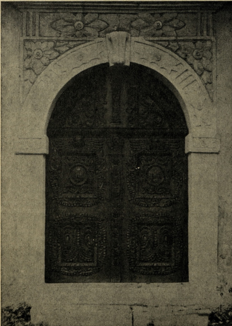
Dragoceni portal rozalske cerkve