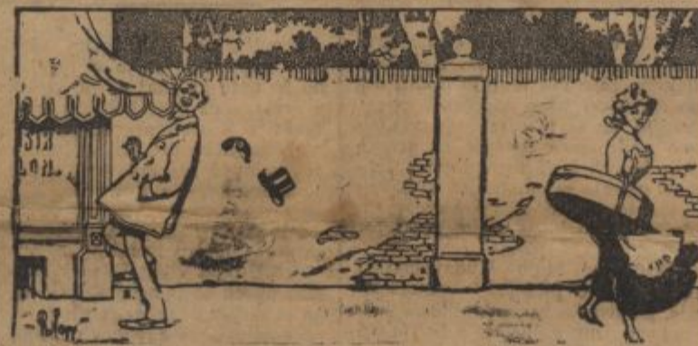
Vsak svojo pot dalje gre, ne loči pogledov od nje... Oh, kaj se vsakomur zgodi, ki naprej ne obrača oči!