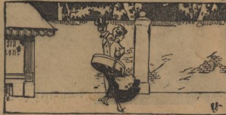
Se deklica lepa mu zdi, brz nanjo obrne oči.