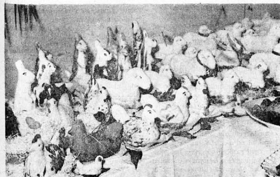
V nedeljo 23. aprila je bila v Bazovici kuhinjska razstava, ki so jo priredile dekleta in žene. Na sliki: velikonočni motivi

Sobota: 17.00 Instrumentalne slovenske zasedbe. — 18.00 Oddaja za najmlajše: Vilko Čekuta: »Desetnik in sirotica«. — 20.45 Slovenski samospevi. — 21.00 Rocca: »Nič«, komedija v treh dejanjih.