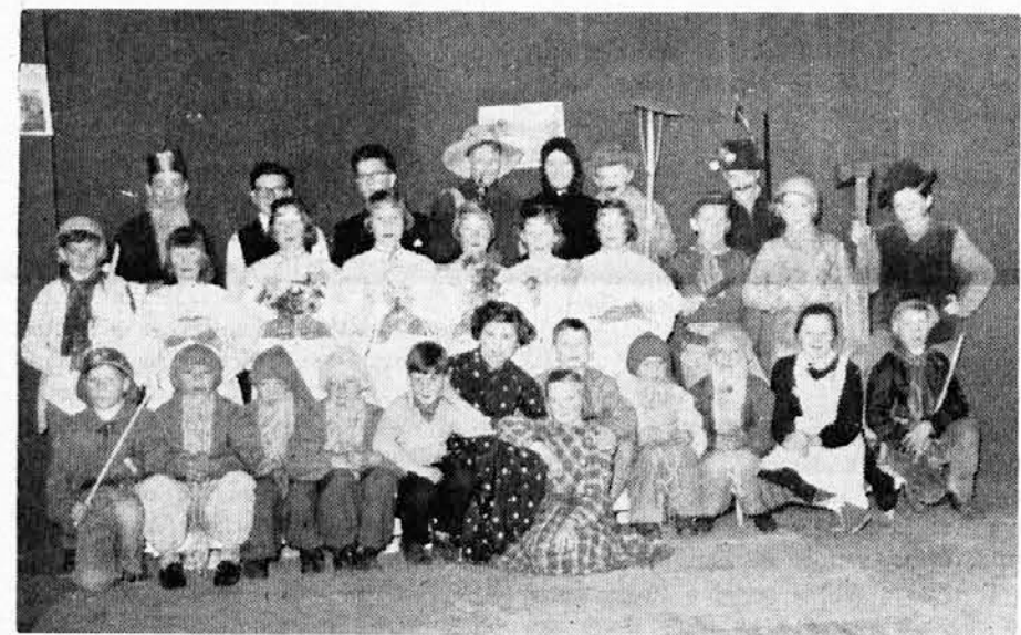
Skupina otrok iz Bazovice, ki so priredili v nedeljo 23. aprila igro v 5. dejanjih »V Indijo Koromandijo«

Udeležence gospodinjanskega tečaja so razstavile: različno pecivo, torte vseh vrst in