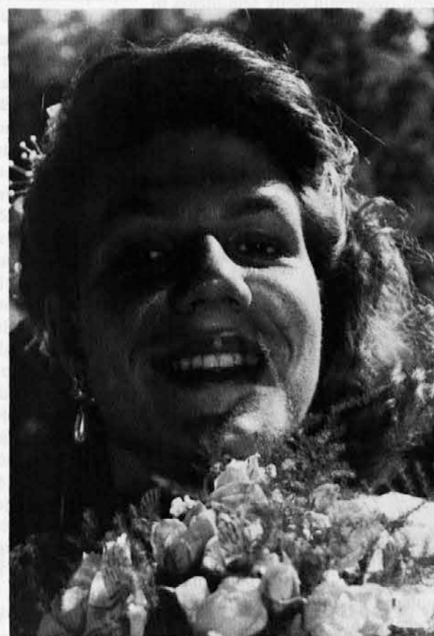
Kaj je lepšega kakor prijazen nasmeh, zrcalo čistih oči?

Na seji, ki jo je vodil deželni tajnik SSK Jevnikar, je bil govor tudi o nujnosti, da bi do srede julija dokončno oblikovali skupni osnutek zaščitnega zakona, glede katerega smo Slovenci že v hudi zamudi. Stranka je besedilo načelno že odobrila in predlagala ostalim komponentam še nekaj tehničnih popravkov.