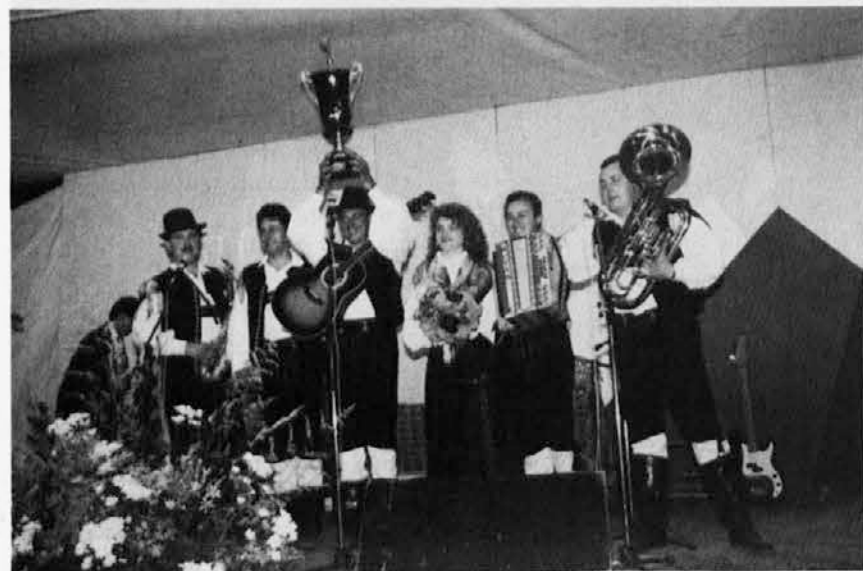
Ansambel Vrtnica iz Nove Gorice - zmagovalac letošnjega festivala