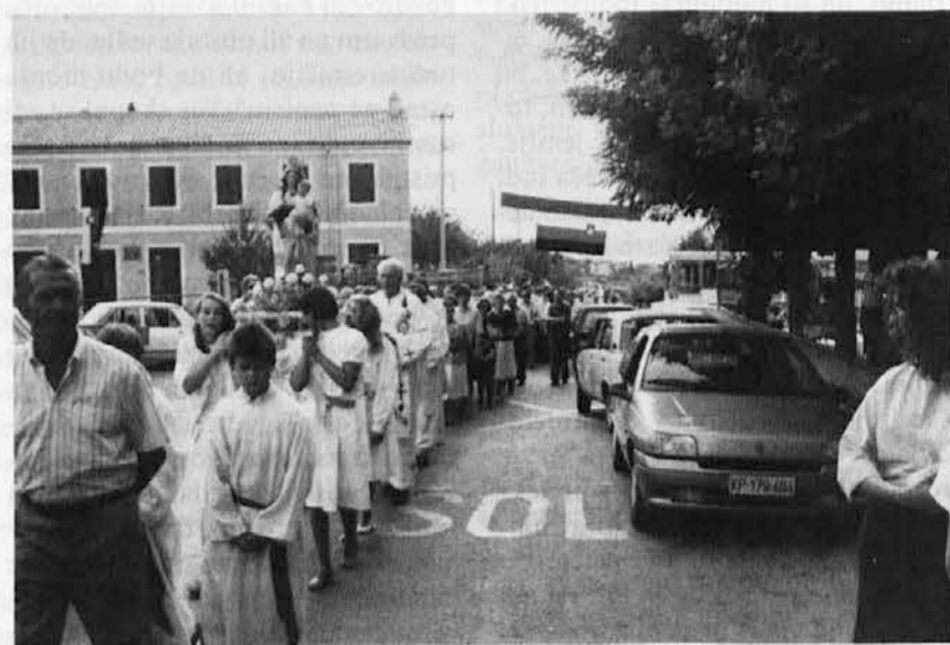
Procesija z Marijinem kipom mimo krajevne šole

Zato svetujem vsem škofom, naj organizirajo v svoji škofiji po vseh župnijah centre za pomoč, da lahko zopet pridobijo visoko število vseh tistih, ki so bili nekoč pri Jehovcih. Naš Center je na razpolago za to delo, toda zelo važno je, da škofje strezljivo tiste župnike, ki trdijo, da z Jehovci ni problemov.«