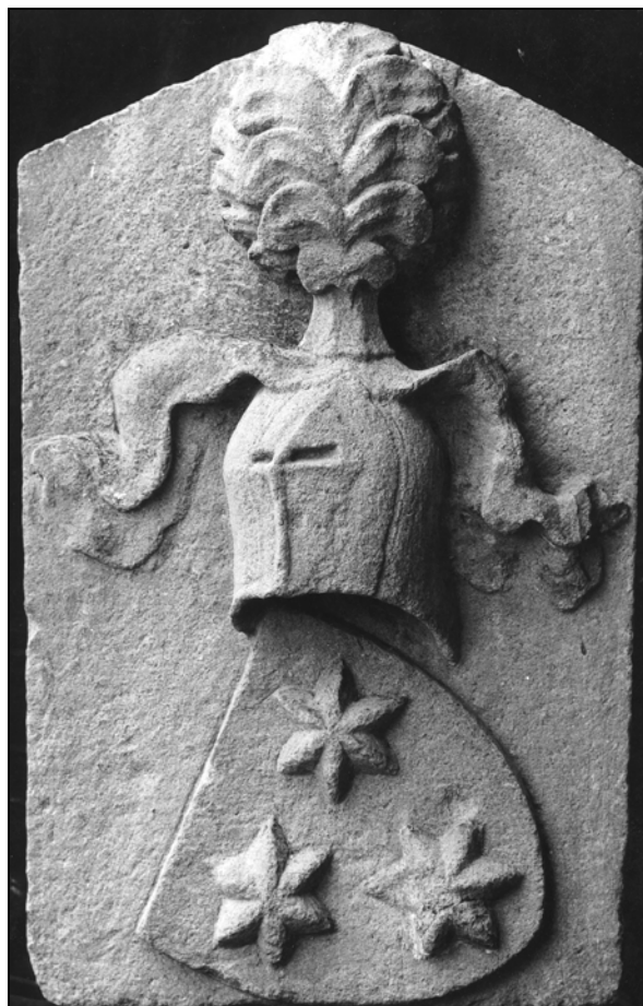
Grbovno ploščo grofov Celjskih iz druge polovice 14. stoletja je muzejsko društvo s Knežjega dvora preneslo v muzej leta 1885. (Pokrajinski muzej Celje, inv. št. P/81).