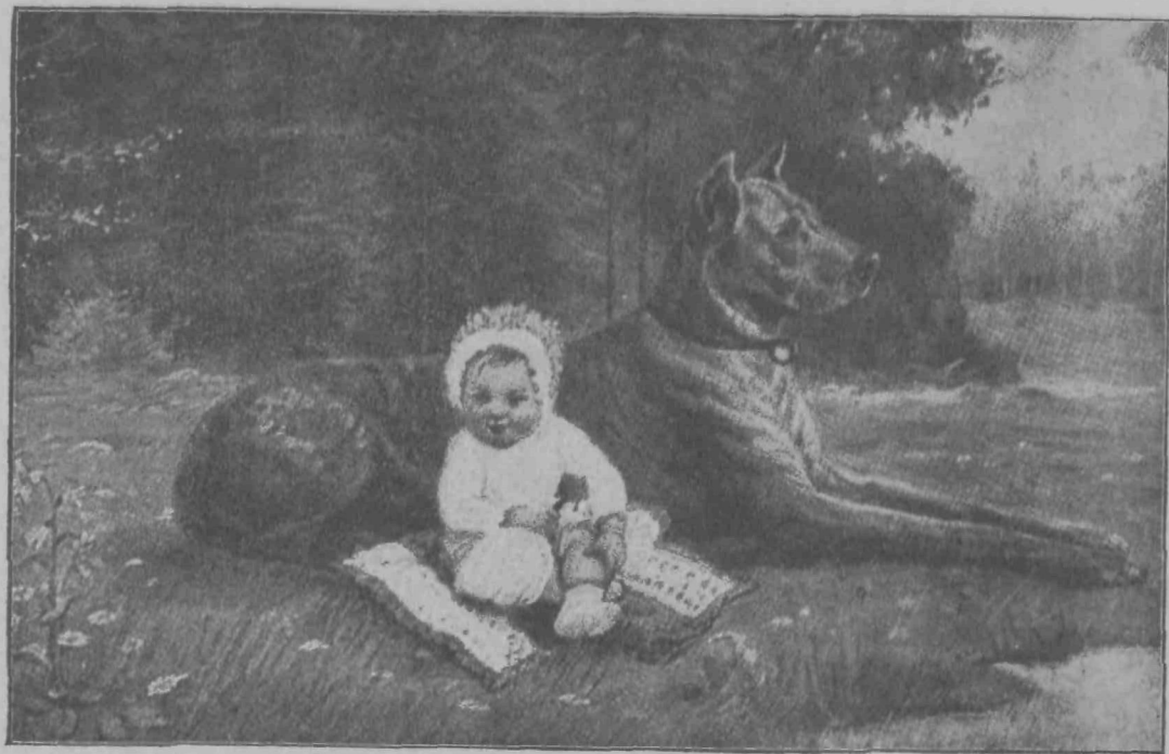
Kako Pazi varuje Verico.