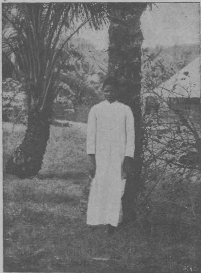
Cvetka afriške puščave.

upanje. Frančiškovo največje veselje je torej bilo, če je smel spremljati misijonarje na njih misijonskih po-