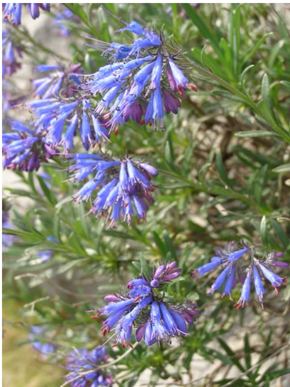
Slika 1. Moltkia petraea – ostenja nad Starim Barom.

izselilo in kasneje zasedlo območje zunaj njegovih zidov. Naselje znotraj obzidja je danes v ruševinah. Okolico mesta obkrožajo terase s starimi oljčniki, ki po hudourniških dolinah segajo v notranjost masiva Rumije. Še posebej zanimive so bile stene v teh dolinah. Tukaj smo se srečali z nekaterimi značilnimi predstavniki flore južnih Dinaridov, kot sta npr. skalna moltkovka ( Moltkia petraea , slika 1), ki z modrimi cvetovi krasi najtoplejša ostenja, in bolhač ( Tanacetum cinerariifolium ), endemit Dinaridov, ki je bil v preteklosti zaradi uporabnosti pri izdelavi sredstva proti bolham razširjen skoraj po celem svetu.