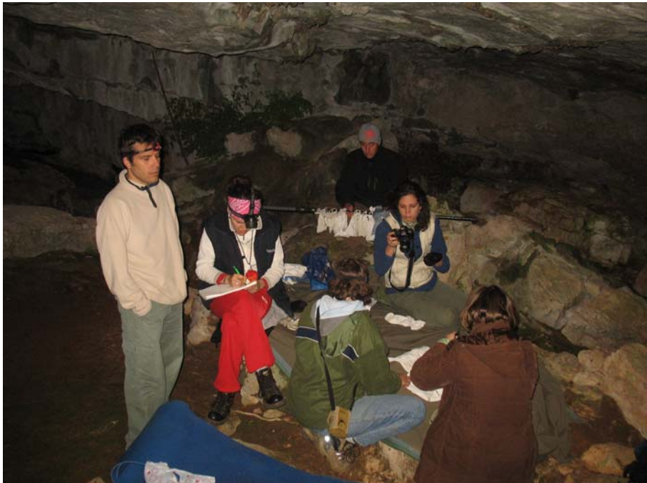
Slika 2. Skupno delo s črnogorskimi netopirci pred jamo Babatuša.

Gotovo smo imeli veliko srečo, da so se nam med raziskovanjem pridružili črnogorski netopirci oziroma smo se jim mi prislinili (hvala vam). To so bili naši prijatelji, ki so z nami raziskovali že na RTŠB Lovrenc na Pohorju leta 2005. Tako smo lahko obiskali kar lepo število jam in drugih mest, ki se jih sicer sploh ne bi lotili iskati; rezultati pa so bili temu ustrezno dobri. Imeli smo izredno dober večerni lov pred jamo Babatuša (slika 2). V ruševinah trdnjave Besovac v Virpazarju pa smo našli porodniško skupino resastih netopirjev. Ob dobrih vodnikih smo lahko po terenu hodili celo v dnevu, ko je deževalo, in z začudenjem padli v razsulo sistema, ki ga je povzročil le en deževen, brezdelen in alkohola poln dan v taboru.