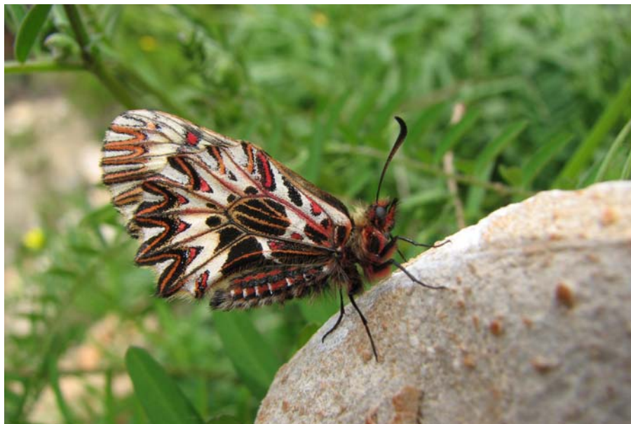
Slika 2. Petelinček ( Zerynthia polyxena ).