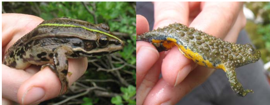
Slika 2. Skadarska žaba ( Pelophylax shqipERICA ) in jadranski hribski urh ( Bombina variegata kolombatovici ) v dolini potoka pod Obodsko jamo.

Od rjavih žab smo ravno tako našli obe vrsti, ki jih lahko pričakujemo v črnogorskem primorju in okolici Skadarskega jezera. Najpogosteje smo srečali rosnico ( Rana dalmatina Bonaparte, 1840), medtem ko je naša skupina potočno žabo ( R. graeca Boulenger, 1891) srečala le na enem mestu pri mestu Bar. Obe vrsti sta v Črni gori splošno razširjeni, prva je v splošnem bolj karakteristična za nižinske srednje velike stojee vode, medtem ko potočna žaba prevladuje v hladnih, hitrih potokih in manjših rekah z malo vodne vegetacije in v njih tudi mresti. Za obe vrsti pa je značilno, da mreste odložijo zgodaj spomladi in se nato preselijo v kopenski habitat.