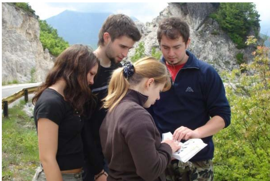
← Del skupine "ptiči 1".