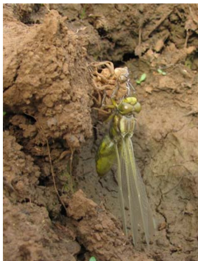
Slika 1. Samica modrega ploščca ( Libellula depressa ) se preobraža kar nad levom samčka iste vrste.

Pri omenjenih vrstah kačjih pastirjev gre pravzaprav za ene prvih najdb na območju Črne gore.