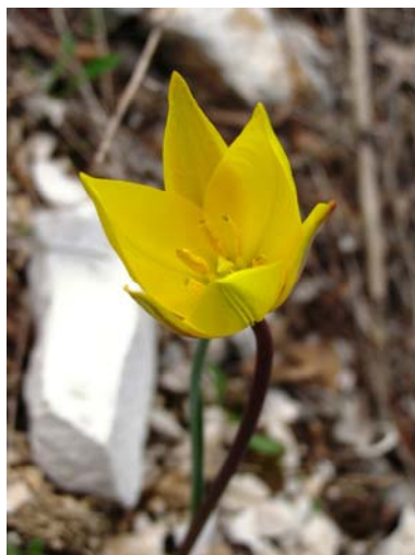
Slika 2. Tulipa sylvestris ssp. grisebachiana – Vrsuta (Rumija).

Kamnita travišča nad gozdom so rastišče divjih tulipanov ( Tulipa sylvestris subsp. grisebachiana , slika 2), ki je prav tako endemična za jugovzhodne Dinaride. Na Vrsuti uspeva največja črnogorska subpopulacija. Ob našem obisku so poleg tulipanov cvetele še narcise ( Narcissus radiiflorus ), grozdasta hrušica ( Muscari botyoides ) in gomoljasta špajka ( Valeriana tuberosa ).