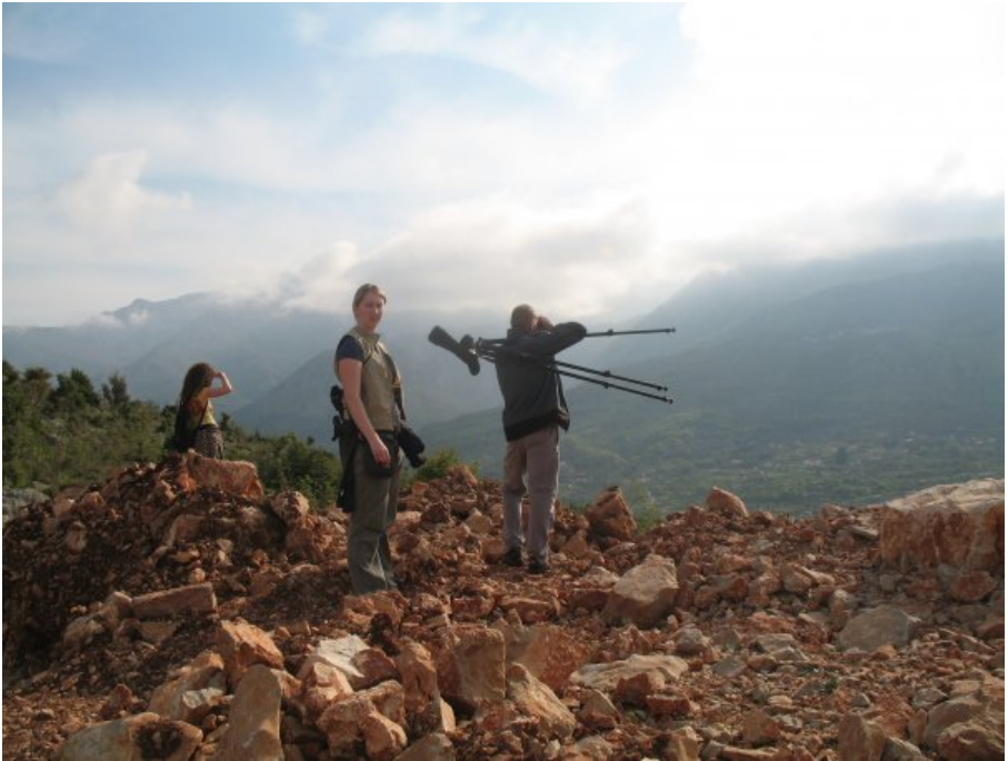
Slika 1. V gorah Črne gore.