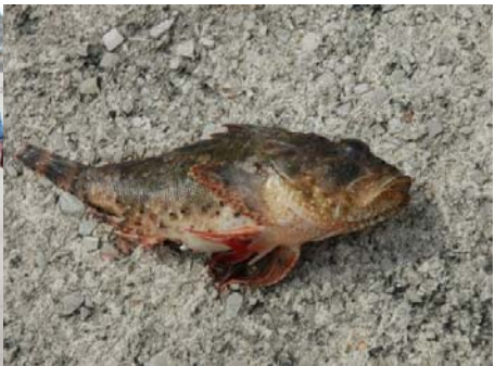
Slika 3. Riba roda Scorpaena , ki jo je tako kot več ostalih ulovil lokalni ribič.