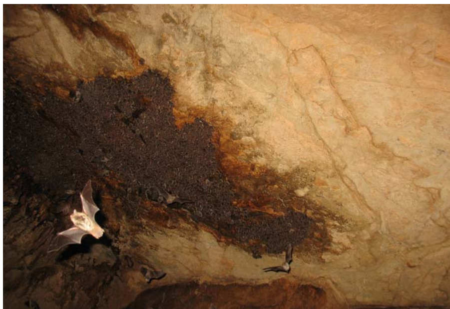
Slika 3. Ogromna gruča dolgonogih netopirjev ( Myotis capaccinii ) v Obodski pečini.