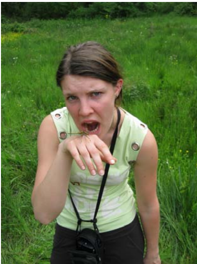
Slika 3. Lačna ali obupana? Udeleženka vsekakor.