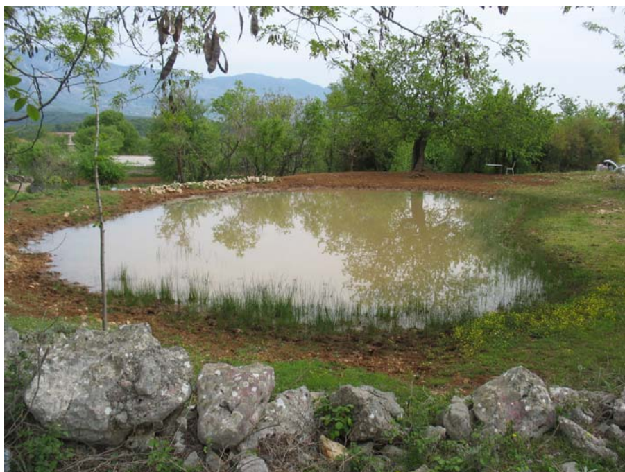
Mlaka v vasi Metanoviči je bila objekt preučevanja mnogih skupin.