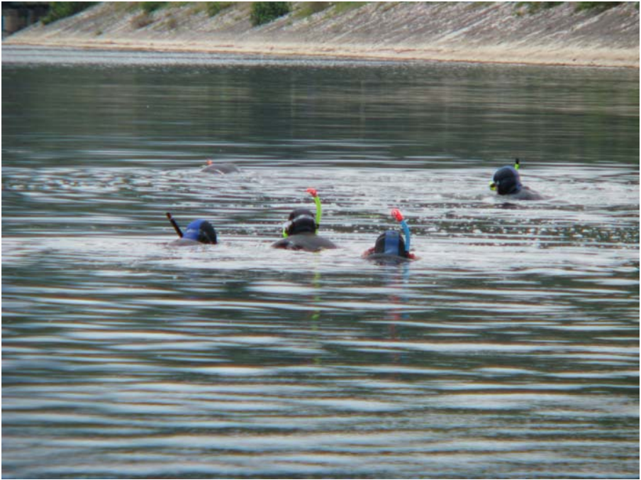
Slika 1. Potapljači.