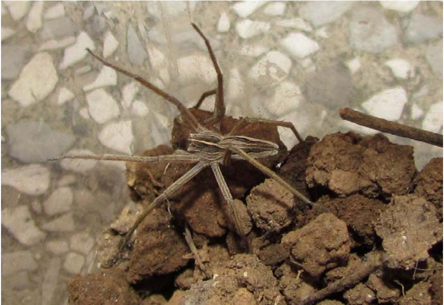
Slika 1. Scopolijev lepi volkec ( Pisaura mirabilis ).

tem geografskem območju. Kljub velikemu številu neodraslih osebkov pa lahko domnevamo, da je araneološka pestrost tega območja velika, kar nakazuje veliko število nabranih vrst, ki pripadajo kar 22 družinam. Zaradi zahtevnejše sistematike nekaterih skupin in pomanjkanja opisov vrst iz tega območja je nekaj materiala še v obdelavi, zato bodo natančnejši rezultati dela skupine podani kasneje.