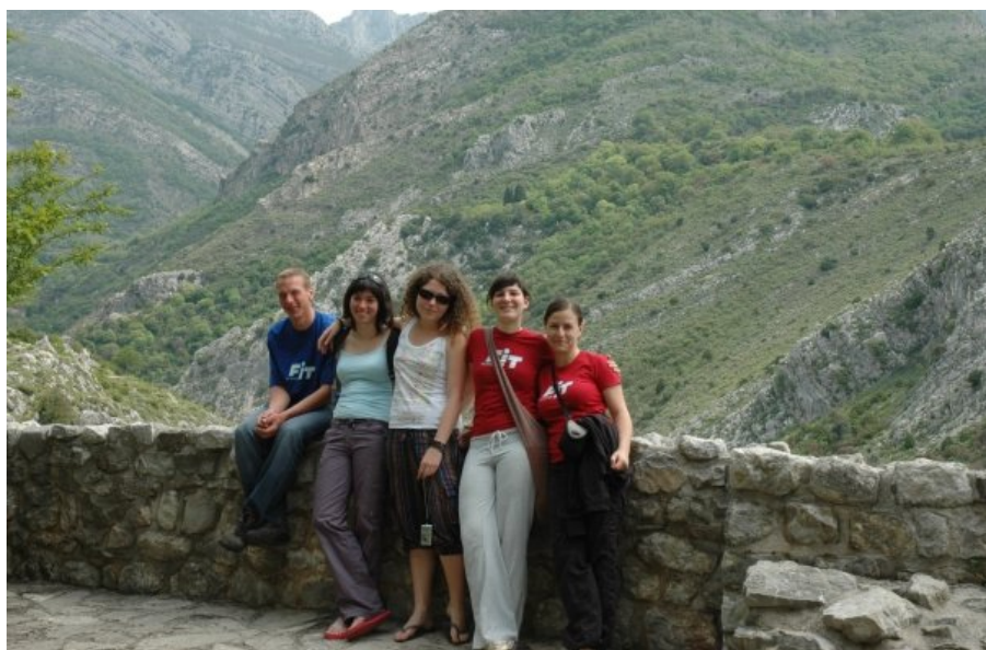
Skupina "ptiči M". →