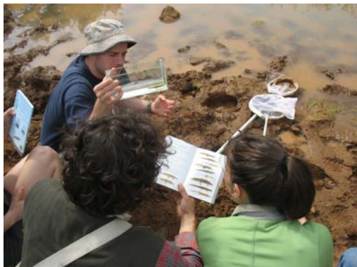
Slika 1. Določevanje pupkov ob kalu v vasi Metanovići.

Iz reda repatih dvoživk (Urodela) smo tekom tabora našli vse vrste, ki jih lahko pričakujemo v tem delu črnogorskega primorja in neposredni okolici Skadarskega jezera. Najbolj pogosto smo naleteli na navadnega pupka ( Lissotriton vulgaris Linnaeus, 1758). Po nekaterih avtorjih naj bi populacije vzdolž jadranske obale od Neretve do Črnega Drina v Albaniji pripadale podvrsti L. vul. tomasinii Martens & Müller, 1928 (Krizmanič et al. 1997, Čirović et al. 2008a), vendar molekulske in sodobnejše morfometrične raziskave tudi te populacije uvrščajo med balkanske navadne pupke ( L. vul. graecus Wolterstorff, 1906; Babik et al. 2005, Ivanović et al. 2011). Na eni mestu ob Skadarskem jezeru smo našli tudi balkanskega velikega pupka ( Triturus macedonicus Karaman 1922). Po pričakovanju planinskega pupka ( Ichtiosuria alpestris Laurenti, 1768) nismo našli, ker ta sicer živi v zaledju črnogorskega primorja, vendar le severno od Bara. Poleg pupkov pa smo v potoku blizu kraškega polja Jame Pelinkovačke našli tudi paglavce navadnega močerada.