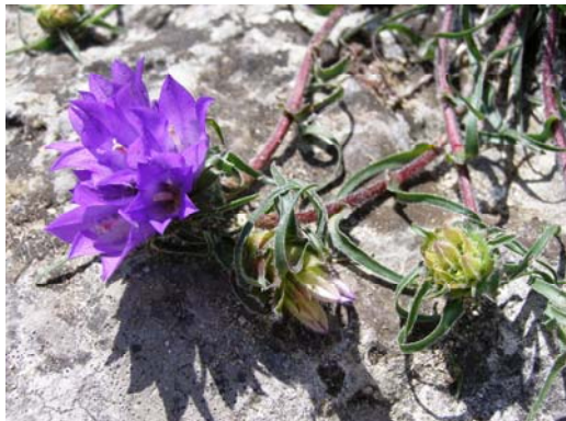
Slika 3. Edraianthus tenuifolius – soteska Cijevne pri Podgorici.

Reka Cijevna izvira na albanski strani in čez Črno goro priteče v reko Moračo. V gornjem toku teče skozi veličasten kanjon, globina katerega na nekaterih mestih dosega 1000 m. V nižjem toku reka teče skozi ravnico v neposredni bližini Podgorice. Ravnico, ki je v večji meri spremenjena v vinogradniške površine, je včasih pokrivala stepi podobna vegetacija, ki jo danes najdemo samo še fragmentarno med obdelanimi površinami. Reka Cijevna je s svojo erozijsko močjo v ravnico, ki jo sestavlja podlaga iz pretežno cementiranih prodnikov in peska, vsekala plitev in ozek kanjon. S florističnega vidika je to območje zelo zanimivo, saj se tukaj stikajo tako gorski kot stepski in mediteranski elementi. Na celotnem območju reke Cijevne je bilo zabeleženih 959 taksonov, kar predstavlja eno tretjino celotne flore Črne gore. Poleg tega je območje izredno spektakularno zaradi izjemnih geomorfoloških značilnosti.