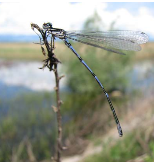
Slika 2. Suhljati škratec ( Coenagrion pulchellum ).

Nezanemarljive so tudi najbe suhljatega ploščca ( Coenagrion pullchelum ), ki smo ga na taboru večkrat videli. Gre sicer za vrsto, ki je pogosta in šire razširjena v severni Evropi, na jugu pa redkejša. Njena prognoza ni ravno najboljša, saj jo znajo podnebne spremembe povsem pregnati iz tega dela Evrope.