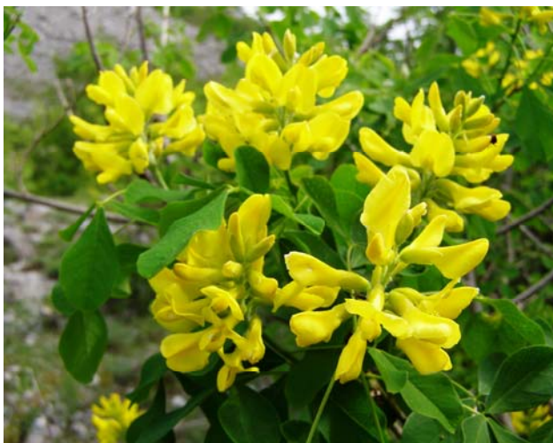
Slika 3. Petteria ramentacea – severovzhodna pobočja Rumije.

Aethionema saxatile , Aristolochia rotundifolia , Carpinus orientalis , Celtis australis , Coronilla emerus , Cymbalaria sp., Cyclamen repandum , Fraxinus ornus , Geranium purpureum , Ophrys sphaegodes , Orchis morio , Orchis simia , Ornithogalum sp., Ranunculus millefoliatus , Pistacia terebinthus , Petteria ramentacea , Quercus trojana , Satureja montana , Saxifraga tridactylites .