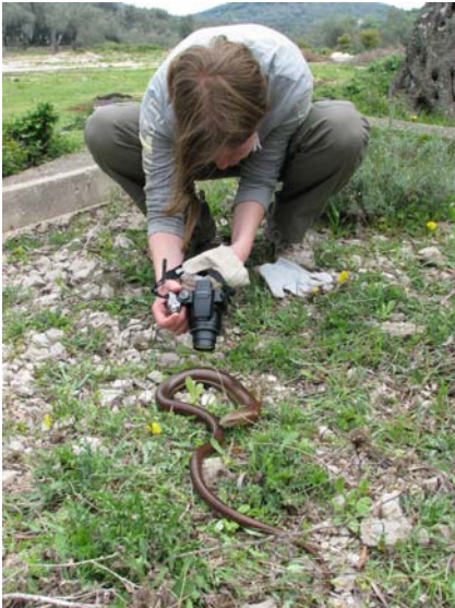
Slika 2. Terensko delo.

Večinoma so bili osebki plazilcev zgolj opazovani in fotodokumentirani (slika 2), saj že to največkrat zadostuje za vrstno določitev. S tem smo se tudi želeli izogniti nepotrebnemu vznemirjanju živali. Za lov kuščaric smo uporabljali zanko iz sintetične niti z žičnato oporo, ki jo je potrebno kuščarici natakniti okoli vratu. Slepce in kače iz družine gožev in vodaric smo lovili z golimi ali s tanjšimi rokavicami zaščitene rokami. 28. aprila smo se na nočnem terenu pridružili skupini za dvoživke, ki je na taboru popisovala tudi sklednice ( Emydidae ), ki prav zaradi tega niso vključene v tem poročilu. Zbirali smo tudi kače leve, podatke o povoženih osebkih ter podatke, ki so jih posredovali udeleženci drugih skupin na taboru. Pri določanju vrst smo uporabljali določevalne ključe (Arnold 2004, Mršič 1997, Tome 1999). Ujete plazilce smo razvrstili v starostne razrede (adult / subadult / juvenil) in kjer je bilo to mogoče določili njihov spol. Na nekaterih smo opravili tudi standardne morfometrične meritve. Vsi ujete plazilci so bili po določitvi izpuščeni na mestu ulova. Najdiščem plazilcev smo z GPS sprejemnikom določili stopinjske koordinate in nadmorsko višino. Na terenu zbrani podatki so bili vneseni v elektronske popisne liste. Zbrane podatke in fotografije nekaterih osebkov in njihovih življenjskih prostorov hrani avtor.