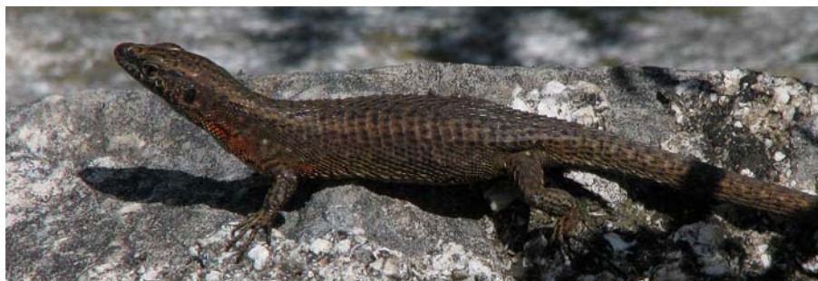
Slika 4. Črnopikčasta kuščarica ( Algyroides nigropunctatus ).