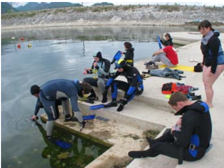
Slika 2. Priprava na potapljanje na dah.