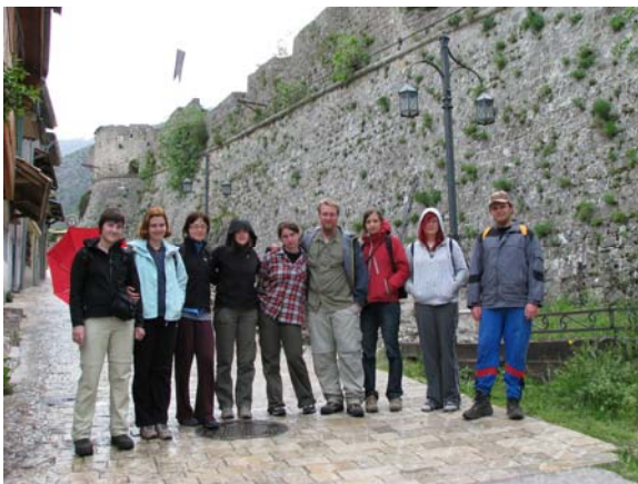
Slika 1. Skorajda vsi udeleženci skupine za plazilce.

V skupini za plazilce je delovalo 11 udeležencev (slika 1). S pomočjo zemljevidov in satelitskih posnetkov so bila izbrana območja pregledovanja. Pri načrtovanju in celodnevni inventarizaciji smo se osredotočali predvsem na, za plazilce, potencialno primerne življenjske prostore, kot so skalne stene, melišča, skališča, kamenišča, prisojna pobočja, gozdne obronke, bregove vodnih teles, pokopališča, kamnite zidove, mostove, ruševine, ceste in podobno.