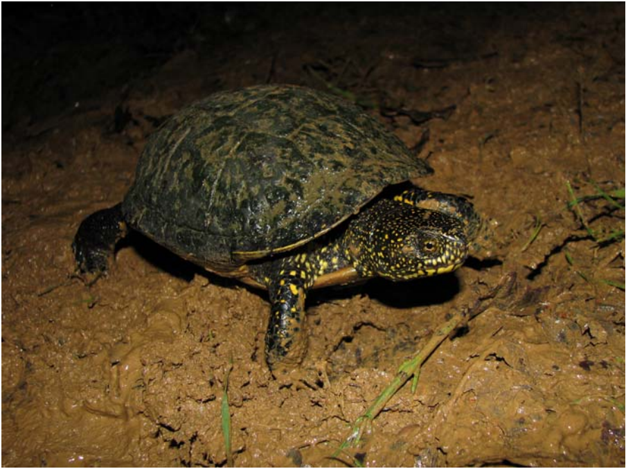
V primerjavi s časom, ki v zadnjih letih pretekel od konca taborov do izdaje zbornikov, bi še močvirna sklednica ( Emys orbicularis ) hitreje prišla iz Črne gore v Slovenijo.