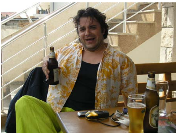
Asimilacija po črnogorsko oz. Smrt popa Mila Jovanovića I. del.

Zaključimo lahko, da je stanje dvoživk in sklednic v črnogorskem primorju in okolici Skadarskega jezera relativno dobro, vendar smo žal tudi v Črni gori opazili posege v njihove življenjske prostore, ki so povezani predvsem z izsuševanjem močvirnatih in poplavnih območji in drugih mokrišč za potrebe prehitro rastoče intenzivne turistične infrastrukture (hoteli, plaže, igrišča). Tak primer smo srečali že na poti na tabor, ko smo si ogledali Mrčevo polje zahodno od Budve. To je bilo še leta 2005, ko smo imeli tabor v bližini Budve prekrasen poplavni travnik (Luštrik & Vinko 2006), sedaj ga je pa večina spremenjenega v nogometno igrišče, trgovsko-obrtno cono in bencinsko črpalko.