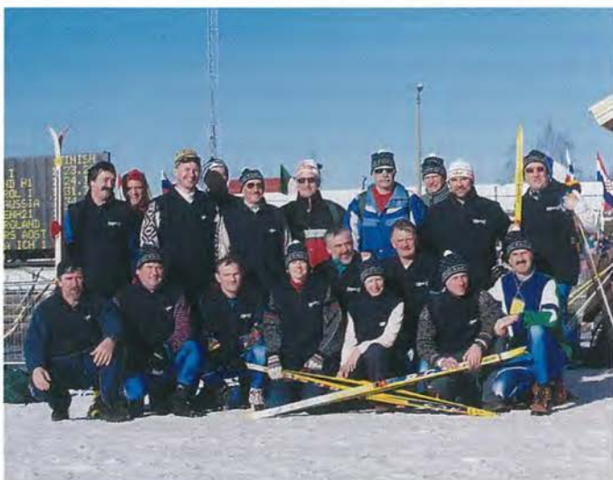
Skupinska slika slovenske ekipe