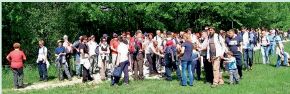
Pohod po Planinskem polju