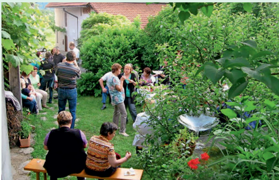
Keramična delavnica-muzej in galerija Laze, razstava čipk