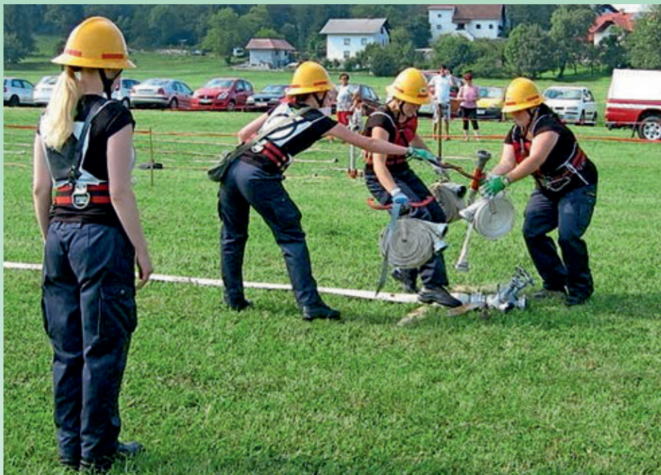
Vaja s hidrantom