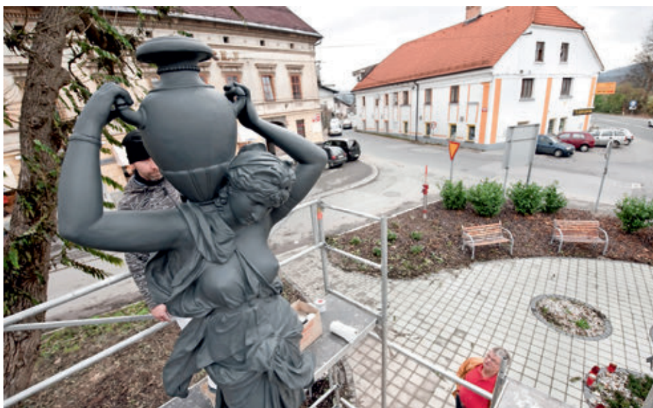
Logatec, Vodnjak z nimfo med obnovo leta 2009

Na nekdanjem trgu Franca Jožefa na Čevicah (zdaj park pri križišču Tržaške in Rovtarske ceste ter Tovarniške ulice) so po končani napeljavi logaškega vodovoda konec 19. stoletja postavili litoželezen vodnjak s kipom nimfe na vrhu. Vodnjak