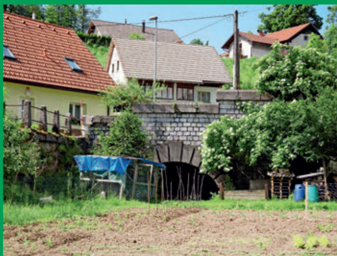
Severni portal predora normalnotirne železnice pod Čevci sredi Logatca. Severno od tu je bila velika vojaška pretovorna železniška postaja. Predor je bil zgrajen pred stotimi leti. Še danes je prehoden, le nekoliko zanemarjen.

M ed 1. in 20. septembrom leta 1916 so zgradili 12 kilometrov dolg odsek ozkotirne železniške proge od Godoviča do Idrije. Na tej razdalji se je proga spustila za skoraj 300 višinskih metrov. Od že obstoječe ozkotirne železnice proti Črnemu vrhu se je idrijski krak odcepil v Cestni kovi rajdi, to je takoj za predorom na cesti Godovič – Črni vrh.