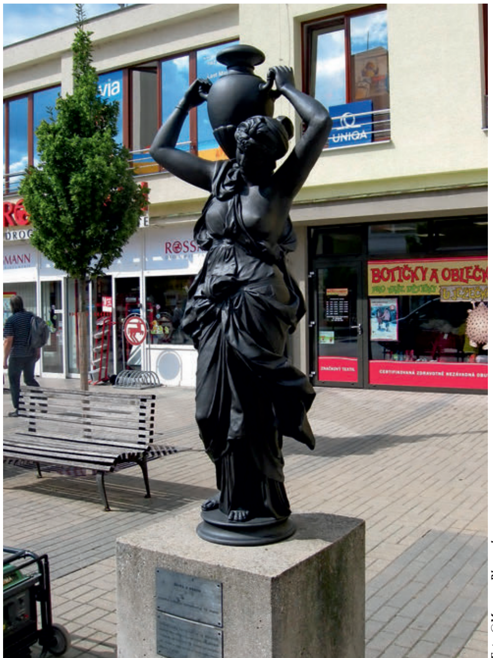
Fotografsko gradivo Blansko, Wanklovo náměstí, Nimfa (fragment nekdanjega vodnjaka)