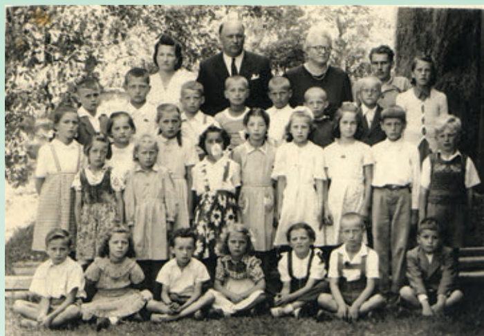
Šolsko leto 1957 (Last: M. Vidmar)