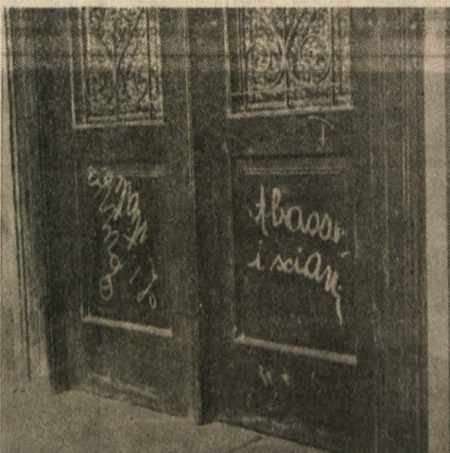
«GESLA» FAŠISTIČNIH KULTURONOSCEV NA VRATIH NARODNEGA DOMA

Računajo, da je samo vrednost premoženja denarnih zavodov v Trstu ob italijanski zasedbi znašala