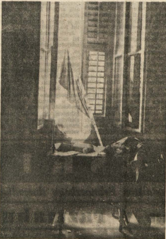
TAKO SO UNIČEVALI ITALIJANSKI FAŠISTI PROSTORE SLOVENSKEH USTANOV V TRSTU

2. Najstarejša tržaska zadruga «Gospodarsko društvo v Šcedni» (ust. 1. 1888), ki se je v zadnjih letih svo-