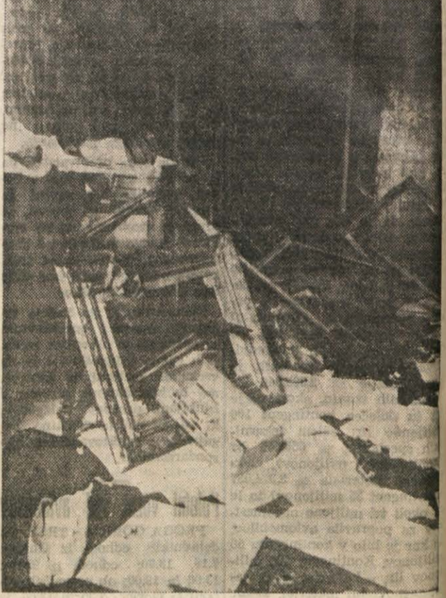
NOTRANJOST PROSTOROV SLOVENSKEGA NARODNEGA DOMA PO ZLOČINSKEM NAPADU GIUNTOVIH FAŠISTOV

Ceravno sem slutil nekaj hudega, vendar nisem mogel verjeti, da bi bili ti kulturonosi zmožni napraviti tak zločin: sežgati našo kulturno zgradbo. Malo pred 19. uro sem se odpravil iz urada, da grem v kavarno «Balkans» in družbi poslušati razbojniške klice proti nam. Ko pridem do vogala palače železniške direkcije, vidim, da so bila vsa okna in vrata Narodnega doma zaprta. V tem trenutku je pridrela po Ulici Roma in Ulici Galati fašistična vojska. Iz postopja naproti kavarni so že vrgli prvo bombo, ki je ravnala enega vojaka. Eden od italijanskih častnikov je takoj dejal: «E' riuscito bene. Ora abbiamo tutte le ragioni di vendicarsi. Istocassano je iz bližnje vojašnice pridrela skupina razbojnikov s tremi posodami bencina, medtem ko so drugi že razbijali vhodna vrata Narodnega doma, okna in vrata kavarne. Vdrli so v notranjost postolja, politi sta lahko skočila iz tretjega nadstropja. Hote ali nehoče, je