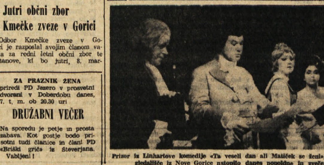
Prizor iz Linhartove komedije «Ta vesel dan all Matiček se ženi», s katero bo primorsko dramsko gledališče iz Nove Gorice nastopilo danes popoldne in zvečer v Katoliškem domu v Trzinu

V Gorici je danes ves dan in ponoči dežurna lekarna Cristofolotti, Travnik, tel. 29-72. TRZIC V Trzinu je danes ves dan in ponoči odprta lekarna dr. Rismond, Ul. Toti 52, telefon 73701. DEZURNA CVETLIČARNA Jutri bo v Gorici odprta cvetličarna Bandelj Jožef, Travnik, tel. 54-42.