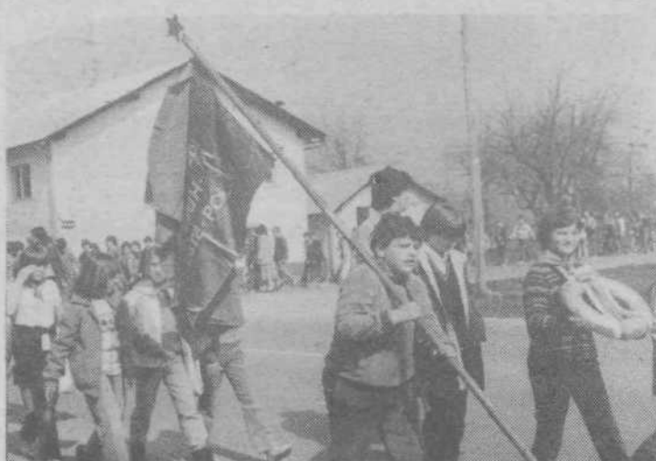
Tudi najmlajši so se pridružili deset — in desetisočim na pohodih Po poteh partizanske ljubljane. Na sliki so pionirji OŠ Karla Destovnika-Kajuha na pohodu proti Fužinam

Ce pogledamo analizo uresničevanja politike zaposlovanja v naši občini za prvih devet mesecev leta 1981, vidimo, da pogodbeno delo v primerjavi z letom 1980 upada. To pa še ne pomeni, da ga ni veliko, saj je bilo v lanskim omenjenih mesecih opravljenih 100.368 ur dela po pogodbah. Če pa primerjamo se obseg opravljenih nador, vidimo, da se je leta povečal in jih je bilo v prvih devetih mesecih lanskega leta oprav-