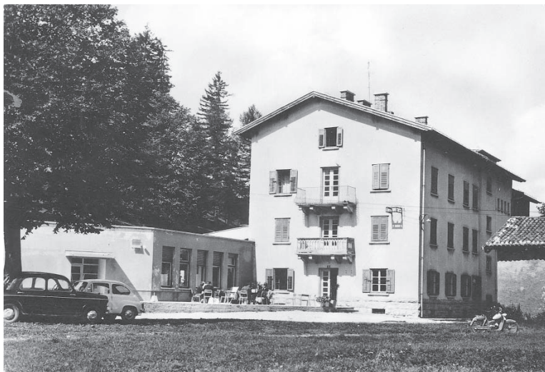
Lokve, razglednica s hotelom Poldanovec.

novi kot pri pospeševanju turističnega razvoja območja. 3