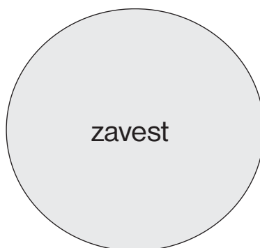
Shema 3: Spoznavanje III. Reda.

“Za druge, bolj kreativne, pa razodene razrešitev nasprotij svet, v katerem se osebna identiteta združi v vse procese odnosa v določeni široki ekologiji ali estetiki ali kozmični interakciji. Da lahko nekateri izmed njih preživijo, se zdi skoraj čudežno, vendar jih morda rešuje pred odplavljenjem na oceanskem občutku njihova zmožnost, da se osredotočijo na vsako minuto življenja.” (Bateson 1972)