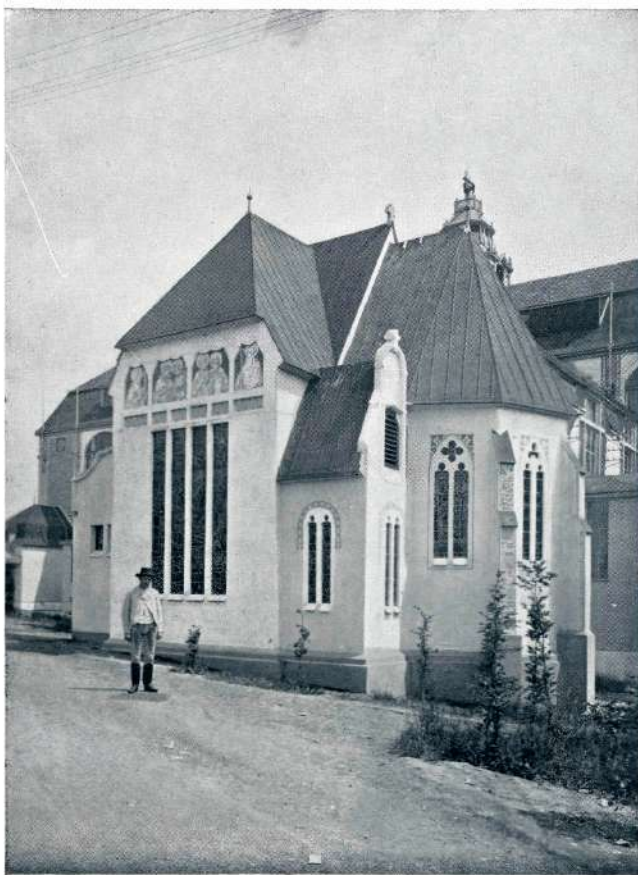
S PRAŠKE RAZSTAVE: CERKVICA KRŠČANSKE AKADEMIJE

Edini poskus do danes, spisati zgodovino slovanskega prava, je naredil Poljak Vacslav Aleksander Maciejowski v svoji knjigi: „Historja prawodawstw słowiańskich“. I. izdanje 1832 — 35. Toda ta poskus