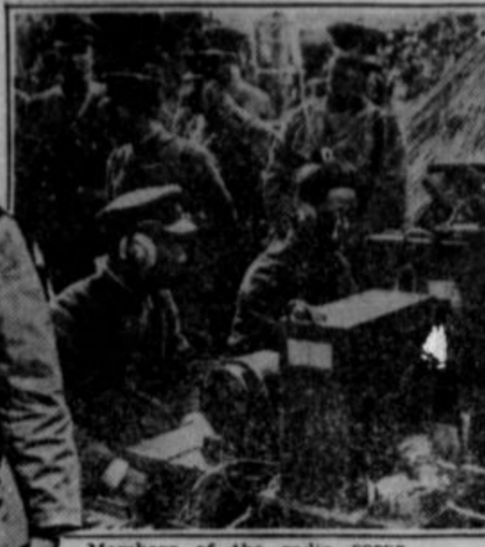
Members of the radio corps.