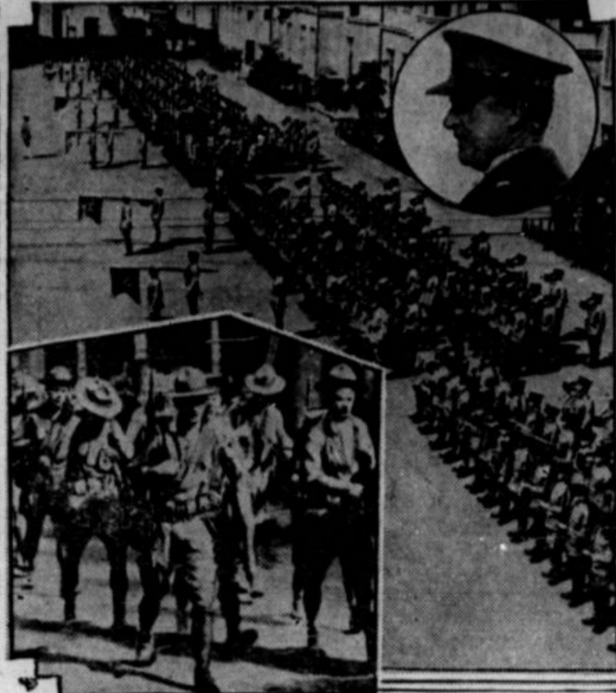
Japinci niso edini, ki imajo svoje čete na Kitajskem. Imajo jih tudi Zed. države, Anglija, Francija in druge imperialistične sile. Na tej sliki so ameriške čete v Tienstinu na Kitajskem, katere so radi demonstracij Kitajcev proti Japoncem mobilizirali za akcijo. Na vrhu na desni je ameriški poveljnik. Ameriške čete in vojne ladje so na Kitajskem zato, da protektirajo "ameriške interese". In pa seveda, da varujejo življenja Amerikancev. V resnici ima ta in druge imperialistične države Kitajsko v ključih samo radi tega, da jo izkoriščajo. To je temeljni vzrok, ki pojasnja, čemu se ogromna Kitajskja, ki je po prebivalstvu največja država na svetu, ne more nikoli toliko ojačati, da bi vrgla tuje vsiljivce na svojo hrbtno. Več o situaciji na daljnem vzhodu je pod sliko spodaj na 1. strani in pod sliko na 4. strani.