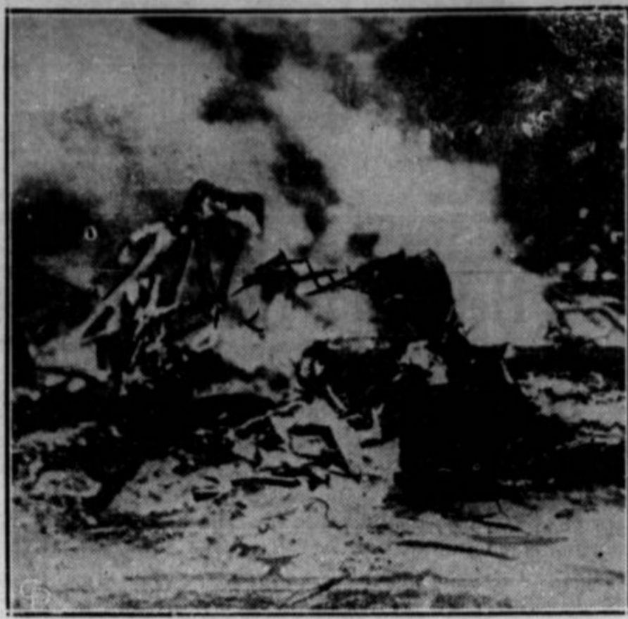
Z večanjem prometa v zračni plozbi se množijo tudi nezgode. Pred dobrim tednom je padel blizu Camdensa, N. J., na tla potniški aeroplan, ki je vozil med Newarkom in Washingtonom. Oba pilota in vsi trije potniki so bili ubiti. Na sliki je razbito letalo v plamenih.

stvo nad vsem temeljnim bogatstvom i dežele in vzelo to moč iz rok male skupine skrajno sebičnih in lopovskih denarnih kraljev, kateri sedaj vladajo to državo.