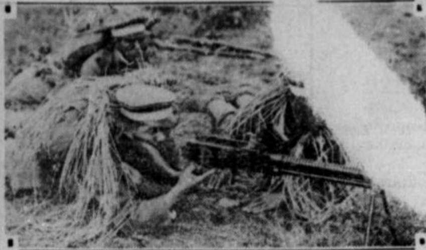
Machine gunners camouflaged as a rice field.