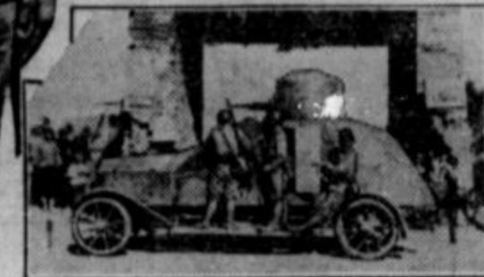
Machine gun truck.