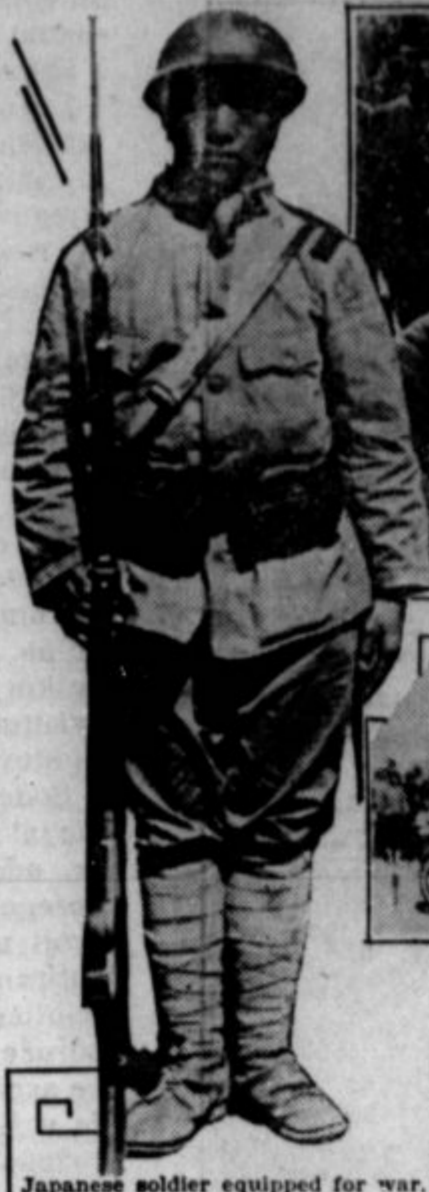
Japanese soldier equipped for war.