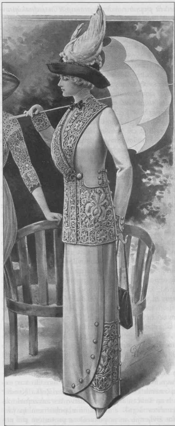
Prva slovenska ženska društva in aktivnost slovenskih žensk

Devetdeseta leta 19. stoletja so na Slovenskem pomenila nov prelom. Razmahnila se je neagrarna proizvodnja, naraščala je koncentracija kapitala, dobili smo prvi bančni kapital. Ponovno se je razmahnilo zadružništvo. V industriji je elektrika postopoma izpodrivala parno silo. Večina kapitala je bila v rokah tujcev, zlasti Nemcev. Njihova moč je naraščala z izkoriščanjem slovenskih naravnih bo-