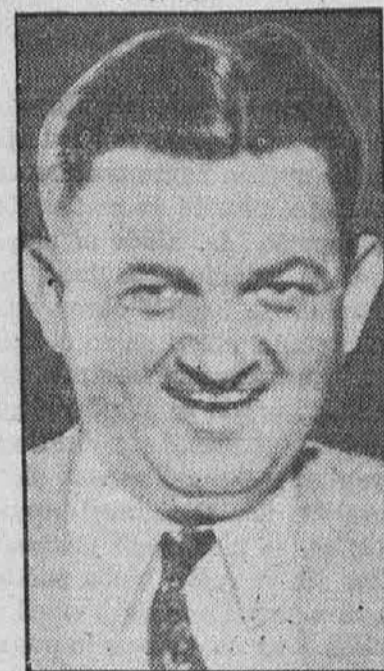
Governor Carl E. Bailey, iz Arkansasa, ki bo najbrže imenovan senatorjem na mesto umrlega senatorja Robinsona.

Dunaj, 20. avgusta. Kitajski finančni minister dr. Kung je naredil več pogodb z različnimi avstrijskimi industrijami za pošiljanje orožja in drugega vojnega materiala na Kitajsko. Naročilo oddano avstrijskim tvrdkam je vredno več milijonov dolarjev in je avstrijska vlada sama zelo vesela naročila.