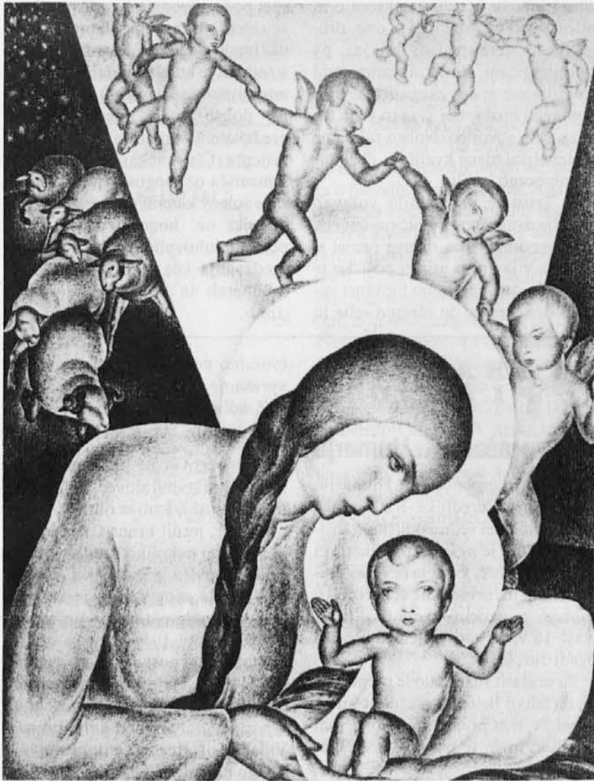
Tone Kralj, Rojstvo (litografija, 1931)

Spominjam se, da je v Soči delal reliefe za ciklus Puntarji. Ves čas, ko je bil v Soči, je bil ob prvih petkih pri spovedi, pri maši in obhajilu. Zvečer je z nami molil kleče rožni venec. Bila so vojna leta in zaradi pomanjkanja marsičesa ni bilo najti. Med vojno sva nekajkrat šla skupaj v gore, enkrat čez hribe v Bohinj,