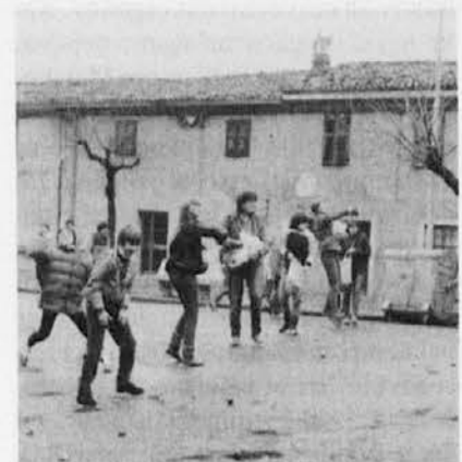
Lučanje v Boljuncu leta 1993

daj v štirih »nabrali« 17 lir in si tako lahko privoščili vsak po dva kilograma kruha.