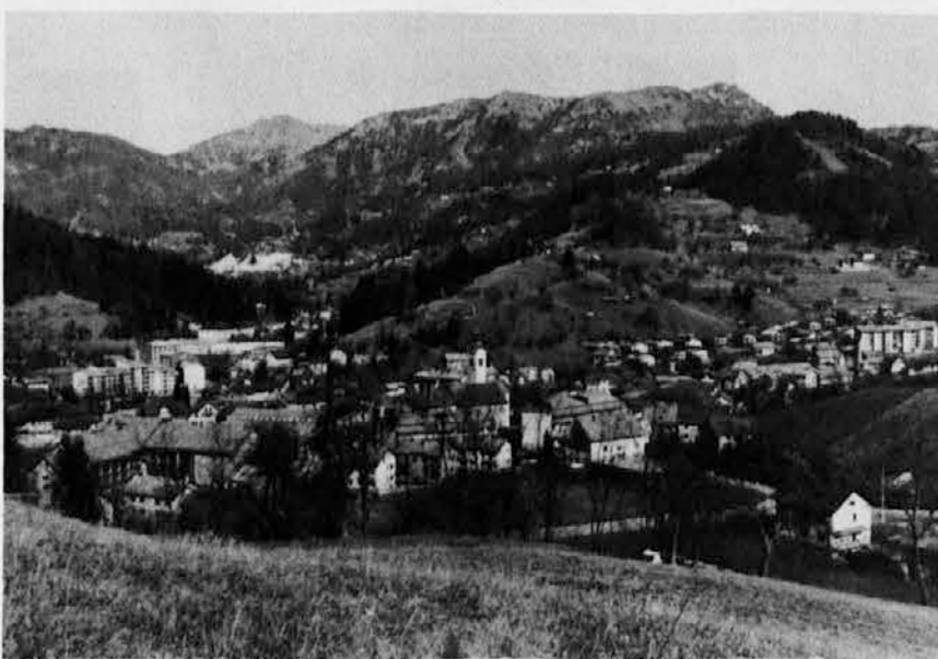
Pogled na Cerkno