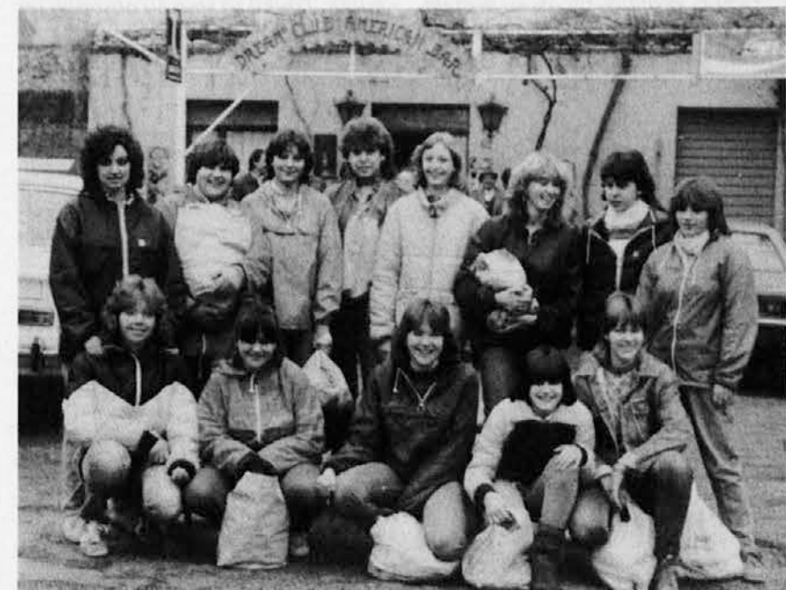
Skupina deklet pred lučanjem

Pesem so peli brez spremljave. Posebno melodijo je imela samo prva kitica.