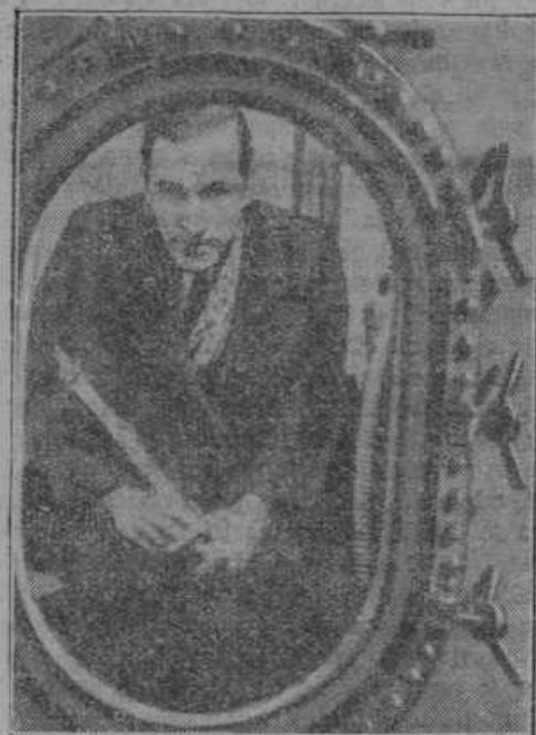
Amerikanec Ridye se hoče dvigniti v balonu 40.000 m visoko.

Huda železniška nesreča se je zgo- dila dne 15. t. m. v bližini Poznanja na Poljskem. Na železniškem mostu pri postaji Mlyn je stal osehni vlak, v ka- terega je zadel drug potniški vlak. V enem vagonu je bilo 50 šolskih otrok. Nesreča je zahtevala 10 mrtvih in 50 ranjenih. Med ponesrečenimi so po ve- čini šolski otroci.