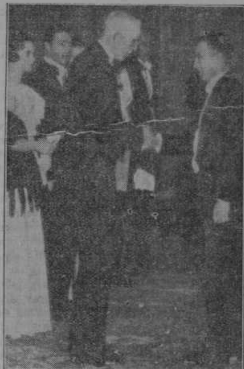
Švedski kralj Gustav podeljuje Nobe- lovo nagrado, o kateri smo letos obšir- no pisali v našem listu.

Zahtevajte povsod »Slovenskega gospodarja«!