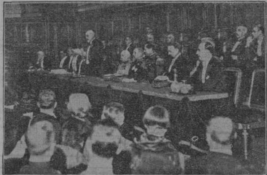
Na visoki šoli v Parizu se je vršila slavnostna seja, na kateri so počastili Francozi angleška letalca, ki sta letos dne 4. aprila preletela Mount Everest, najvišjo goro na svetu.

psu. Ta stvar se izvrši na dvorišču v velikem škafu. Vselej pa nastane strašanski hrup; kakor hitro opazita psa, da vleče Padovka škaf na dvorišče, izgineta. Tedaj se začne iskanje in divji lov, pri čemer Padovka tako kriči, da mi je hudo radi sosedov.