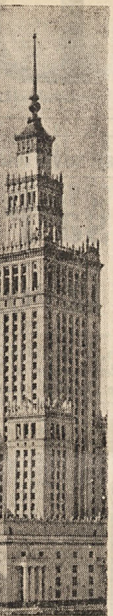
Palaca kulture in znanosti v Varšavi

Z naše strani, ker smo skupni s tovariši socialisti v večini, smo ponudili široko možnost sodelovanja ljudem in gibanjem vsem demokratičnim strankam, kjer nimamo večine in soračujemo, smo pripravljene na široko politiko enotnosti in ne postavljamo predpogojev za našo partijo, ne zapiramo vrat demokratičnim elementom, ki pripadajo kateri koli strani politične uvrstitve. Hočemo pa vedeti, za kaj volimo politiko, za kaj volimo župane in občinske odbore. Istočasno pa svarimo demokrate pred nevarnostjo kompromisov in kapitulacije. Svarimo jih pred nevarnostjo, da bi popustili sprčo izsiljevanja s komisarijem. Zato postavljamo kot pogoj skupno preučitev programa, da bo ta odgovarjal zahtevam in potrebam ljudstva. V upravnih nam ne bodo predstavniki etnostranske zveze, špekulanti, taki, ki ropajo krajevne finance.