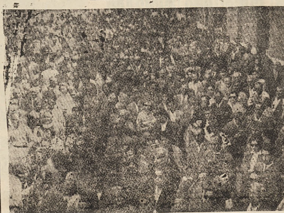
V nedeljo so tržaški antifašisti in demokrati Slovenci in Italijani počastili spomin prvih žrtvev Rižarne, ki so jih nacisti sežgali 22. junija 1944. Neopozabnega tragičnega dne so vrgli v peec 20 moških in 20 žensk. Komemoracije se je udeležila množica Tržačanov...