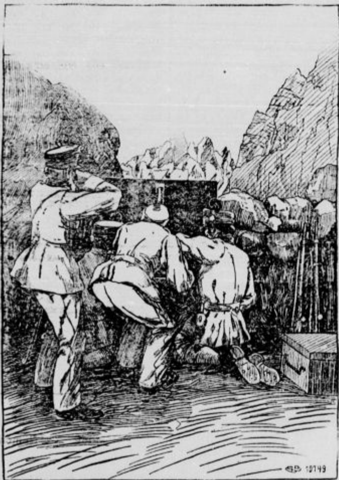
Prostovoljni tirolski strelci ob italijanski meji.

Turki prodirajo proti Egiptu. »Köln. Volkszeitung« ve povedati, da korakajo številne turške kolone proti Sueškemu prekopu. Vsak dan je slišati o praskah prednjih straž. Angleške čete se pa nahajajo vsak dan v boju s sovražnimi rodovi.