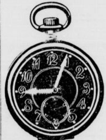
Lastna znamka „IKO“ najboljši zanesljiva ura.

tako se sliši mnogokrat popraševati ljudi, kateri pač imajo uro v žepu ali na steni, ampak svoji lastni uri ne verjamejo, ker je le slaba, netočna, vedno stoječa bazar ura. Kdor nasprotno ima Suttnerjevo uro, ve vedno natanko, kako pozno je.