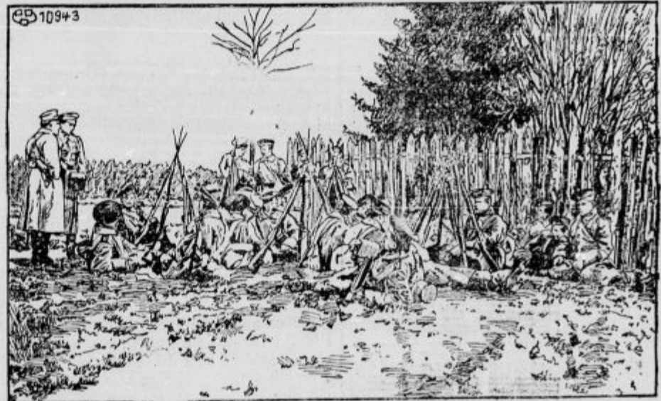
Ruska infanterija na odmoru.

Vojne pošte, ki sprejemajo poštno za-voje: št. 6, 10, 12, 13, 14, 15, 17, 19, 20, 22, 23, 24, 25, 26, 27, 28, 29, 30, 31, 32, 33, 35, 36, 37, 38, 40, 41, 42, 43, 44, 47, 48, 50, 52, 53, 54, 55, 56, 57, 58, 59, 60, 61, 62, 63, 64, 65, 66, 67, 68, 69, 70, 71, 72, 73, 74, 75, 76, 77, 78, 79, 80, 81, 83, 84, 85, 86, 87, 88, 89, 90, 91, 92, 93, 94, 96, 97, 98, 100, 101, 102, 104, 105, 106, 107, 108, 109—113, 116, 118—121, 123, 124, 126—128, 130, 132, 134, 135, 137, 139, 141, 142, 143, 144, 148, 154, 155, 156, 157, 158, 160, 161, 162, 163, 164, 165, 166, 167, 171, 172, 173, 174, 175, 177, 178, 179, 181, 182, 183, 184, 200, 201, 202, 204, 206, 207, 208, 209, 212, 213, 214, 215, 216, 217, 218, 219—225, 231, 232, 251, 252, 253, 254, 255, 301, 302, 303, 304, 305, 306, 309, 310, 311, 312, 313, 314, 319, 320, 321, 322, 323, 325, 326—330, 350, 351, 352, 353, 354, 355, 501, 502, 503, 504, 505, 506, 507, 601, 602, 603, 604, 605, 606, 607, 608, 609, 610, 611, 612, 613, 614, 615, 630.