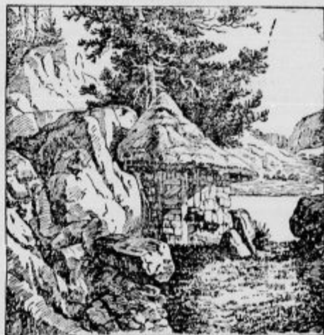
Kje je naseljenec?