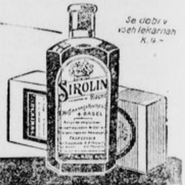
Se dobi v vseh lekarnah K. 4-