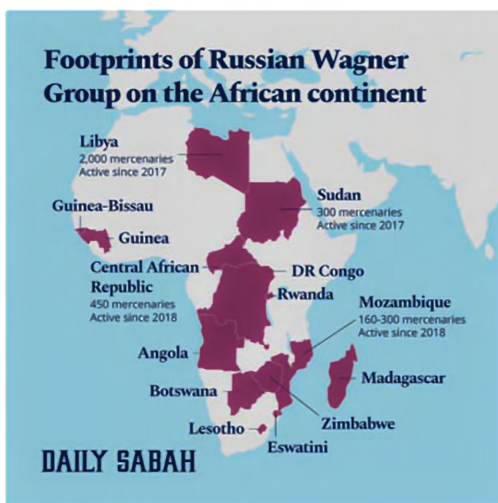
Slika 6: Dejavnosti zasebnega vojaškega podjetja Wagner v Afriki ( https://www.dailysabah.com , 6. 3. 2021)

An infographic of the countries that Wagner Group operates in on the African continent, March 4, 2021.