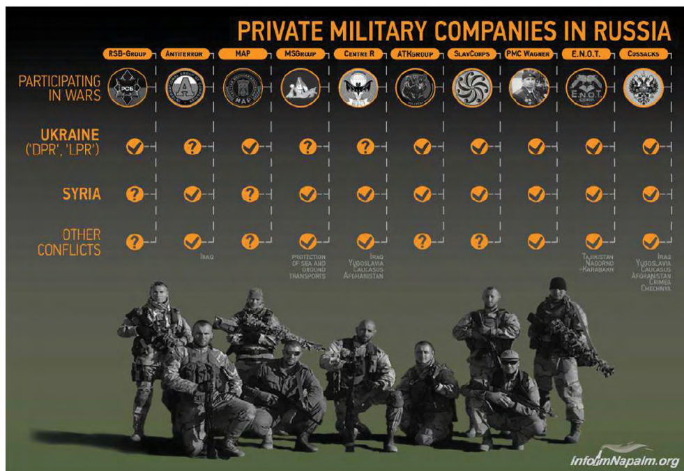
Slika 2: Ruska zasebna vojaška podjetja, ki so bila udeležena v konfliktu v Ukrajini (Armed Conflict in Ukraine, 2015)

Jugoslaviji in Moldaviji (Pridnestrje), 8 pozneje pa so imeli pomembno vlogo pri okupaciji Gruzije. 9 Po isti shemi je Kremelj pod krinko »prostovoljcev, ki jih navdihujejo ideje o zaščiti ruskih interesov,« na Krim, v Donbas in Sirijo poslal najemnike, povezane z ruskimi obveščevalnimi in varnostnimi službami (Gusarov, 2015).