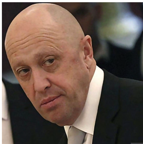
Slika 3: Lastnik in vodja podjetja Wagner, Jevgenij Prigožin