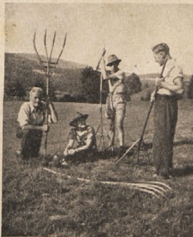
Po otavi.