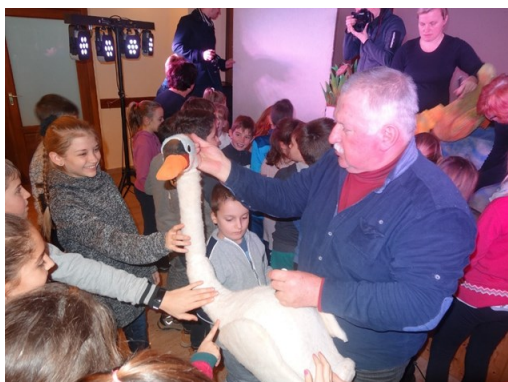
Grajsko lutkovno gledališče Sevnica