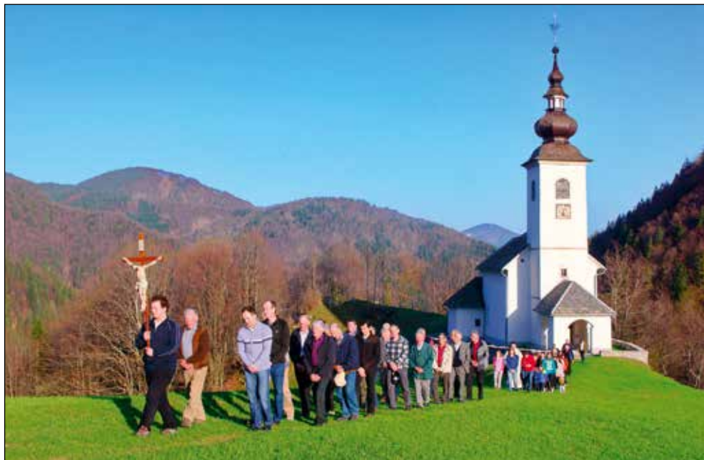
Cerkev sv. Marka v Spodnjih Danjah.