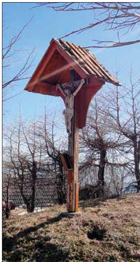
Razpelo na Torki.