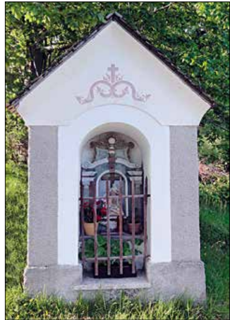
Kapelica v Dolini, Tolarjeva kapelica.

izzid postavili kapelico." 17 V župnijski knjigi je poročilo o devetletni sodbi. "15. in 16. 6. 1928, še enkrat pride komisija zaradi soriške in danjarske pravde. Sodnik iz Loke in trije advokati gredo oba dni na planino, v nedeljo pa na pošti denejo v zapisnik vsakega posameznika. Stvar stoji bolj za Danjarje, ker so le ti bolj solidarni, Soričani pa bolj zivjajo, 11 veleposestnikov se ne udeležuje sodbe. Revež tisti, ki bo nosil stroške in izgubil tožbo." 18 Spor je zabeležen še leta 1930. Po pričevanju domačinke je spor segal zelo daleč naprej v vojno in povojni čas.