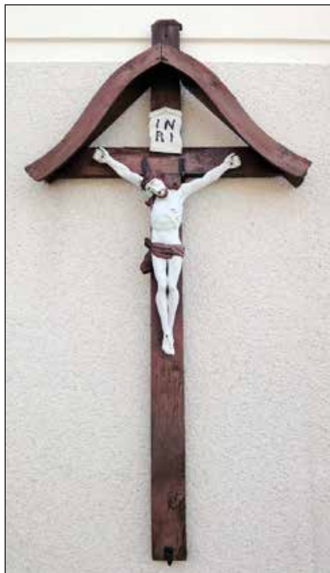
Razpelo na Ejbmarjevi hiši v Sorici.