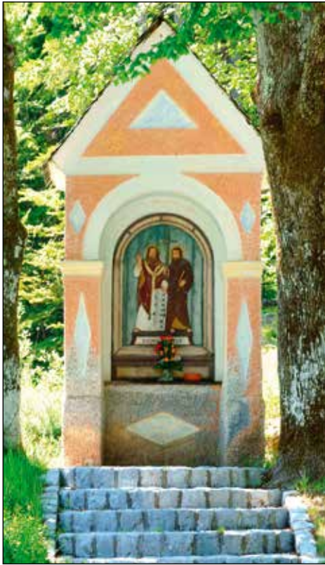
Kapelica Cirila in Metoda na Roštu.