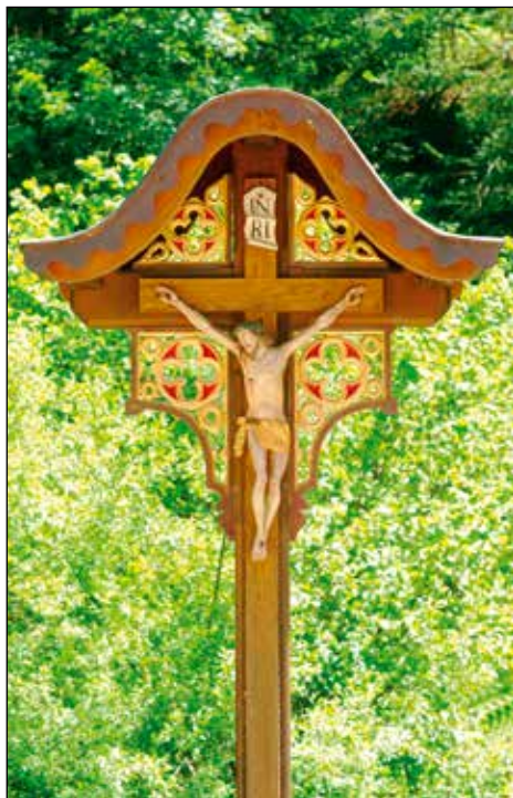
Podroštarjevo znamenje.

Ob vstopu v soriško krajino navdihuje, izžareva posebno lepoto in vzbuja spoštovanje Podroštarjevo razpelo, ki je bilo obnovljeno po poplavih leta 2008. Ne ve se sicer, od kdaj je križ tukaj, verjetno pa sega njegova starost v prvo polovico 19. stoletja. Postavljeno je na točki, kjer je bil razcep poti, razpotij, nasproti, kjer je in je bila gostilna. 5 "Pred tem je bilo obnovljeno pred dobrimi 40 leti. Takrat so obnovili škarpo ob vodi, na novo zabetonirali podstavek, postavili novo ograjo in obnovili streho. Križ je kljuboval vsem nevšečnostim in naravnim spremembam do poplav leta 2007, ko je bil zelo poškodovan. Takrat pa je bil potreben temeljite obnove s sodelovanjem g. Jerneja Hudolina, celotne stroške pa je prispevala Podroštarjeva mama, Marija Okorn. Zabetonirali so temelj za zid.