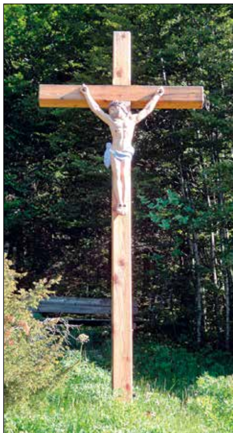
Križ na Robu, Soriška planina.

Križ na Robu 1911 – "24. septembra 1911, na kvaterno nedeljo, sem blagoslovil križ na