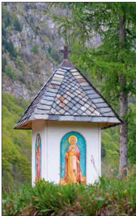
Kapelica na Eknu pred Zabrdom.

Upodobitve: Mlada žena z orglami ali violino. Pred tem so jo uprizarjali s palmo in knjigo. Raffaello jo je naslikal z vencem iz rdečih in belih vrtnic. 19