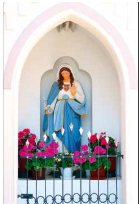
Kapelica pri stari pošti v Sorici.

Med Sorico in Spodnjimi Danjami, na Rotku, stoji kužno znamenje , ki ga je leta 1929 dal prenoviti župnik g. Mikuš. "Na Rotku se popravi novo znamenje, slike je poskrbel g. Karlin od Simona Ogrina,