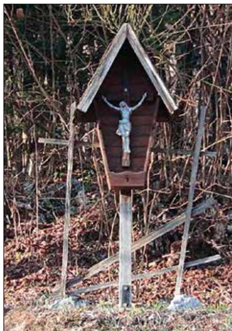
Razpelo v Ravnah.