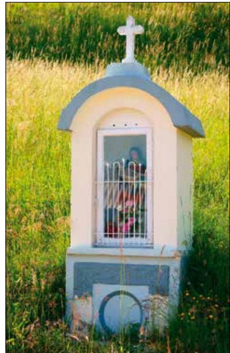
Kapelica ob poti v Spodnje Danje.