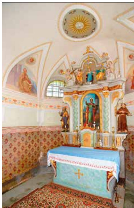
Oltar v cerkvi sv. Marka.

ču, da se njihova podružnica spremeni v župnijo.