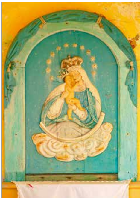
Marijina podoba iz kapelice na Grobah.