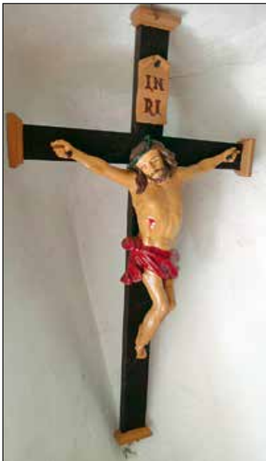
Čufrov – Bogkov kot v Zabrdu.