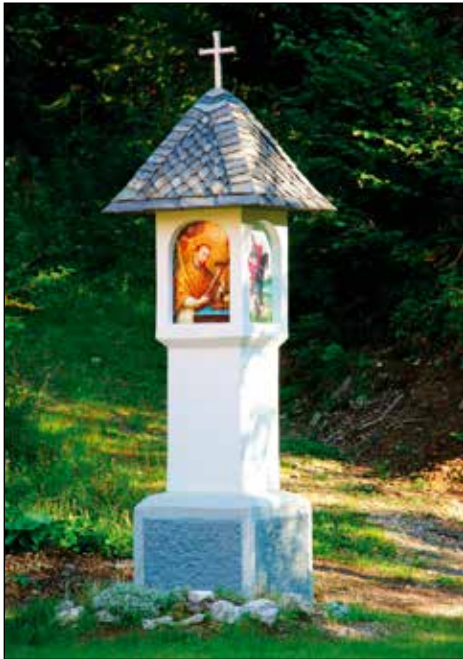
Kužno znamenje na Rotku.