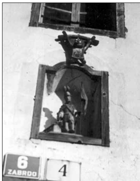
Sveti Florjan nad vrati Eberlove hiše v Zabrdu – nekoč.