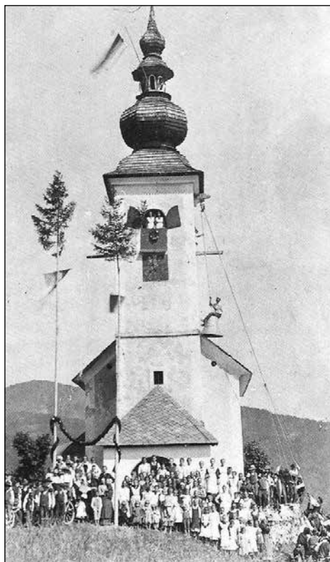
Blagoslovitev danjarskih zvonov.

Zidava: Datum zidave ni znan, prav tako ni znano, kdaj je bila zgrajena župnijska cerkev. Valvasor v prvi izdaji Slave Vojvodine Kranjske leta 1689 (VIII, str. 307) piše, da je selška župnija imela deset podružnic. Našteva podružnice selške fare, h kateri je nekoč spadala tudi soriška cerkev. V tem seznamu ne omenja podružnične cerkve sv. Marka. Iz tega se lahko sklepa, da je nastala kasneje, proti temu pa govori zgradba cerkve sama, ki je veliko starejša od župne cerkve. Prav tako govori v prid temu ustno izročilo, da je bila danjarska cerkev sezidana veliko prej kot soriška. Ko so se vršila prizadevanja, da bi se soriška podružnica spremenila v župnijo, je potekala velika borba in prepir. Prepir je bil med Soričani in med prebivalci vasi: Ravne, Torka, Zabrd, Zgornje Danje in Spodnje Danje, ki so stale na stališ-