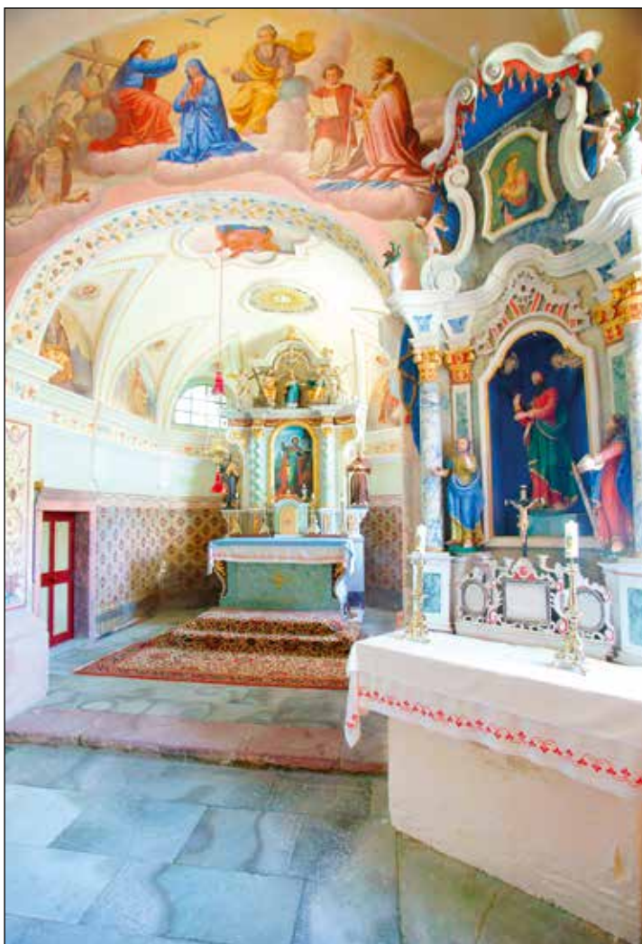
Cerkev sv. Marka, oltarji.

Upodobitve: Evangelista Marka upodabljajo s kri-latim levom, z odprto knjigo oziroma s črnilnikom in peresom.