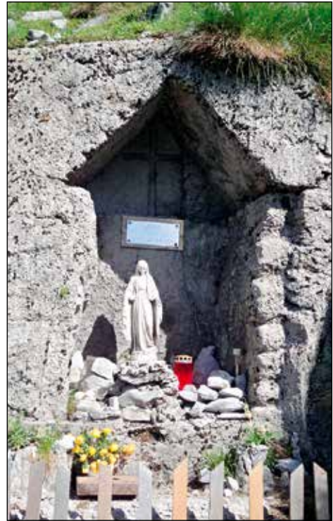
Kapelica na Koru, Soriška Planina.

Kapelico pred vasjo Sorica, na Grobi, je dal postaviti župnik Karlin leta 1904. Za to kapelo je bil narejen lesen kip Srca Jezusovega. "V procesiji s farnim banderom so fantje iz spodnje vasi nesli kip Srca Jezusovega okrašenega na nosilih." 12 Prej je tu stala nizka kapelica, ki so jo podrli, in postavili novo stran od poti. Ob rušenju kapelic po osvoboditvi je bil kip poškodovan in ponovno restavriran. Danes se nahaja v župnijski cerkvi na stranskem oltarju. V župnijski kroniki Sorica je datum poslikave leta 1906. V tem letu je bila tudi 250. obletnica soriškega vikariata. Danes jo krasi slika na les: Marija z detetom.