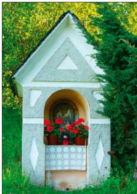
Kapelica Pr' Žnidarju.

Kapelica na cesti Pr' Žnidarju je manjša, posvečena Žalostni Materi Božji, tudi to kapelico krasijo iz lesa izrezljan reliefni kip.