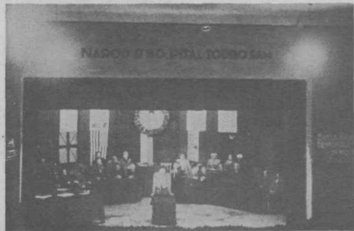
Zasedanje zbora odposlancev slovenskega naroda, od 1. do 3. oktobra 1943

Takoj po sprejemu obvestila, da jih bodo odpeljali z brzovlakom iz Zaloga (tako so storiili že s prvo skupino, a se je od nje poslovilo le nekaj Založanov, ki so prišli na postajo z rdečimi nageljmi), so komunisti organizirali akcijo in o njej ob-