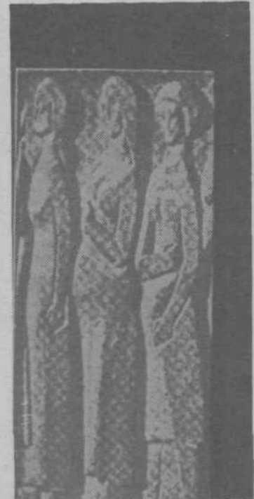
Spomenik ženam pred ljubljanskim sodiščem (kamen — delaj)

Nekoga moraš imeti rad, pa čeprav trave, reko, drevo ali kamen, nekomu moraš nasloniti roko na ramo, da se, lačna, nasiči bližine, nekomu moraš, moraš, to je kot kruh, kot požirek vode, moraš dati svoje bele oblake, svoje drzne ptice sanj, svoje plašne ptice nemoči — nekje vendar mora biti zanje gnezdo minu in nežnosti —, nekoga moraš imeti rad, pa čeprav trave, reko, drevo ali kamen — ker drevesa in trave vedo za samoto — kajti koraki vselej odidejo dalje, pa čeprav se za hip ustavijo —, ker reka ve za žalost — če se nagne nad svojo globino —, ker kamen pozna bolečino — koliko težkih nog je že šlo čez njegovo nemo srce —, nekoga moraš imeti rad, nekoga moraš imeti rad, z nekom moraš v korak, v isto sled — o trave, reka, kamen, drevo, molčiči spremljevalci samotnežev in, čudakov, dobra, velika bitja, ki spregovore samo, kadar umolknejo ljudje.