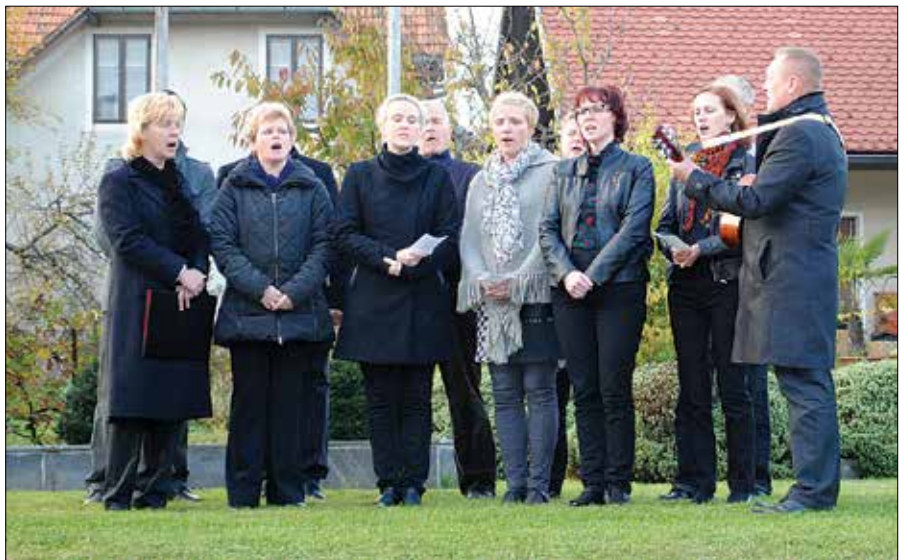
Ob spomeniku padlim na Ljubnem ob Savinji je pevski zbor zapel partizanske pesmi.