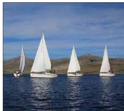
V lepem jesenskem vremenu in tekmovalnem vzdušju pomorcev Jadralnega kluba Savinja se je uspešno iztekla prva regata.

Skiper zmagovalne barke Boštjan Podlesnik se je takole veselil uspehov: »Zmagovalno jadrati iz plova v plov in na koncu osvojiti regato s štirimi plovi je za skiperja in ekipo prvovrstni