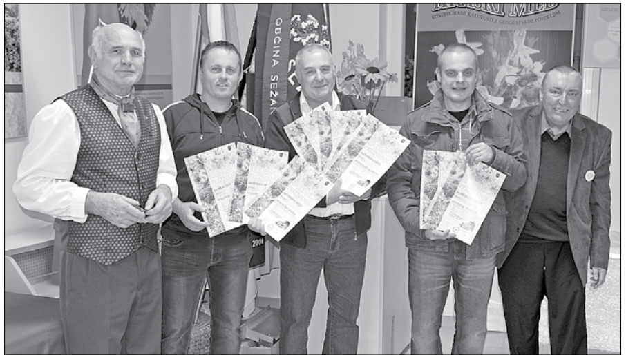
Bera priznanj čebelarjev iz Čebelarke zveze Savinjsko-šaleškega območja je bila res zavidljiva.