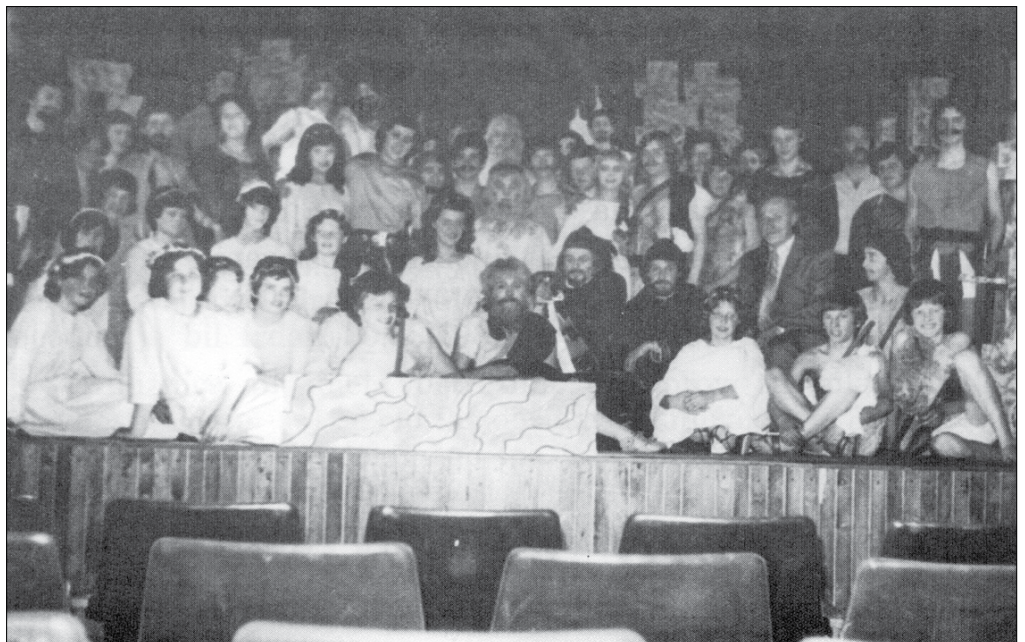
Igra Pod svobodnim soncem leta 1978