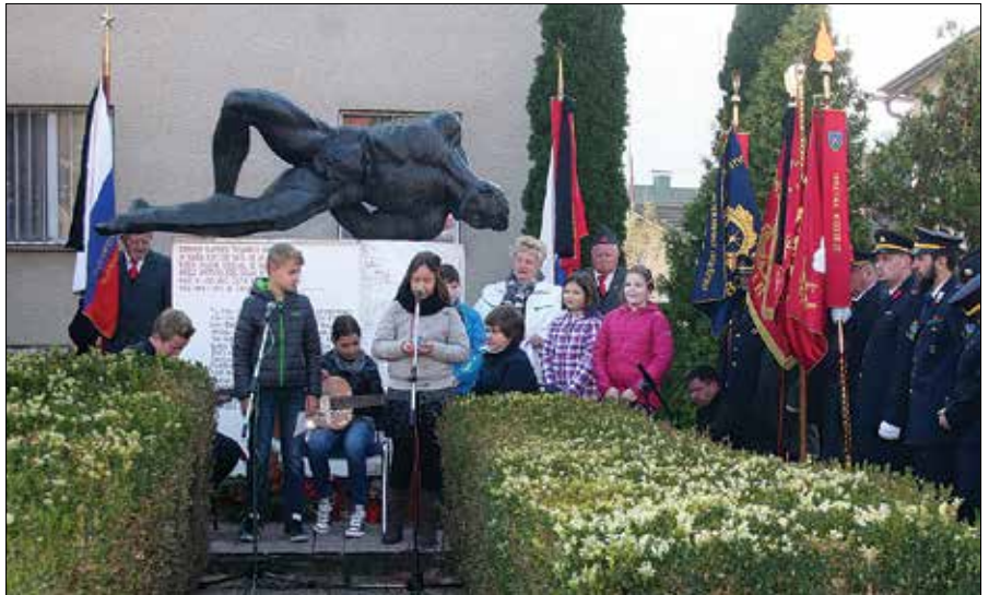
V programu so sodelovali mozirski šolarji in z igranjem na različne inštrumente, s pesmimi in deklamacijami dodali svoj del k razumevanju dogodka.