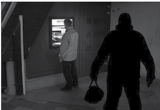
V večernih urah pri bankomatu v Nazarjah ni dovolj razsvetljave, hkrati pa je odmaknjen od centra, zato v društvu upokojencev predlagajo, da dobi bolj primerno lokacijo.