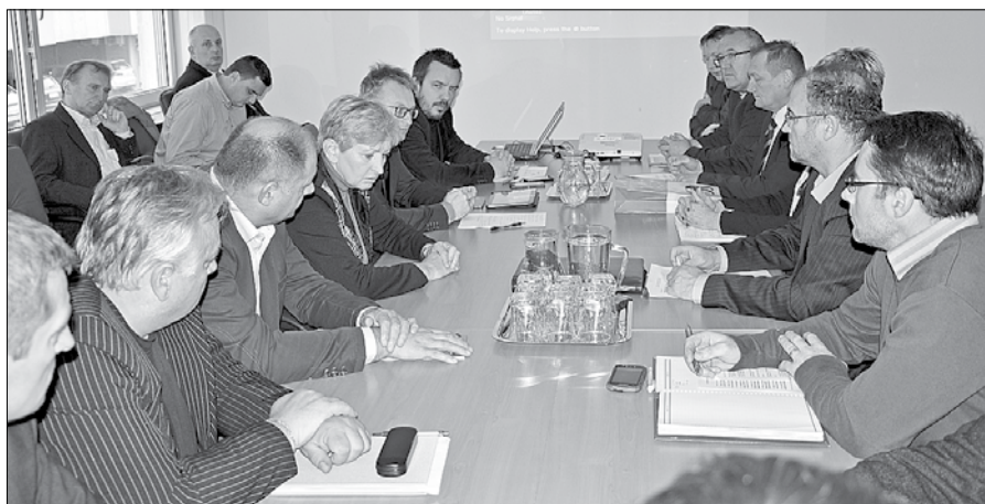
Predstavniki Spodnje in Zgornje Savinjske doline so ministrici Ireni Majcen predstavili svoje videnje urejanja protipoplavne zaščite na območju Savinje.

Dogovorili so se, da bo ministrstvo potem,