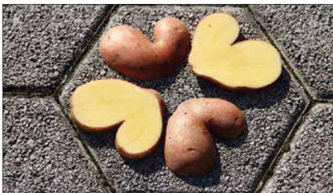
Z malce kirurgije je nastala srčna krompirjeva roža, ki spominja na cvet trobentice.