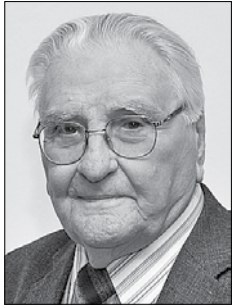
Piše: Aleksander Videčnik