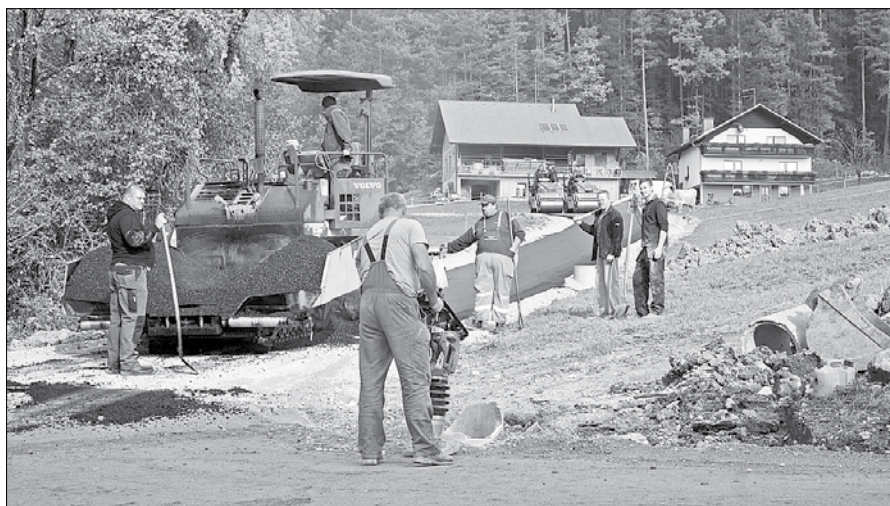
Občina Mozirje je s pomočjo Leponjivčanov modernizirala štiri odseke cest.