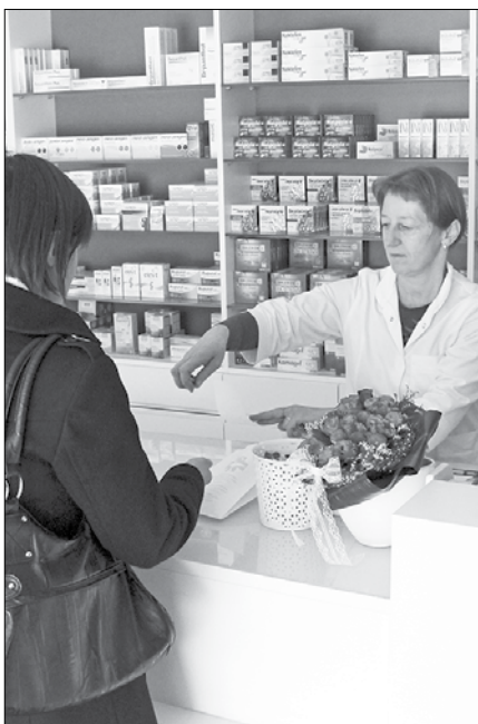
V lekarnah bo manj možnosti, da pride do napak v primeru nečitljivo napisanega recepta.

Še ena prednost tega sistema je možnost preverjanja interakcije med zdravili in uvedba kontrole za posamezne rizične skupine. Tako se verjetnost, da pride do neželenih težav pri predpisovanju določenega zdravila, bistveno manjša. Zdravniki bodo imeli preko sistema vpogled v vsa predpisana zdravila, ki jih je pacient prejel