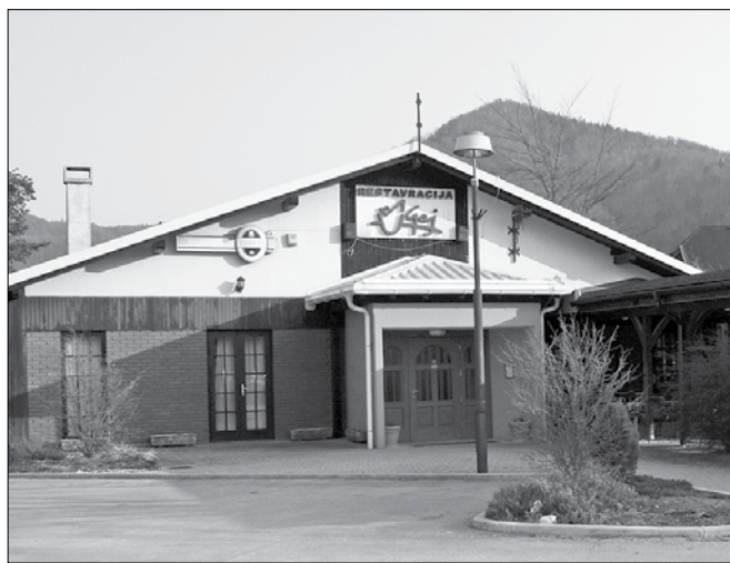
Bo restavracija Gaj na dražbi dobila novega lastnika?