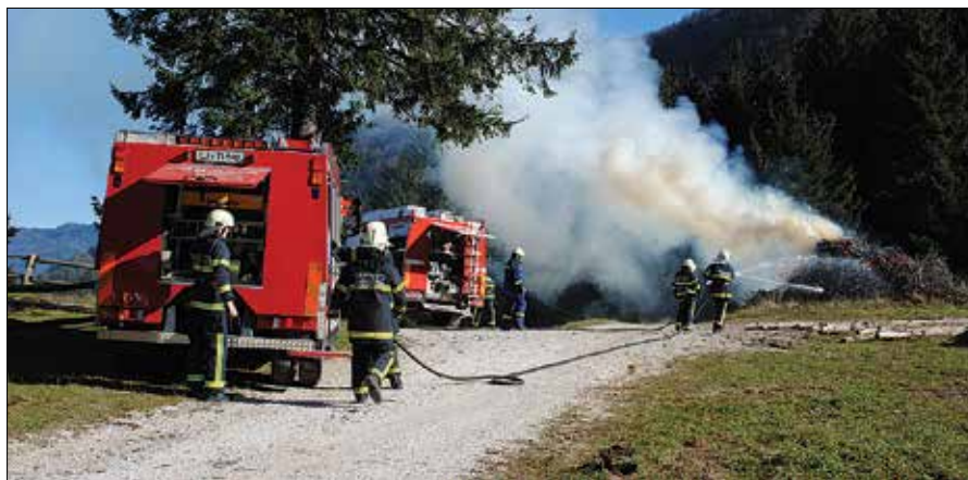
Na vaji so med drugim preverili, kako hitro se lahko cisterna preseli do drugega požara in pogasi tudi tega.