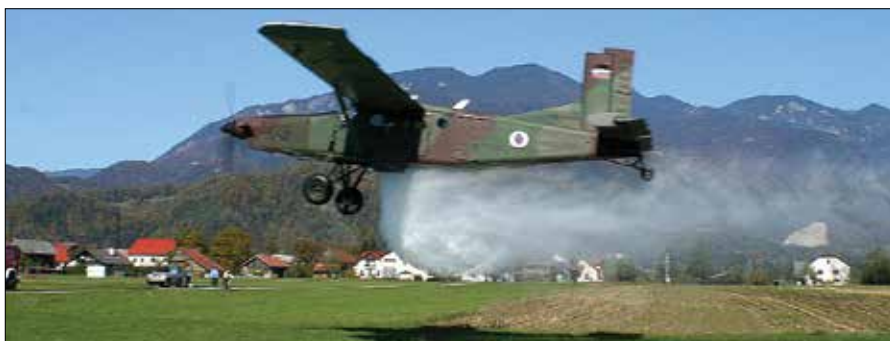
Pilatus je odmet vode demonstriral na bližnjih površinah, da so si ga lahko ogledali številni prisotni gledalci, petkrat pa je poletel na požarišče.

vlje in PGD Rečica ob Savinji. Rečiški gasilci so skupaj z gasilsko enoto za posredovanje v visokogorju iz PGD Luče na Borseki markirali požar in izvedli komunikacijo s pilotom letala, da je odmet vode dosegel svoj cilj in namen.