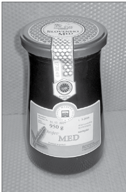
Slovenski kozarec za med s prelepko SMGO potrjuje vsebino kontrolirane kakovosti.

kom priznanj. Poudaril je: »Ocenjevanja so dvignila zavest o kvaliteti medu in pridelavi varnih čebeljih pridelkov.« Pozval je čebelarje, da se sedaj povežejo v združenje proizvajalcev, konzorcij ali kakršno koli obliko, da se bodo lahko odzvali na različna povpraševanja po večjih količinah tega odličnega medu.