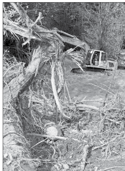
S pravočasnimi ukrepi bi bila lahko škoda zaradi poplav manjša.

Ministrica je še predstavila nameravano reorganizacijo na področju upravljanja voda, kjer se bo javno službo in investicijske projekte z na novo ustanovljeno Direkcijo RS za vode izvajalo še z večjim sodelovanjem lokalnih skupnosti, s čimer bo upravljanje postalo tudi bolj učinkovito. Pri tem so zgornjesavinjski