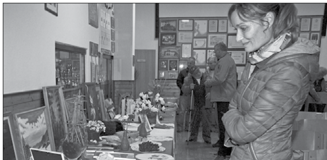
Svoja dela je na ogled postavilo dvanajst krajanov Šmartnega ob Dreti.

Razstavo so pospremili s predstavitev njihove borčevske