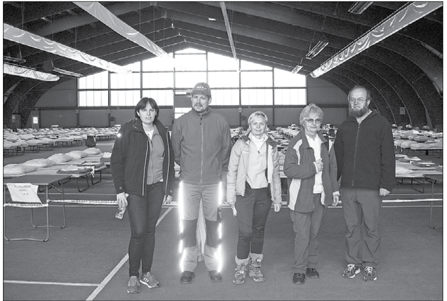
Prostovoljci, ki so se v zbirni center v Celju odpravili v organizaciji župnijske Karitas Mozirje-Šmihel, pred veliko, pravkar počiščeno halo za sprejem beguncev.

Prostovoljci sedmih območnih združenj Rdečega križa s celjske regije, tudi naše, v Celju po potrebi pomagajo pri pripravi postelj, delitvi hra-