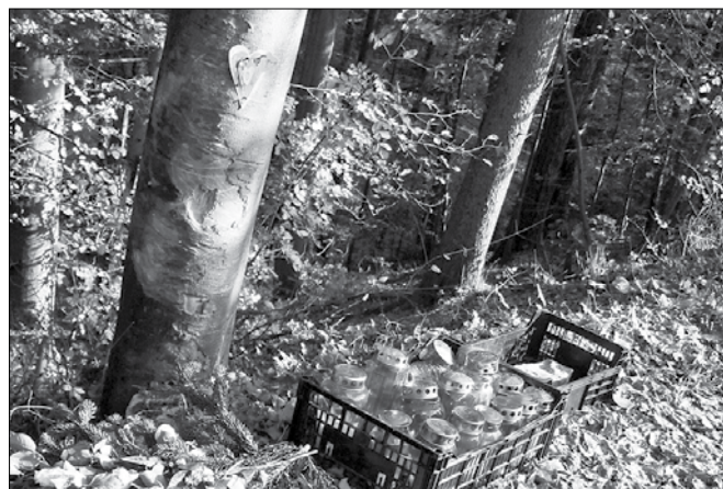
Srčne bolečine Vidovih in Tomaževih najdražjih so zapisane tudi na ogromni bukvi.

Izguba je zelo prizadela tudi sotovariše gasilce iz PGD Mozirje, ki so izgubili mladega člana, gasilca, izjemnega človeka. Črne niso bile le zastave na njihovem gasilskem domu, na domovih svojcev preminulih. Črne misli so se plazile v ljudeh, ki so v sončnih dneh nemo stali ob grobovih in doživljali to nepojmljivo tragedijo.