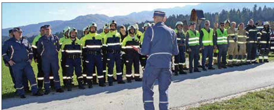
Vsega skupaj je na vaji sodelovalo okoli 30 operativnih gasilcev, v pripravljenosti za dodatno okrepitev pa so bila društva ljubenskega občinskega poveljstva.