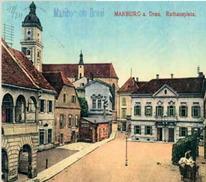
Razglednica Rotovškega trga v Mariboru. Učenci primerjajo Rotovski trg nekoč in danes.

pri pouku zgodovine. Tako si lahko učenci pri pouku zgodovine ogledajo podobo svojega kraja nekoč in to primerjajo s sedanjo podobo. Ugotavljajo nastale spremembe, odkrivajo novosti, sklepajo o posledicah ipd. 6