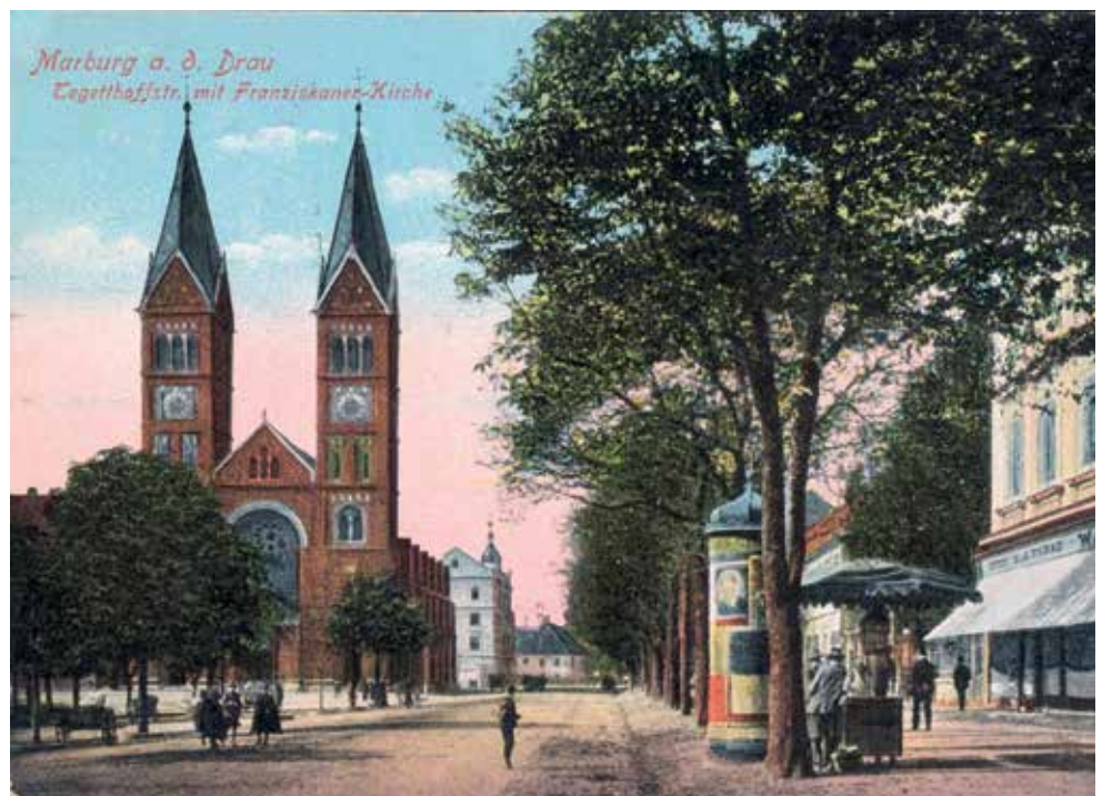
Tegethoffova cesta s frančiškansko cerkvijo okrog leta 1910.

Razglednica na levi strani prikazuje Pivnico pri moki, kjer so bili prvi prostori Slovenske čitalnice v Mariboru. Razglednico uporabimo ob razlagi narodnega prebujanja v Mariboru. Mariborski Slovenci vse do izgradnje Narodnega doma leta 1898 v mestu niso imeli primernih prostorov za svoj gospodarski in kulturni razvoj. Društva so delovala v neprimernih prostorih, še največkrat v lokalih, tako kot npr. najpomembnejše slovensko društvo v Mariboru pred letom 1918, Slovenska čitalnica. Razglednica, ki je nastala še v času Avstro-Ogrske, je zanimiva tudi po tem, da je opremljena s štampiljko Maribor ob Dravi . To nam dokazuje, da je bila odposlana po prvi svetovni vojni, ko so Slovenci že živeli v Kraljevini SHS. Še vedno pa so uporabljali stare razglednice, ki so jih le opremili s slovenskimi napisi.