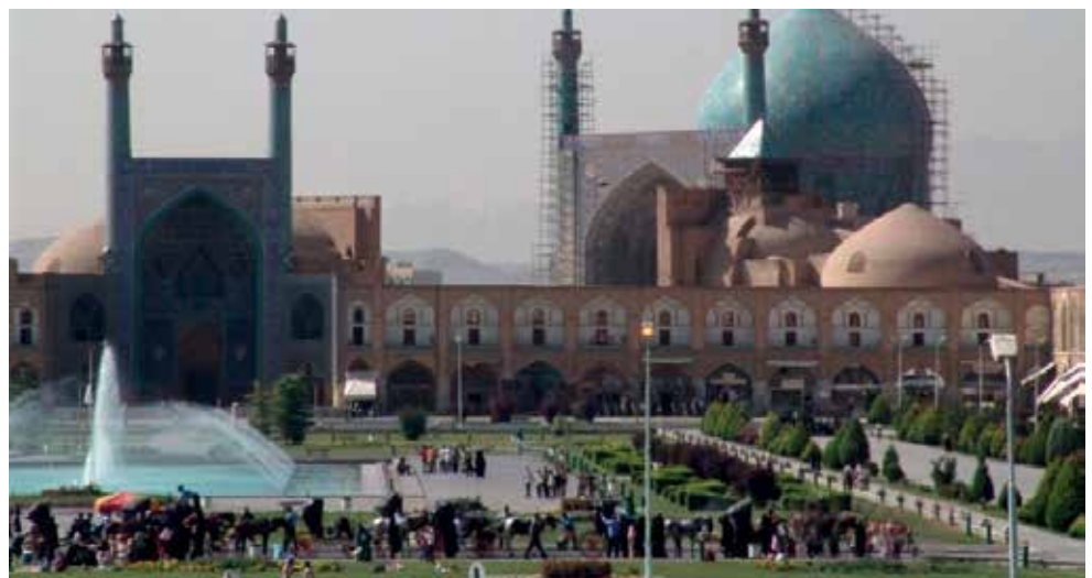
Imamov trg v Esfahanu v Iranu.

Fotografija prikazuje tujo vojaško misijo, ki jo je sprejel general Maister. Fotografijo uporabimo ob razlagi dramatičnih dogodkov leta 1918/1919, ko je general Maister z odločno akcijo priboril Maribor novonastali državi Kraljevini SHS. Opis: že v prvih prevratnih dneh je v Maribor prispela francoska vojaška misija. V mestu sta francoska gosta ostala do ustanovitve prve jugoslovanske vlade v Beogradu. Francoska vojaška misija je bila Maistru in Slovencem zelo naklonjena. Rada je zahajala v slovensko družbo, zanimala se je za Maistrove vojaške akcije, za politično in gospodarsko ureditev upravne oblasti. S svojimi objektivnimi poročili je koristila Maistru.