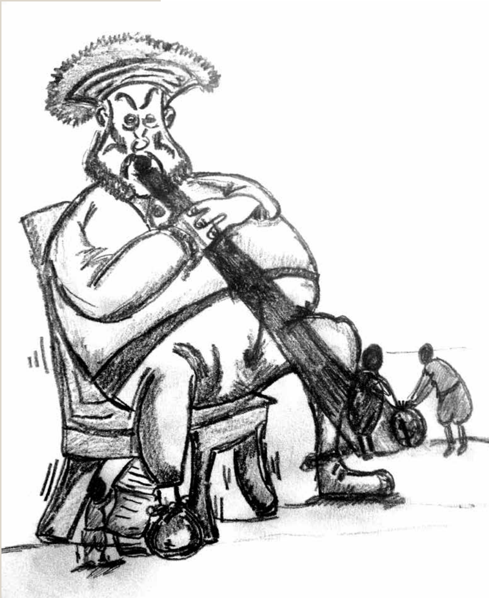
Gargantua. (Po predlogi skicirala Lina Potočnik.)

vsaj na zunaj nevidna. Učinek karikature, njene kritike in kaznovanje Daumierja pa so dolgoročno destabilizirali oblast Ludvika Filipa. 10