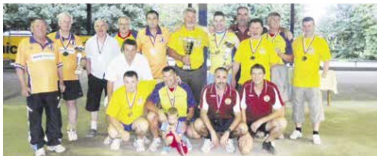
Budničarji si tudi v letu 2016 želijo veliko tovrstnih fotografij.

Balinišče na Količevem radi obiščejo tudi invalidi, ki so vedno deležni pomoči domačega kluba, pa naj gre za tekmovalja, treninge ali rekreacijo. Tako je bilo v letu 2015 na balinišču organizirano prvenstvo Medobčinskega