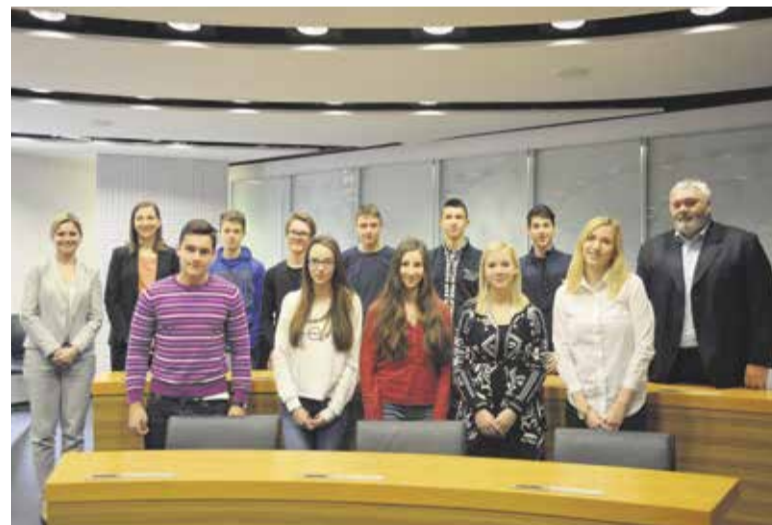
Novi štipendisti Občine Domžale

prostega časa, jim zaželel, da izpolnjujejo vse pogoje štipendijskih pogodb in si tako štipendije zagotovijo do konca