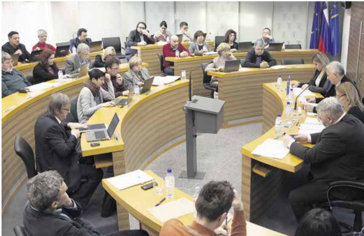
Občinski svetniki na prvi seji v 2016