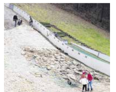
Delovna akcija odstranjevanja plastike