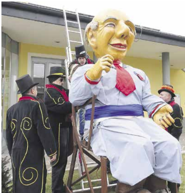
Striček gre na streho lekarnarje.