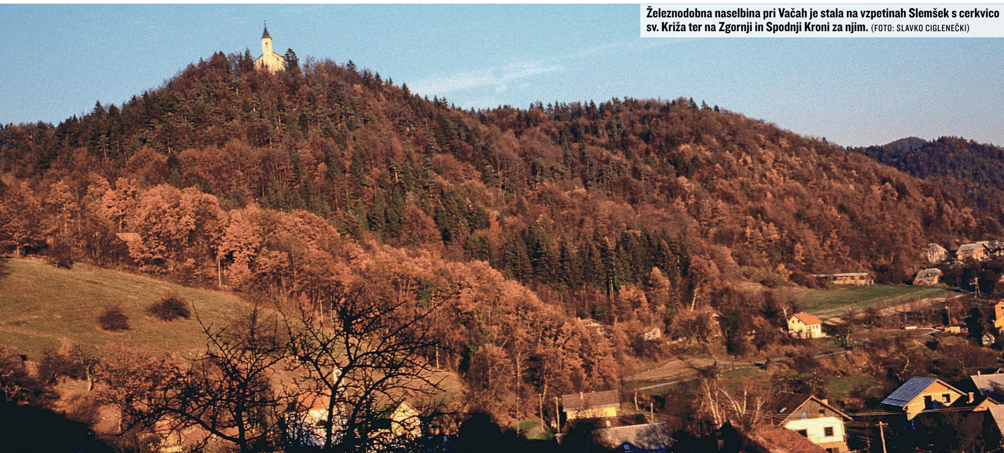
Železnodobna naselbina pri Vačah je stala na vzpetinah Slemšek s cerkvico sv. Križa ter na Zgornji in Spodnji Kroni za njim.