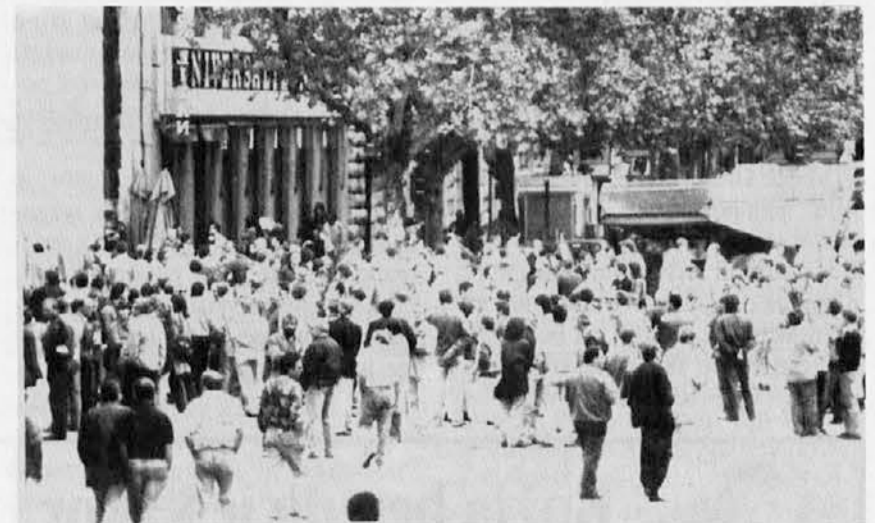
Vsakodnevni prizor s tržaških ulic v zadnjih dneh