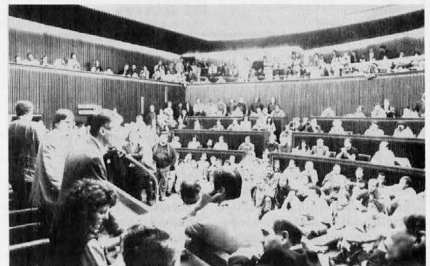
Tržaški župan Illy z delavci v dvorani deželnega sveta FJK