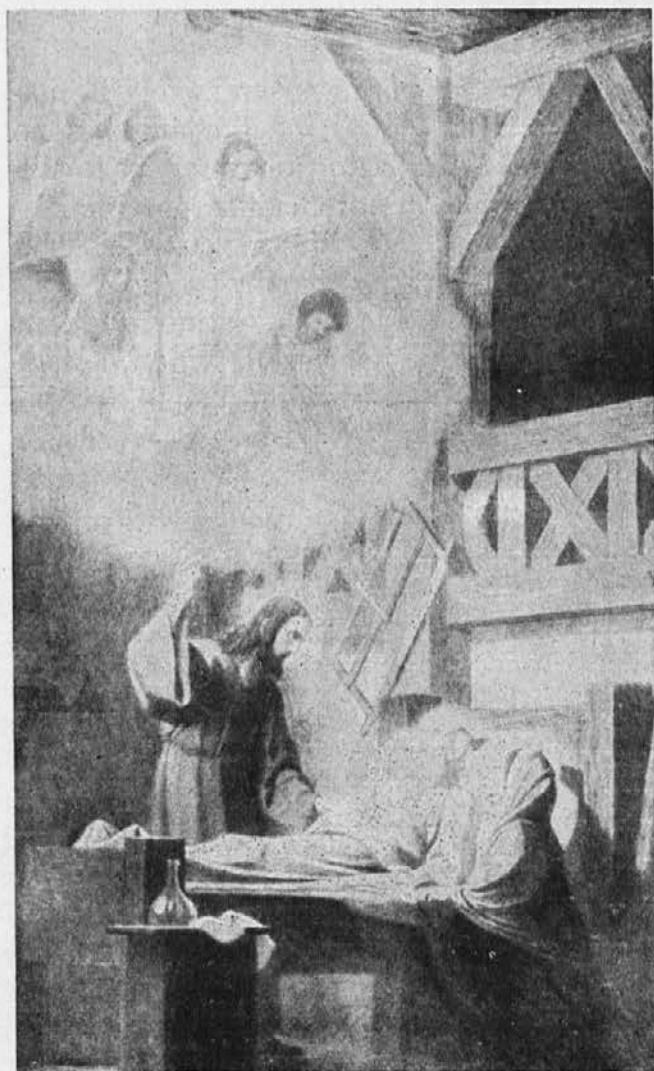
Da bi tudi mi nekoč tako umirali!

O moj Bog, če umrjem DEVETO uro, naj mi pride na pomoč Devica Marija, ki je Jezusa v naročju nosila, in naj me prenese v nebeško kraljestvo!