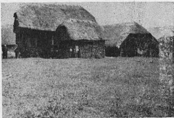
Gospodarska poslopja v Strugah.

na Bled, bi mi zmanjkalo časa za Struge. Bilo je nekaj posebnega videti rojstno hišo moje matere, cerkev in vas. Vzela sem nekaj slik tega starega doma in sem zelo razveselila ž njimi mater, ko sem se vrnila nazaj v Ameriko.