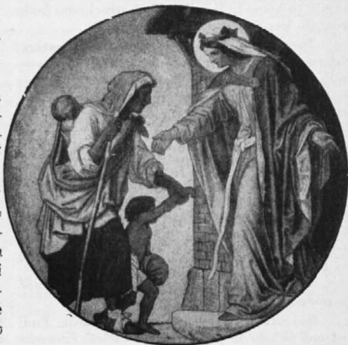
Sv. Elizabeta, vzor krščanske žene.

Urednikov pripis: Ta članek je napisala preprosta slovenska žena, ki pristopa vsak dan k sv. obhajilu. Skoraj dobesedno sem ga priobčil. Samo nekaj pravopisnih stvari sem popravil. Nisem pa mogel te žene pregovoriti, da bi mi dovolila podpisati njeno ime. Preveč je skromna. Mislim, da tako pisanje izpod peresa "ene izmed njih" boli gane bralke kot še tako lepa pridiga v cerkvi. Bog daj, da bi rodil ta spis med našimi ženami mnogo sadu!