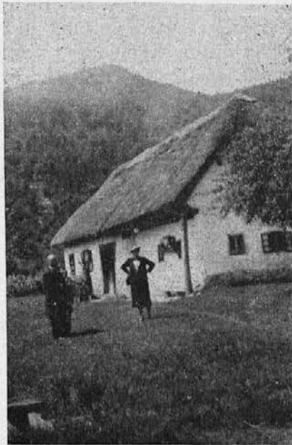
Dom njene matere v Strugah.

Vse je bilo prav tako, kakor mi je mati tolikokrat opisovala: ljubke "kapelice" ob cesti in cerkev v vsaki vasi. Na Brezjah sem ostala čez noč in bila pri sveti maši ob pol šestih. Potem sem se z vlakom vrnila v Ljubljano in od tam z avtom v Struge. Če bi bila šla z Brezij