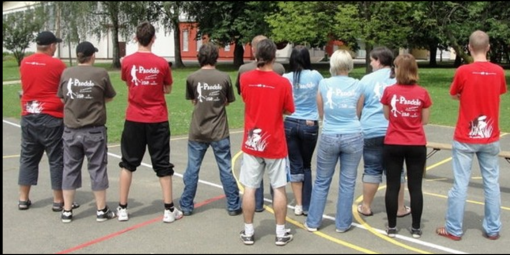
Besedilo: Andrej KELENC