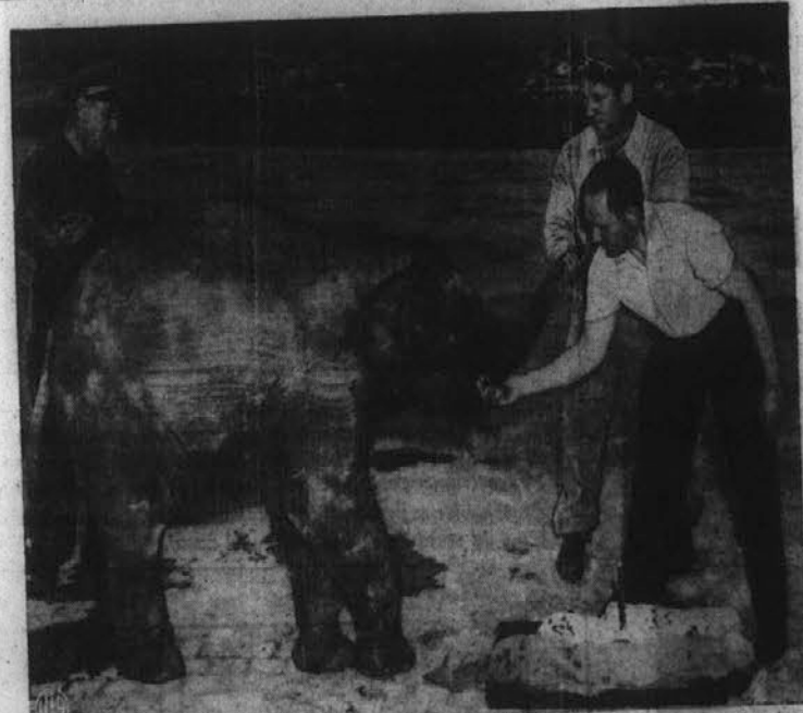
Ta pa ni sladkosnedna. — Roma, slonova samica v rimskem živalskem vrtu, je te dni obhajala svoj prvi rojstni dan. V ta namen so jo počastili z veliko torto. Ker pa ni sladkosnedna, s tem ni bila zadovoljna in je s svojo veliko nogo poteptala torto. Stirje strežniki so bili pripravljene in ji postregli, da je vsaj malo pokusila "birthday-cake."