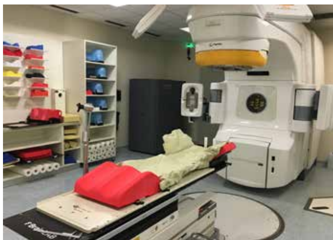
Slika 2. Podlaga za SBRT z vakuumsko blazino, s katero zmanjšamo premike med obsevanjem na najmanjšo možno mero.

Na CT-posnetkih zdravnik natančno oriše tumor in zdrava tkiva ter organe. Za vsakega od teh tkiv in organov moramo pri pripravi obsevalnega načrta upoštevati dovoljeno dozo, ki jo določeno tkivo lahko prejme, da se izognemo resnim neželenim učinkom, ki se lahko pojavijo že med zdravljenjem, še pogosteje pa kasneje