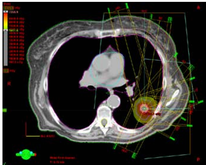
Slika 3. Plan obsevanja. Tumor obsevamo z več polji iz različnih smeri, ki so usmerjene v tumor.

po zdravljenju. Obsevalni načrt pripravi medicinski fizik s poglobljenim znanjem s področja sevanja, za potrditev vsakega obsevalnega načrta pa se odloči radioterapevt, ki bolnika pozna in upošteva njegove morebitne druge bolezni ali lastnosti, ki bi lahko vodile v zaplete zdravljenja. (Slika 3 in 4)