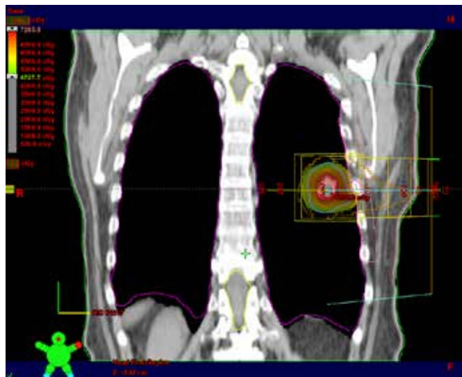
Slika 4. Plan obsevanja na vzdolžnem rezu.

Za pravilen potek in izvedbo obsevanja pod nadzorom zdravnika ter fizika poskrbijo radiološki inženirji. Ob vsakem posameznem obsevanju s slikovnim preverjanjem kontroliramo ujemanje trenutne lege tumorja in načrtovanega obsevalnega polja.