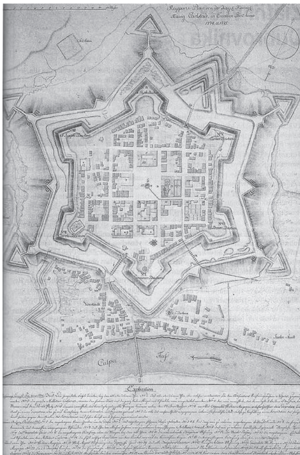
Trdnjava Karlovec ( https://upload.wikimedia.org/wikipedia/commons/9/94/Renaissance_star-shaped_fortress_in_Karlovec%2C_Croatia_%28designed_in_1774%29.jpg ).

je Vojna krajina pričakala tudi leto 1683, ko je zares izbruhnila vojna in so osmanske čete korakale proti Dunaju ter ga neuspešno oblegale. Kljub temu neuspehu je ta t. i. druga dunajska vojna divjala še vse do leta 1699, ko je bila naposled v Sremskih Karlovcih podpisana mirovna pogodba, s katero je Osmansko cesarstvo izgubilo skorajda vso Ogrsko. 48 Cesarstvo je tedaj denimo pridobilo Slavonijo ter dele Srema in Like; vse te nove kraje so ob različnih izzivih, težavah in uporih postopoma vključevali v obrambni sistem Vojne krajine. 49 Po miru v Požarevcu leta 1718 pa se je že začela postopna temeljita reforma in reorganizacija Vojne krajine, v kateri so vsa področja življenja urejale vojaške oblasti. 50