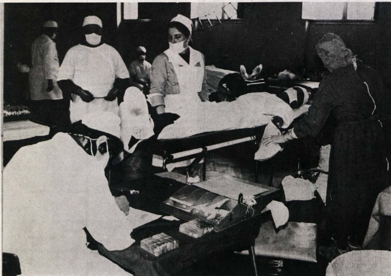
Triinosemdeset članov kolektiva BETI je ob nedavni krvodajalski akciji darovalo svojo kri. Hvala jim!

Metliška mladina bo 17. novembra vrnila obisk Karlovcem. Okrog 120 mladincev si bo ogledalo mesto, pomerili pa se bodo v košarki, kegljanju, namiznem tenisu in šahu. S predstavniki družbenopolitičnih organizacij se bodo pogovarjali o mladinskem delu in nadaljnjem sodelovanju.