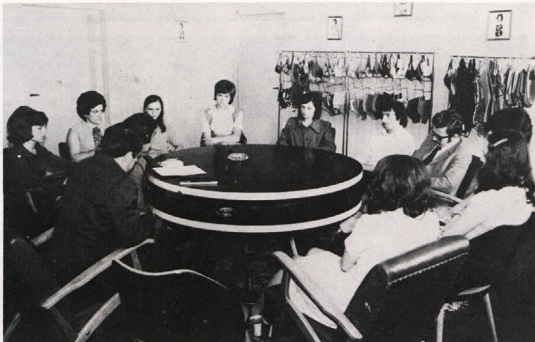
Sprejem mladih v Zvezo komunistov. Posnetek je bil narejen že pred meseci in škoda je, da zadnje čase naš fotoreporter nima priložnosti slikati kaj podobnega.

Novost dopolnjenega pravilnika je tudi v tem, da je višina OD trgovskih zastopnikov odvisna poleg dosežene realizacije še od stanja dolžnikov. Od osnove (realizacije) se odštejejo vse terjatve nad 90 dni; to pomeni, da od tistega dela prodaje, ki ni