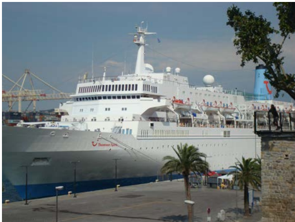
Slika 1 Potniška ladja

045 – druga opredmetena osnovna sredstva