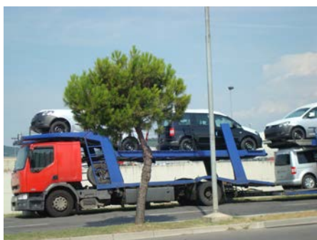
Slika 5 Tovorni avtomobil

*Podjetje lahko uveljavlja odbitni (vstopni) DDV pri nakupu vseh avtomobilov, ki niso osebni.