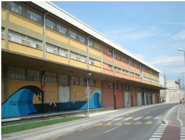
Slika 4 Skladiščna zgradba