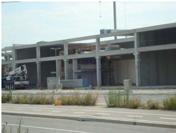
Slika 3 Gradnja poslovnega objekta