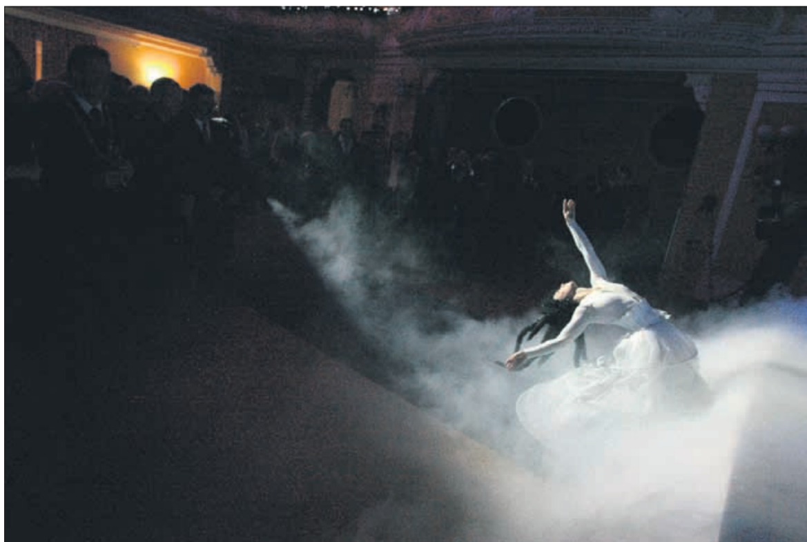
S prednovoletnega sprejema celjskega župana