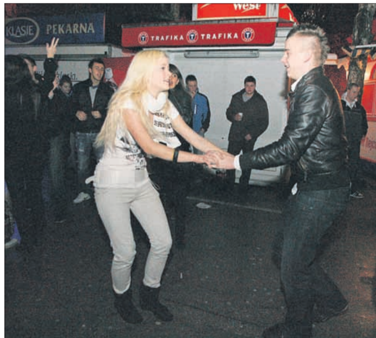
Kdo pravi, da je hladno?