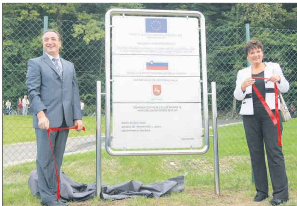
Čistilna naprava v Šentjurju je predstavljala ogromen finančni zalogaj.