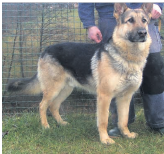
Wuf, kdo je tam? Mimo mene, nemškega čuvaja, ne more nihče, ne da bi me počahal in pobožal. (7716)

dobrih ljudi. Živali iz zavetišča Zonzani si za leto 2010 želijo, da nikar ne bi pozabili nanje. In tega si želimo tudi zaposleni.