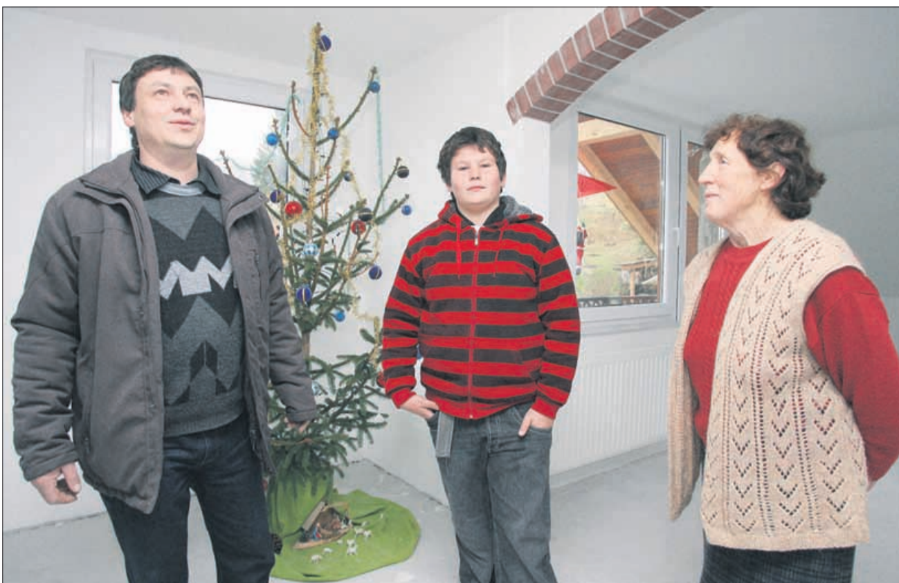
V dveh mesecih od požara so uspeli zbrati 70 tisoč evrov finančne in materialne pomoči, pomoči v delu, storitvah in popustih mnogih podjetij. Čajkovi bodo zaživeli v urejenih prostorih in pod novo streho.