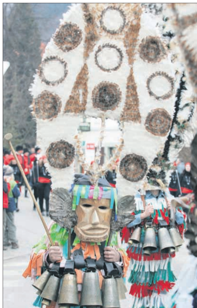
Februar: pustni karneval v Mozirju