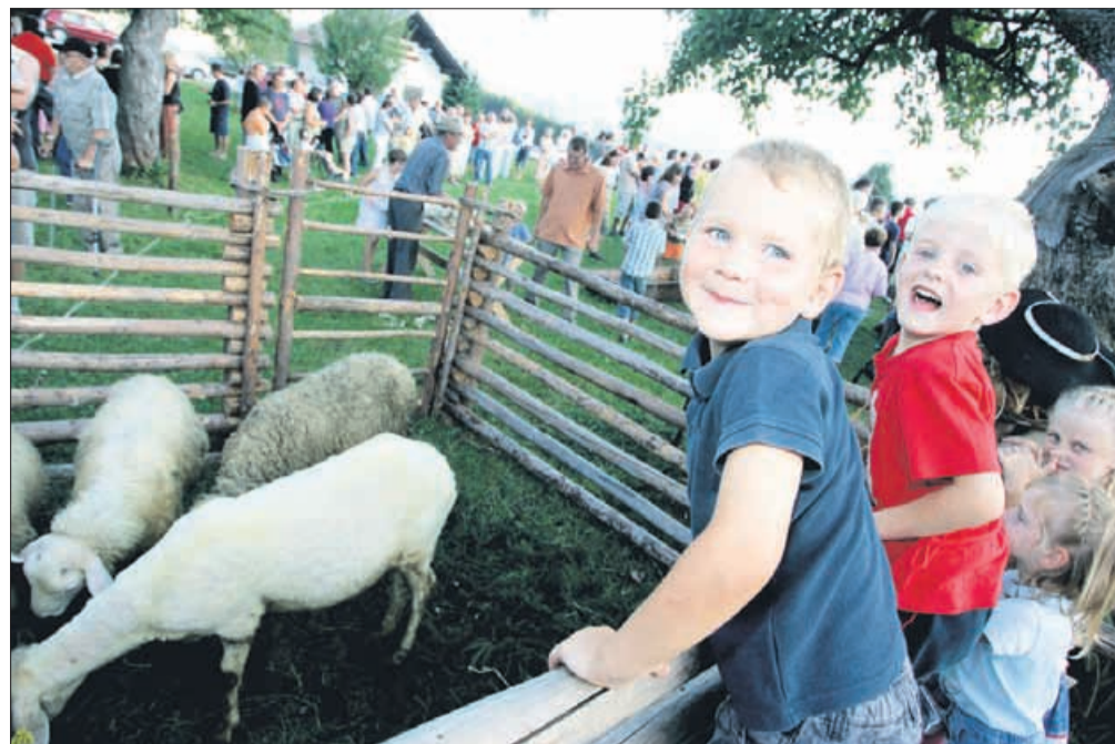
Avgust: ovčarski praznik v Šmihelu