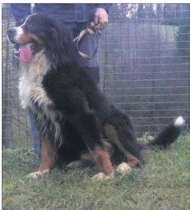
Postaven velikan, ki se je zatekel k hiši v Zlatečah pri Šentjurju, išče svojega lastnika. Kuža je zelo prijazen, ubogljiv, cartljiv, priden na povodcu ...No, hitro ponj, kdor ga pogreša! (7709)