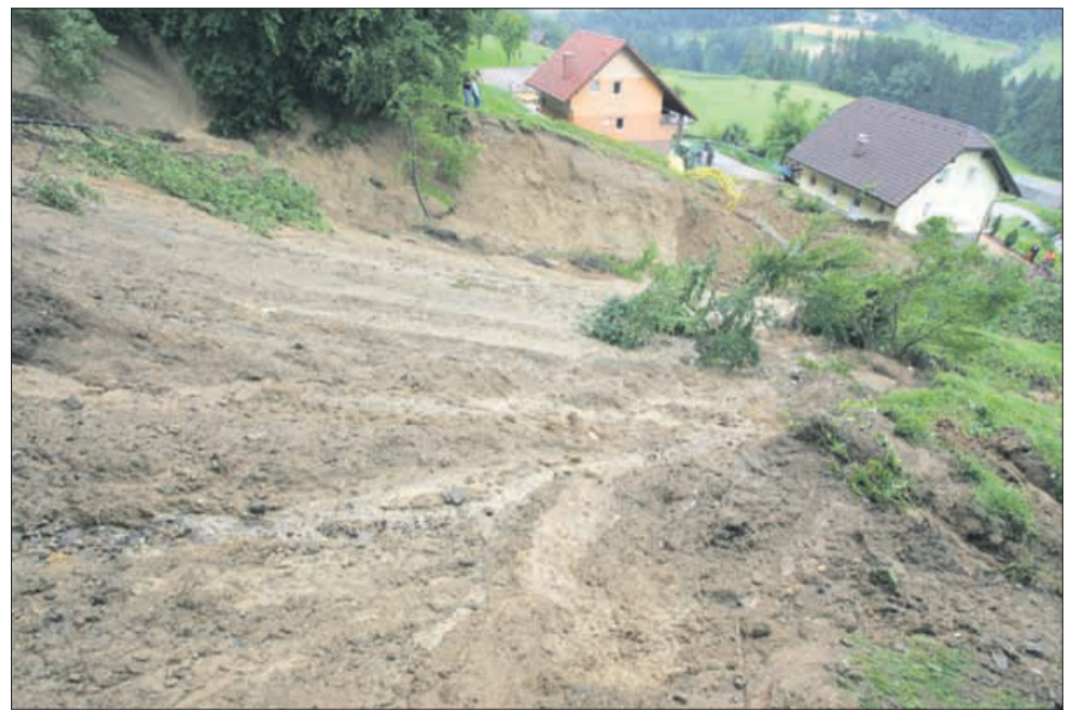
Posledice julijskega neurja v Lokovici

V ostalih občinah se poleg kilometrov novega asfalta, pri čemer je v ospredju Mozirje z asfaltirano cesto proti smučarskemu centru Golte, ki poleg turistične vloge pomeni novo priložnost tudi za Šmihel, ponašajo z različnimi novimi pridobitvami in posledicami starih, ponekod tudi zavoženih odločitev. Podoba tega je Gornji Grad, kjer se počasi izvijajo iz primeža dolgov. Najdogodek v Solčavi je zagotovo gradnja nove Rinkete z njim