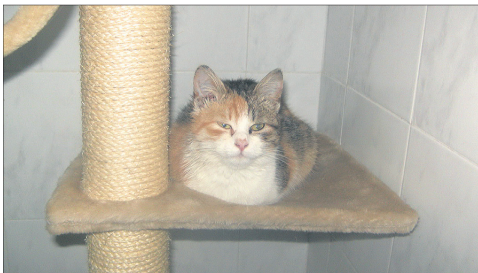
Mmm, kako mi je všeč naš novi praskalnik-počivalnik. Taaakoo je mehek.

Lep pozdrav, ljubitelji živali! Pa smo dočakali leto 2010! Upam, da silvestrska noč ni bila prenaporna in da vam je še ostalo kaj energije za novo leto. Vse želje, ki ste jih prejeli od svojih najbližjih, naj se izpolnijo, vse želje, ki jih skrivate globoko v sebi, naj se uresničijo. Prav tako kot mi, ljudje, imajo tudi živali svoje noveletne želje. Naši zavetiški kužki si najbolj želijo novega doma in odgovornega lastnika, seveda pa se ne branijo sprehajanje tudi v novem letu. Vsekakor pa bodo zelo zadovoljni, če bodo tudi to leto prejeli donacije v obliki hrane, igrač, odej in še česa od vas,