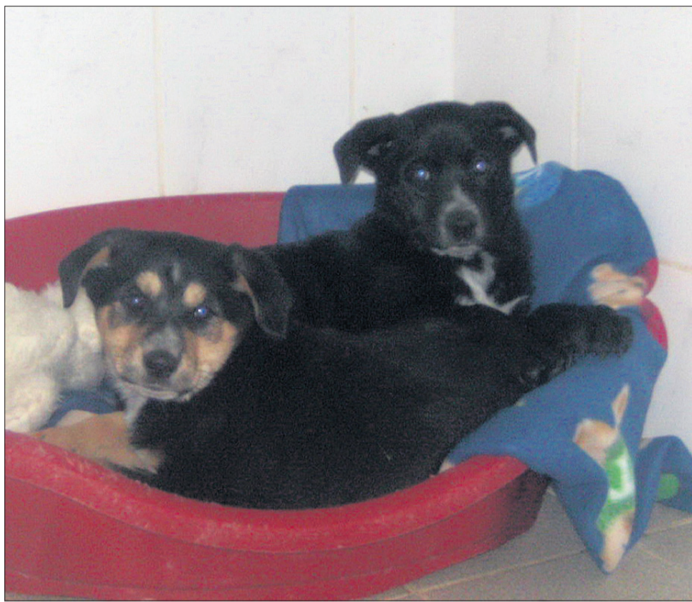
Kaj pa je? Sva smešna ali kaj? Saj ne gledava vedno tako grdo, razen če se kdo dela norce iz naju. Drugače sva pa prav prijetna.