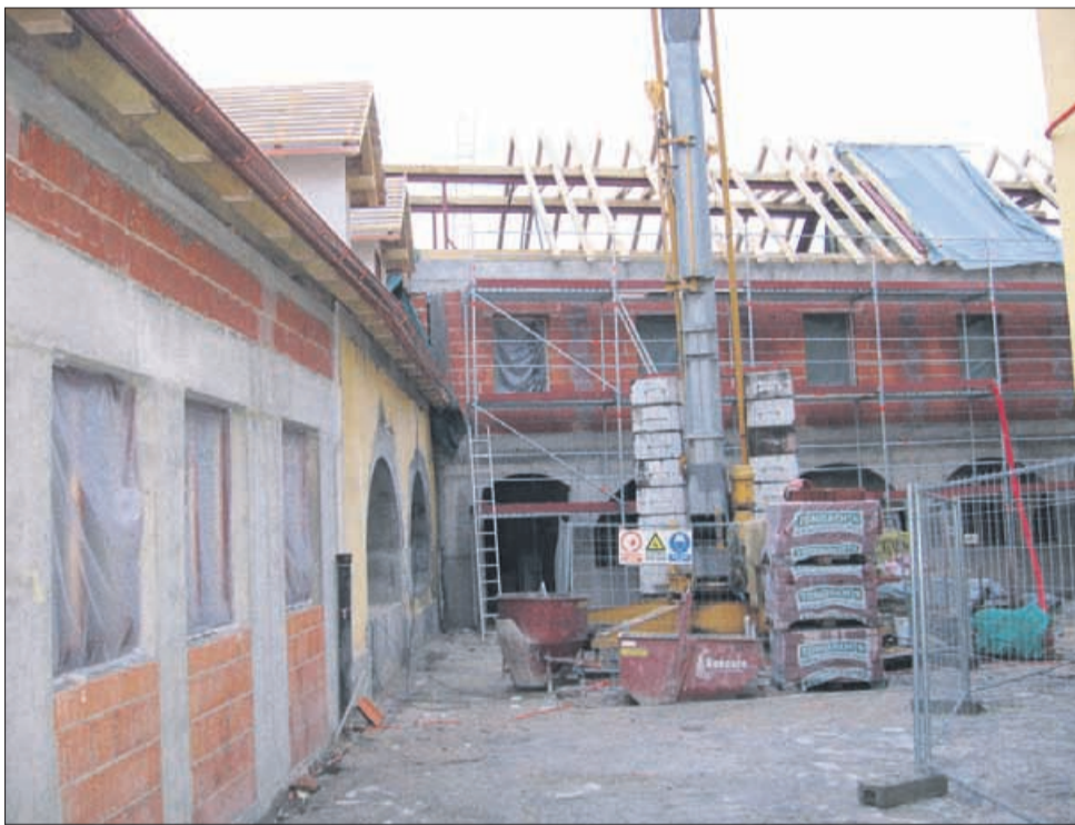
Z gradbišča pastoralnega središča pri župnijski cerkvi sv. Danijela v Celju. Nekdanje hleve, kjer so bili v starih časih konji in krave, bodo obnovili ter dogradili.