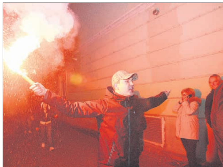
Silvestrovo tudi tokrat ni minilo brez pokanja in svetlobnih učinkov.