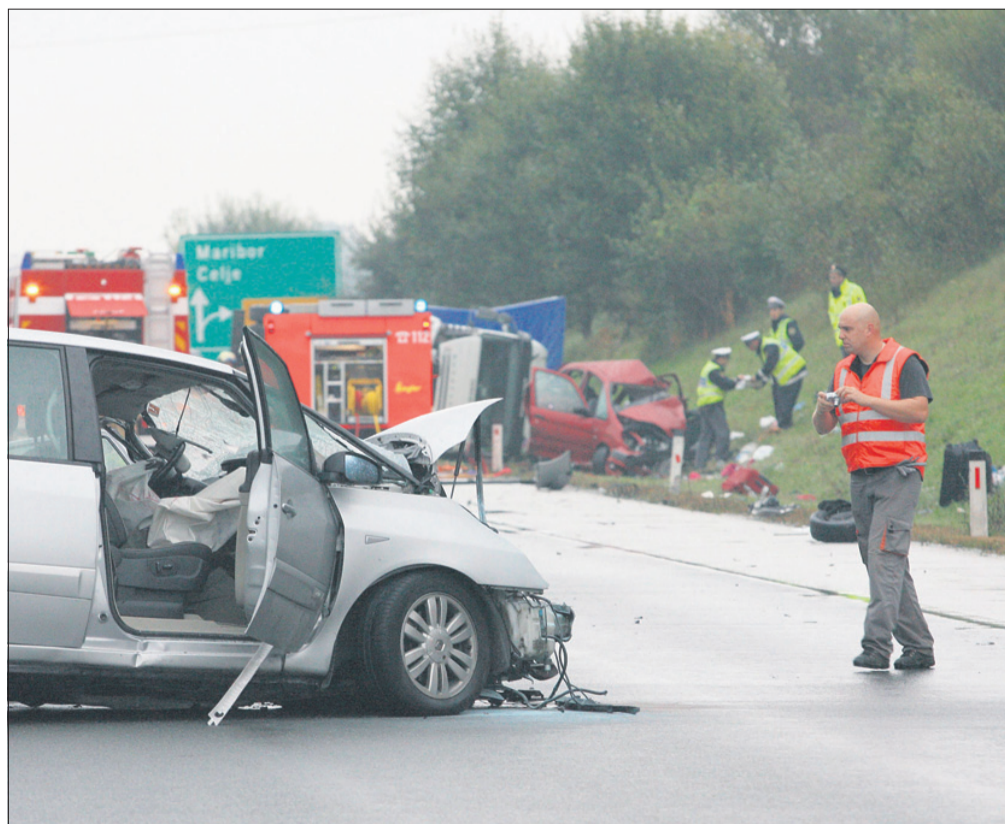
Oktober: prometna nesreča na avtocesti pri Arji vasi