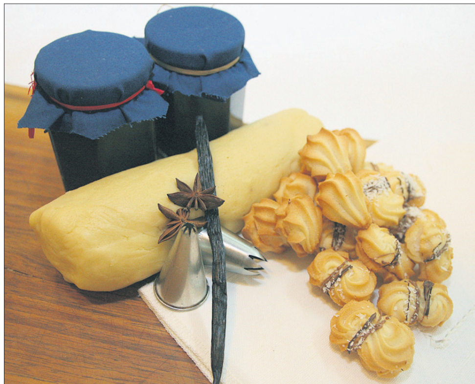
Fini brizgani keksi