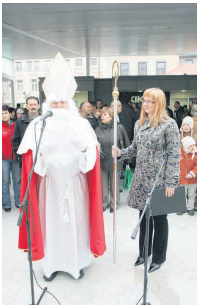
December: nova tržnica v Celju