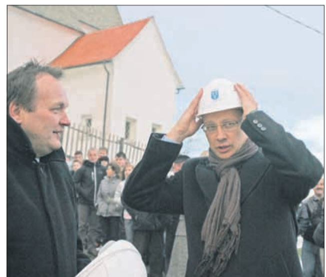
Temeljni kamen za POŠ Šentrupert je pomagal položiti šolski minister Igor Lukšič.