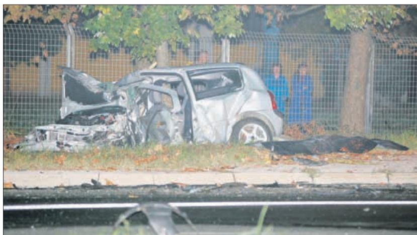
Oktober 2009. Voznica clia je na Kidričevi cesti umrla zaradi pijanega voznika.