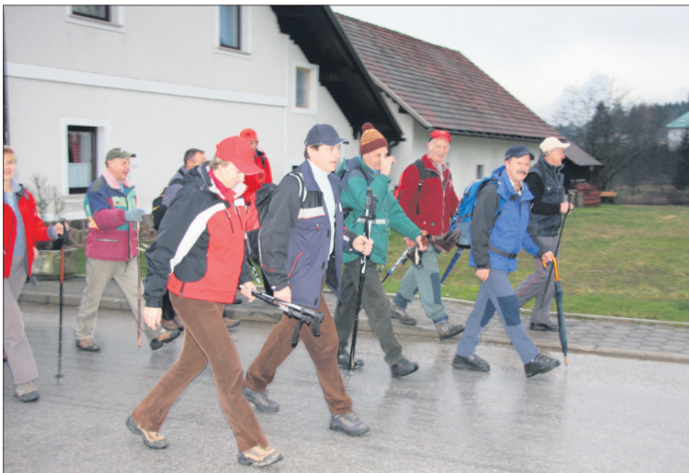
Letošnje pohode je zaznamovalo slabše vreme, zato je bilo pohodnikov nekoliko manj kot druga leta.