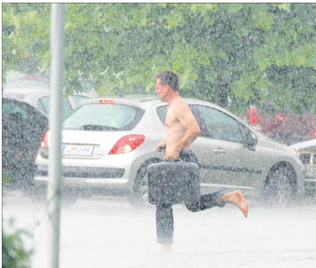
Junij: nevihta