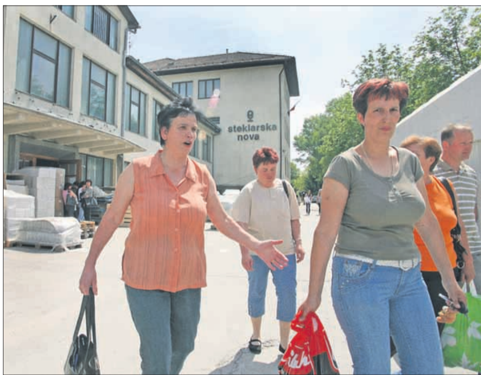
Delavci po odhodu s sestanka, na katerem so izvedeli, da gre Steklarska nova v stečaj.