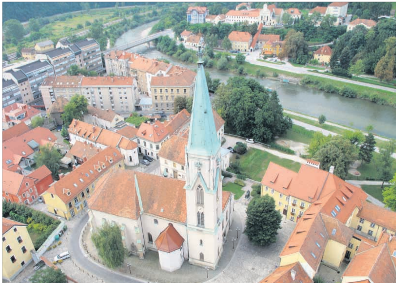
Pogled iz zraka na ožje mestno središče s stolno cerkvijo sv. Danijela v ospredju.