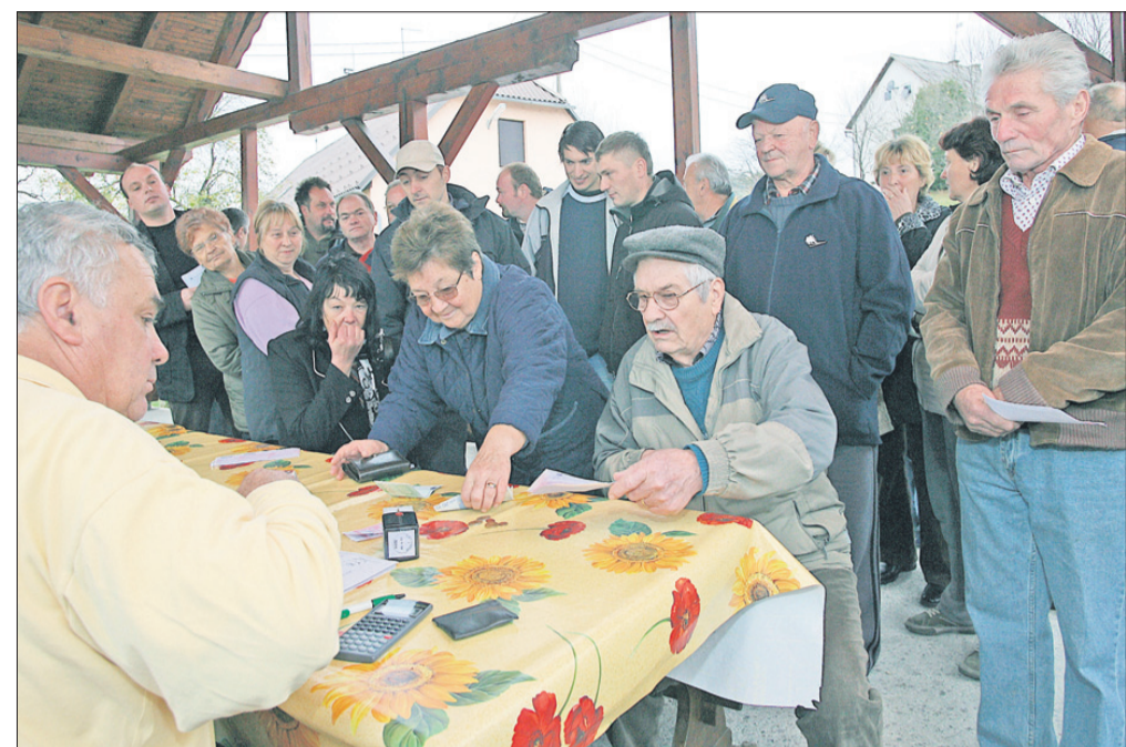
November: pošta pod kozolcem v Sv. Štefanu