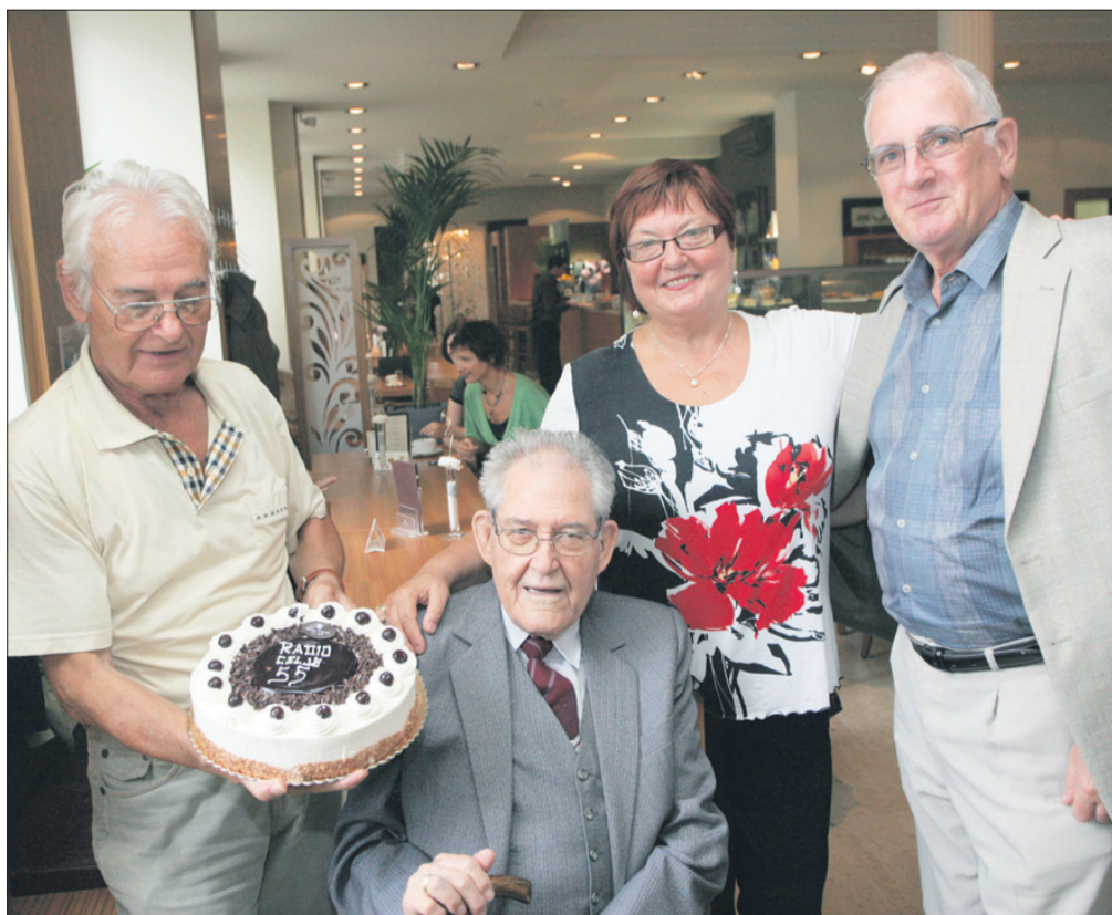
September: 55 let Radia Celje