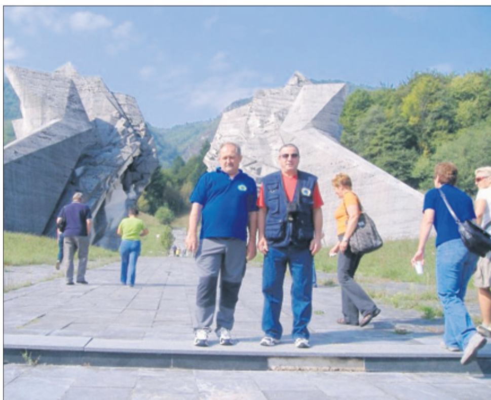
Pri spomeniku bitki na Sutjeski