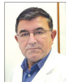
Piše: prim. JANEZ TASIČ, dr. med., spec. kardiolog

Veliko jih misli, da med pospešuje različna alergična vnetja in reakcije. Danes se je dokazalo, da preprečuje alergično reakcijo. Podobno učinkuje tudi pri vnetjih sklepov. Se pa doseže še boljši učinek, če se medu doda bio-