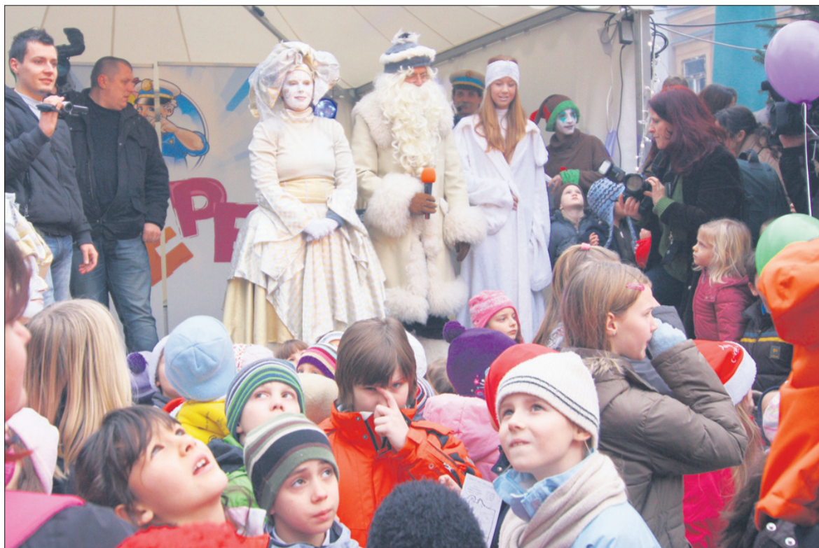
Najmlajši so sekunde odštevali že opoldne v Pravljični deželi. V novo leto sta jih pospremila tudi dedek Mraz in ribič Pepe.