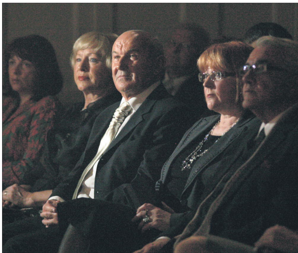
April: praznik Celja in podelitev priznanj