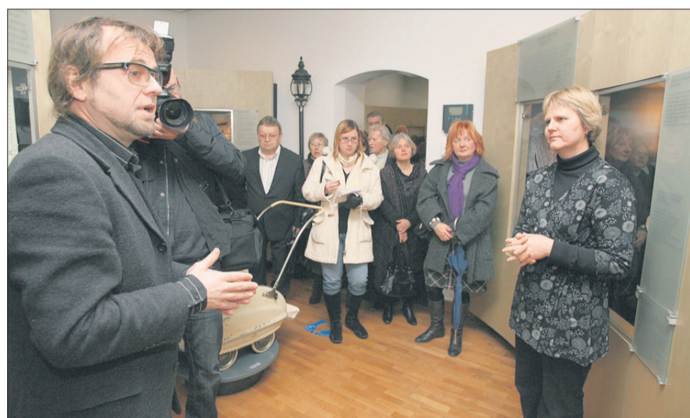
Razstava Živeti v Celju je prenovljena po desetih letih.