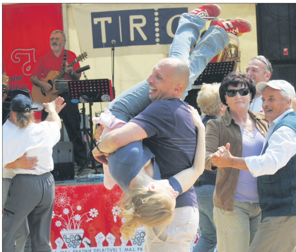
Maj: 1. maj na Celjski koči