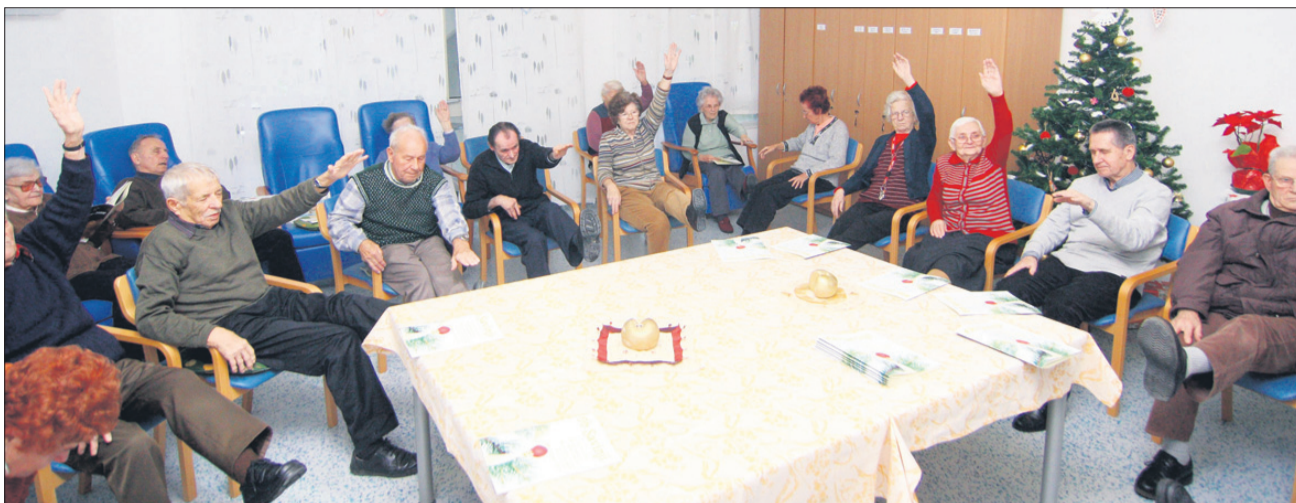
V dnevnem centru ni nikoli dolgčas. Ob devetih je prostovoljna dnevna telovadba, ki traja, s presledki seveda, od pol do tričetrt ure.