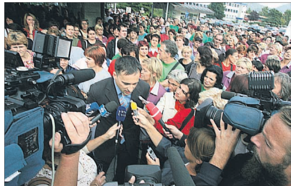
September: spontani upor delavcev v Gorenju