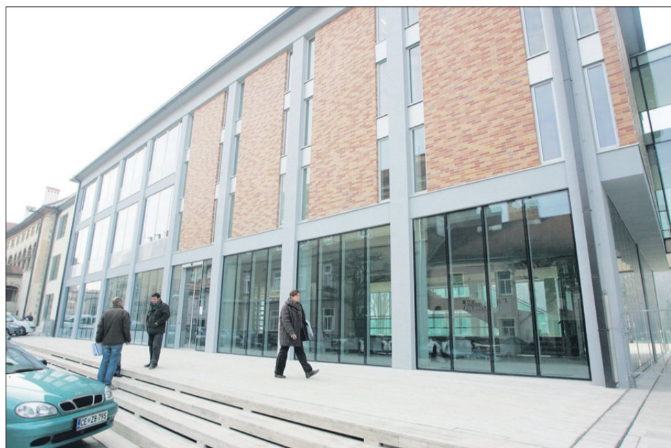
Nova knjižnica, največja lanska naložba v Celju

Mestna občina Celje je v letu 2009 za naložbe namenila približno 22,5 milijona evrov. Največja in najdražja med njimi je bila gradnja nove knjižnice, ki bo pod eno streho združevala vse knjižnične oddelke.