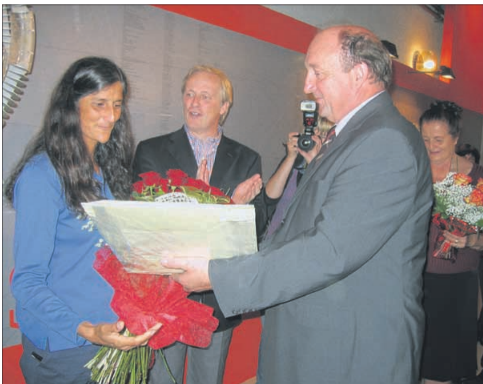
V skromnem kulturnem domu, ki bi naj prerasel v Kulturno središče evropskih vesoljskih tehnologij, so Vitanjčani lani sprejeli ugledno astronautko Sunito Williams.