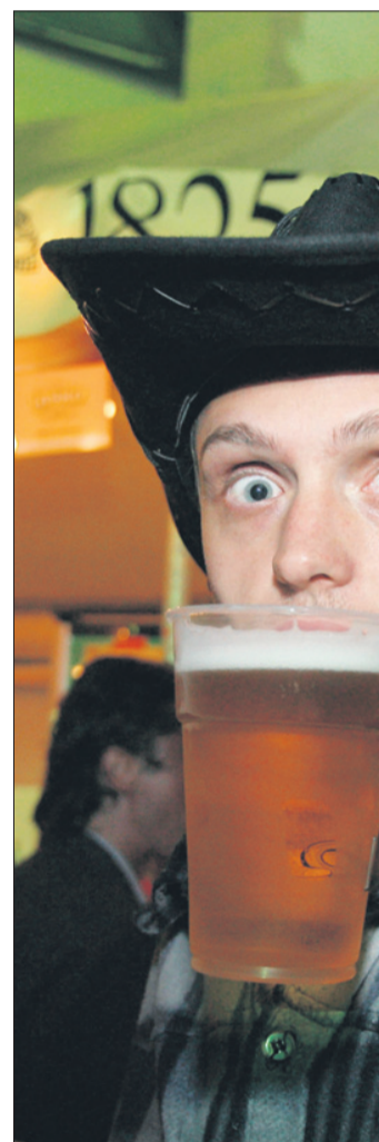
Julij: Pivo in cvetje