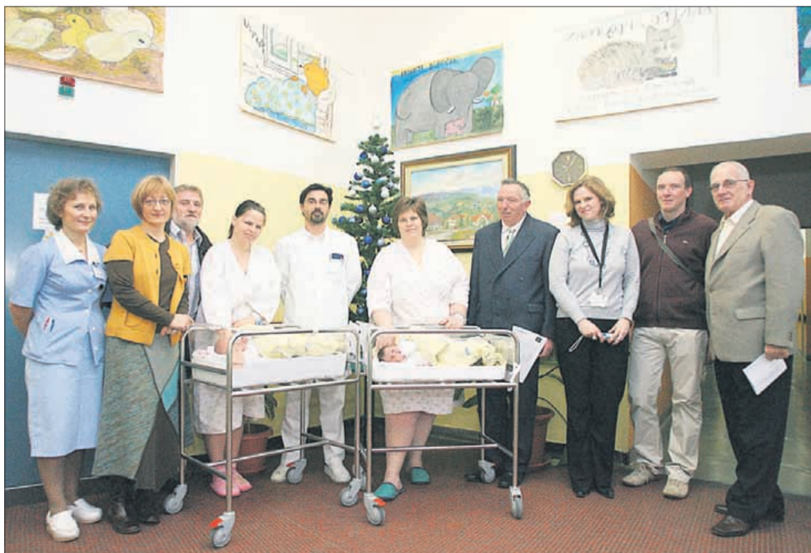
Skupinski posnetek z letošnjega 45. obiska v celjski porodnišnici