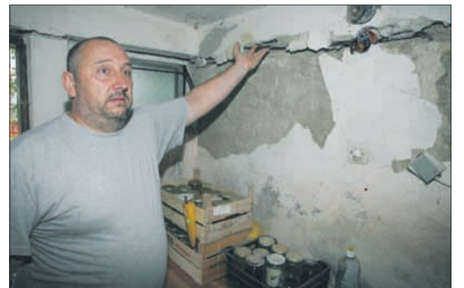
Razpoke se širijo po hišah in cesti v Brodeh na Vranskem. Krajanji novič s strahom pogledujejo v nebo.