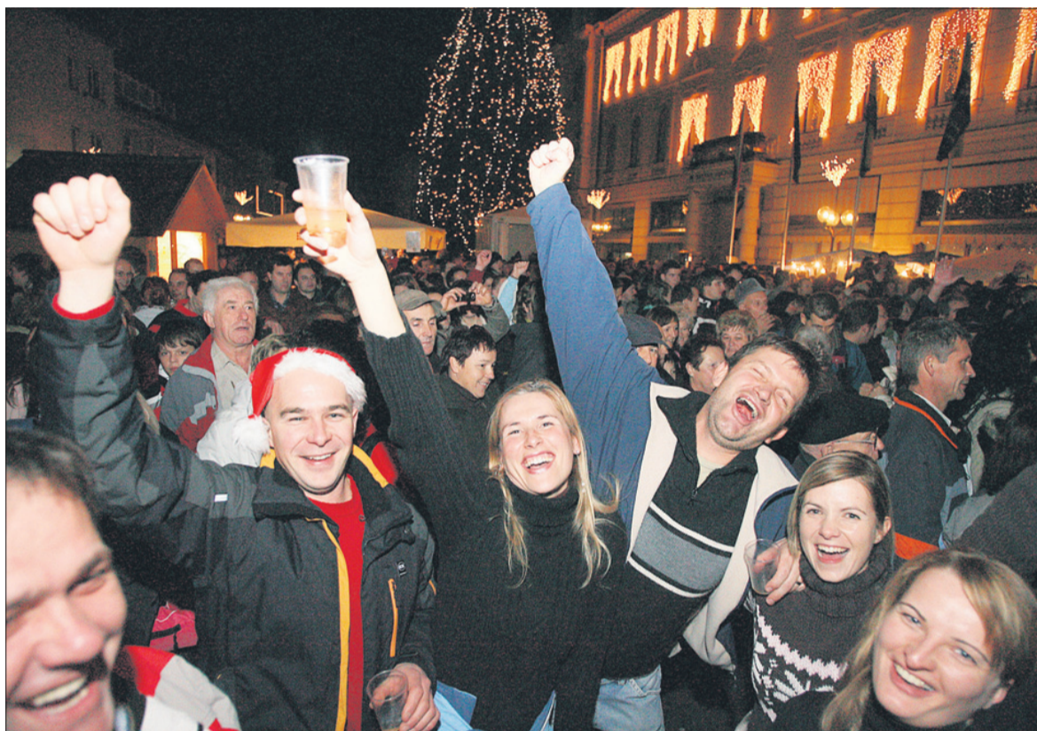
Mnogi Celjani so najdaljšo noč v letu s Čuki preživeli na Trgu celjskih knezov.