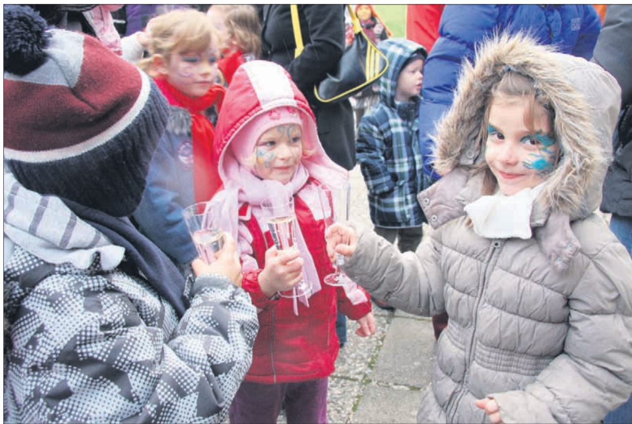
Po poslikavi obrazov je bil na vrsti nazdravljanje.