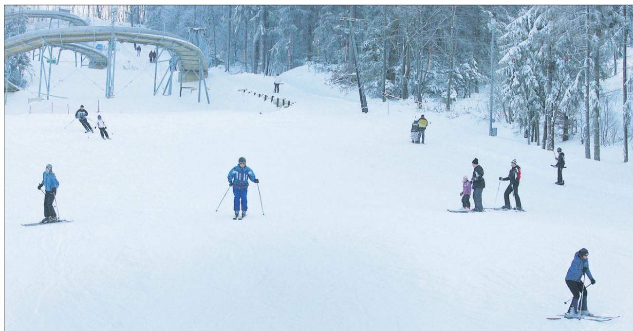
Danes se na Celjski koči spet začne smuka.