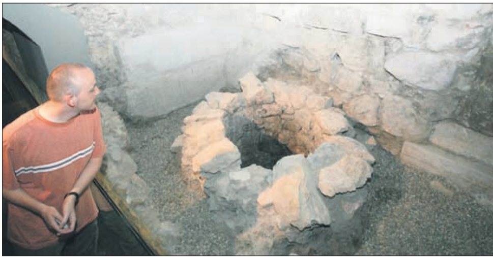
Ena najpomembnejših pridobitev tako za kulturo kot tudi za turizem v Celju je obnovljena arheološka klet Knežjega dvorca, ki pa jo bo treba znati bolje izkoristiti.