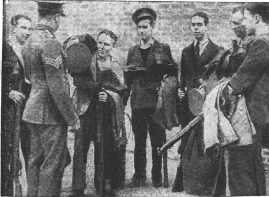
PREDEN SO SE BREZ BOJA VDALI so Angleži mobilizirali svoje mornarje. Slika nam kaže njihove rekrute v enem izmed londonskih vojaških skladišč, kjer so dobivali svojo opremo