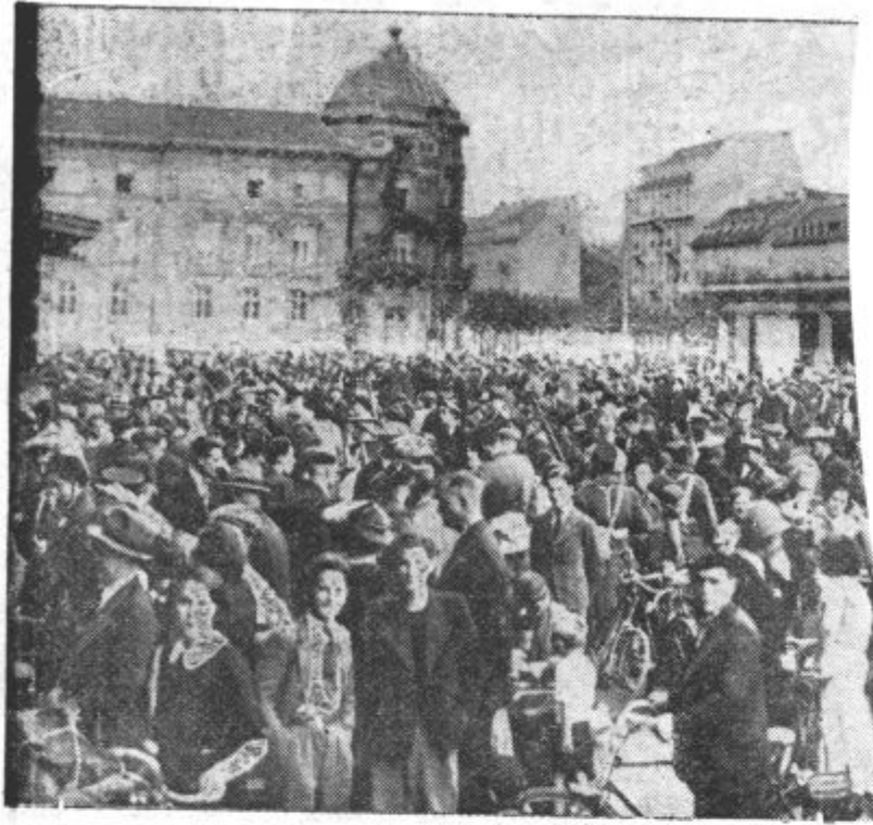
V Strasbourgu: Množica mobilizirancev ni pred glavno postajo provincialnega mesta nič manjša nego pred kakšno pariško postajo