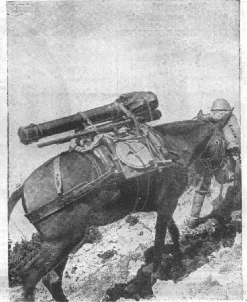
ČESKOSLOVASKO GORSKO TOPNISTVO je opremljeno z majhnimi, toda zelo učinkovitimi topovi, ki so bili izdelani nalašč za posebne prilike českoslovaških mejnih gorskih ozemelj