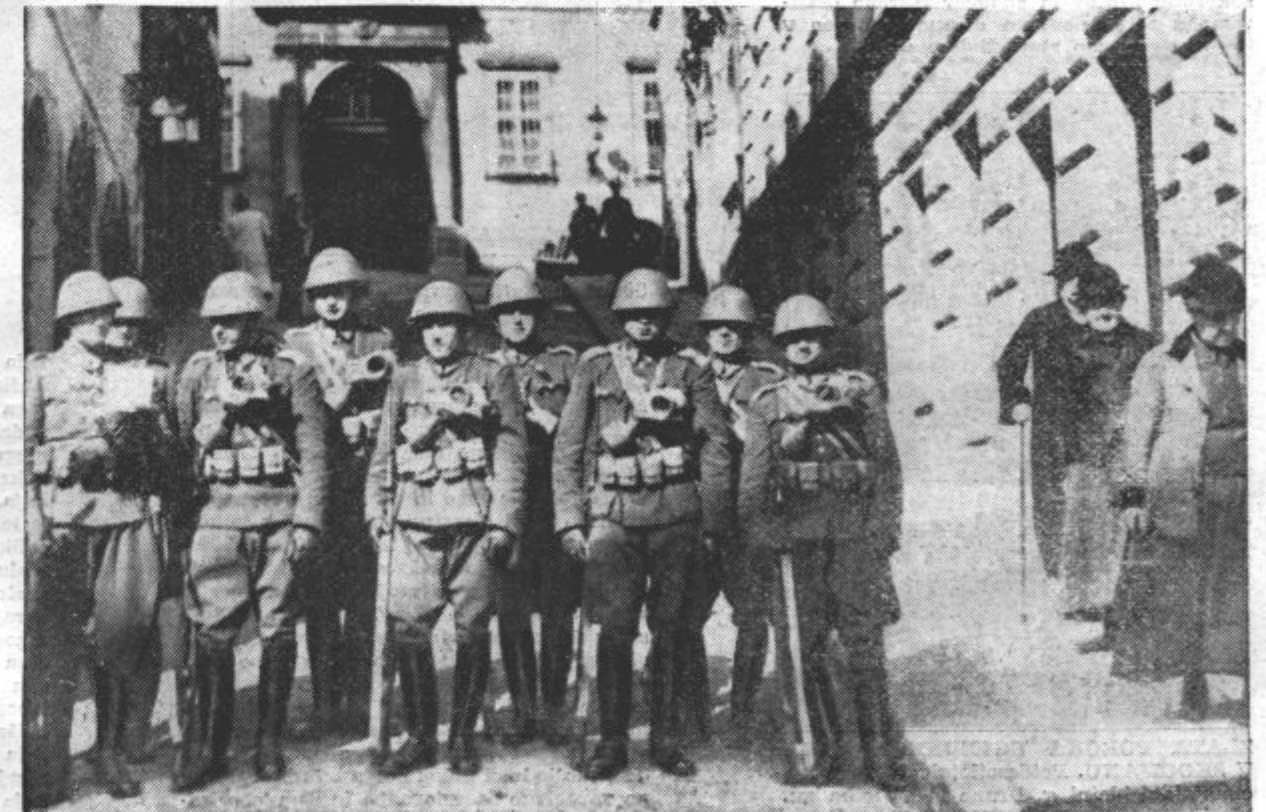
Nobene manifestacije in demonstracije ne razkazujejo odločne volje českoslovaškega ljudstva, da si ohrani samostojnost. Vsepopovsod vladata poslušnost in red, ki odlikujeta bratsko ljudstvo v teh težkih dneh