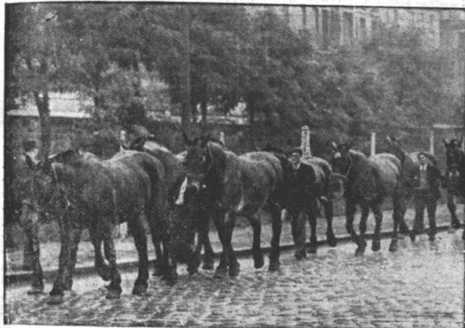
Vojaška oblast je zasegla tudi že del zasebnih, motornih vozil in konj: Prizor iz bližine pariškega vojaškega centra