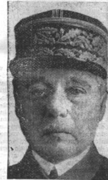
GENERAL GAMELIN šef francoskega generalnega štaba, ki je za ohranitev miru izvršil potrebne vojaške ukrepe, da bi došla beseda državnikov svoj poudarek