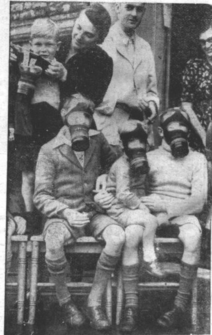
Angleški otroci prihajajo k skladiščem, da si izberejo primerne maske. V teh razburljivih dneh so našli, kakor je videti, edino otroci novo priliko za zabavo