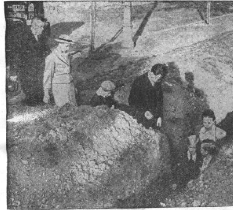
ZA ZAŠCITO PARIZANOV PRED ZRAČNIMI NAPADI so v usodnih dneh gradili jarke in zaklone vzdolž cest. Sem naj bi se zateklo civilno prebivalstvo v primeru zračnih napadov