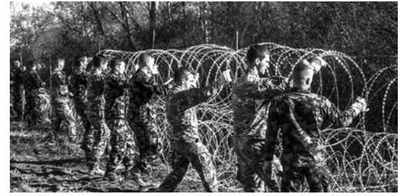
Slovenska vojska postavlja žičnato ograjo