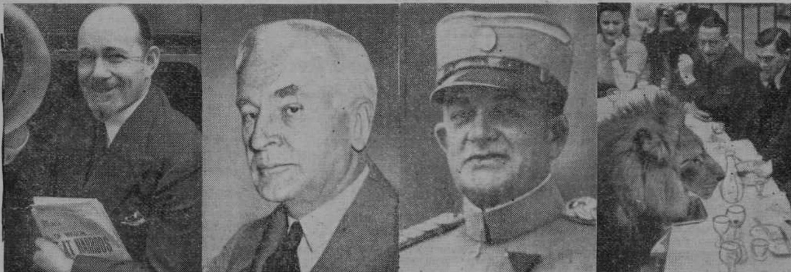
Raziskovalec Hubert Wilkins hoče s podmornico na severni tečaj | Cordell Hull, ameriški minister za zunanje zadeve | General M. Nedič, naš minister za vojsko in mornarico | Dunajčani so še vedno razpoloženi. »Povabil« so celo leva k mizi

nek. V luko bodo plule pod poveljništvom posebnega italijanskega pilota. Ladje, ki bi se ne držale tega predpisa, so same odgovorne za posledice. Drugo italijansko uradno sporočilo pravi, da se od 5. junija smejo uporabljati signali s sirenami samo v primeru zračnih napadov. Vkljub vsem tem izdanim izrednim ukrepom prevladuje v mednarodnih krogih naziranje, da Italija ne bo udarila, dokler sedanja nemška ofenziva ne bo končana in dokler Nemci ne bodo zasedli Pariza. Šele za primer nemške bolj odločilne zmage na zapadu, bi bilo pričakovati, da poseže Ita-