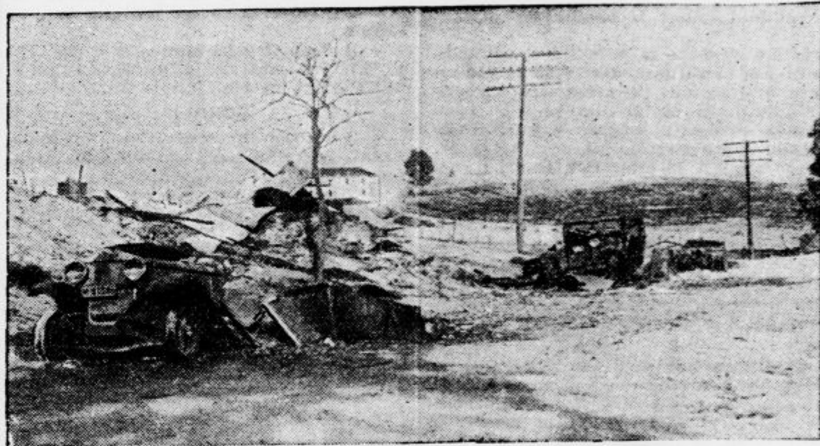
Kamioni upornikov, ki so jih poškodovala letala vladnih čet