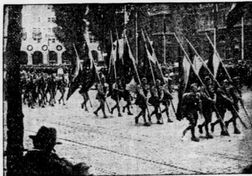
Letošnjega kongresa narodno-socialistične stranke v Nürnbergu so se posebno številno udeležile delegacije mladih hitlerjevcev s svojimi prapori