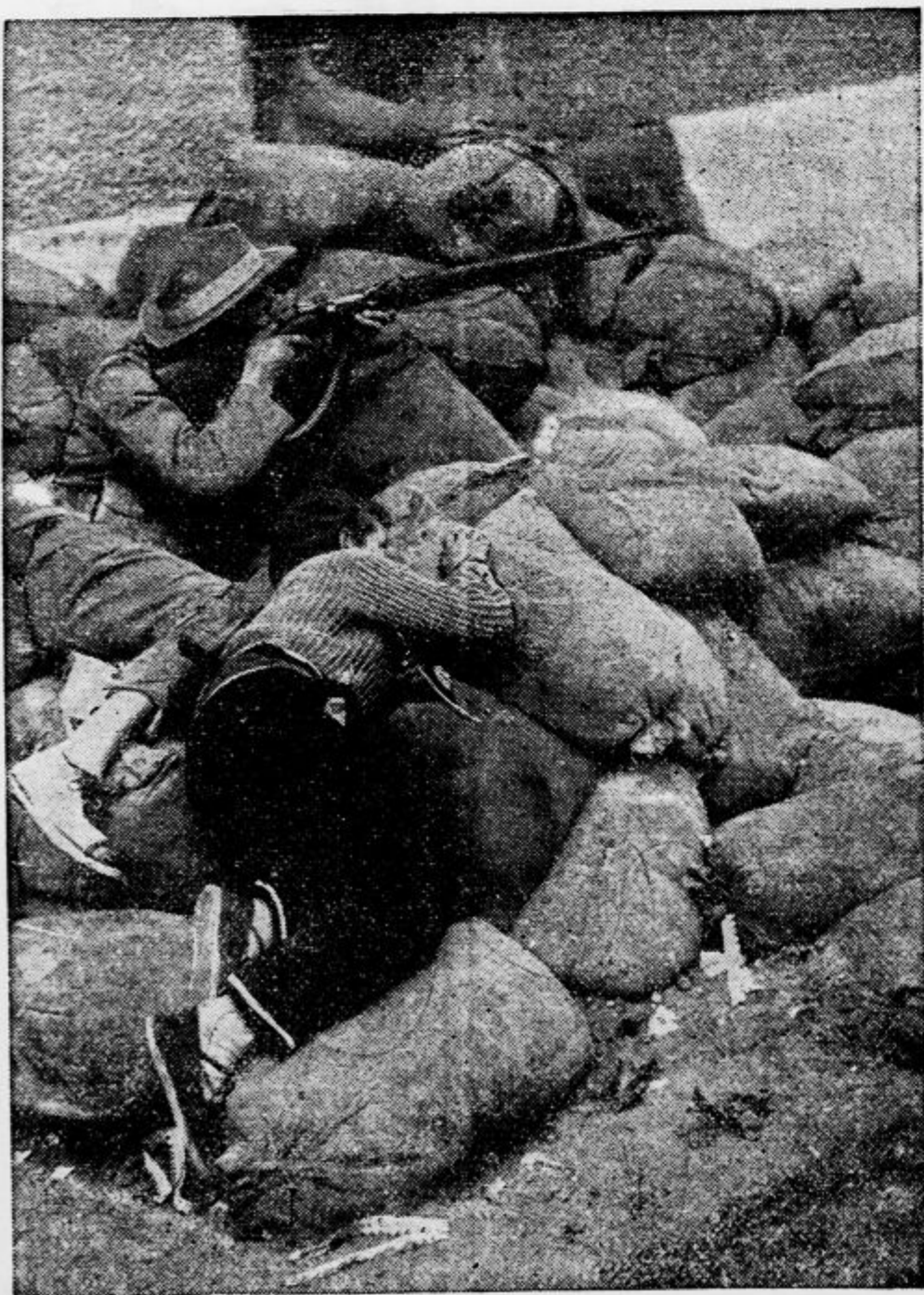
Uporniki napadajo postojanke vladnih čet pri San Sebastianu (pred sedanjim premirjem) izza vreč, ki jih štitijo pred strelj s sovražne strani