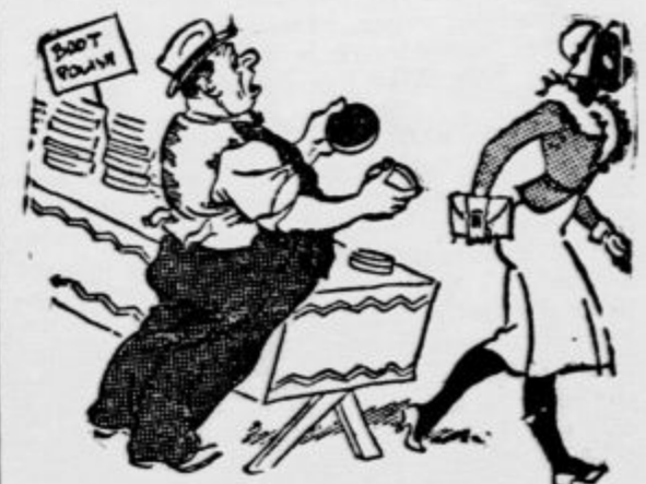
»Krema za čevlje, za čevlje... za obraz, moje dame...«