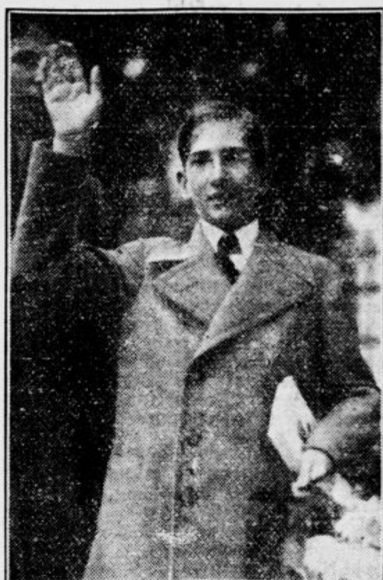
Kralj odzdravlja množice, ki ga je pričakovala pred muzejskim izhodom

domače obrti in etnografskih izdelkov. Tu so ga živo zanimali zlasti izdelki v lesu in pa starinsko kmečko orodje. S pozornostjo se je pomudil ob starem predzgodovinskem čolnu, ki so ga bili našli na Barju in je razstavljen na hodniku. V etnografskem muzeju si je ogledal zbirko panjevih končnic, narodnih noš in oba modela interierjev naše kmečke hiše.