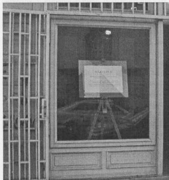
Vitrina pred dvorano Zemljepisnega muzeja z vabilom na likovno razstavo ob Dnevih Inštituta za slovensko izseljenstvo.

In sedaj je pred vami še objava celotnega dogajanja – v sliki in besedi. Preden se