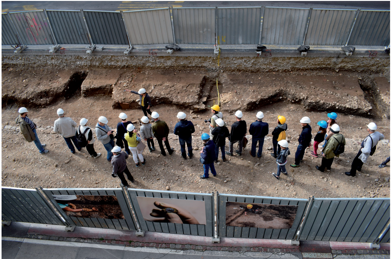
Slika 2. Eno izmed mnogih javnih vodstev na najdišču Gosposvetska cesta.

nato zgolj nadgradili z novimi informacijami, ki smo jim jih »iz prve roke« posredovali arheologi, udeleženi v procesu raziskav 11 .