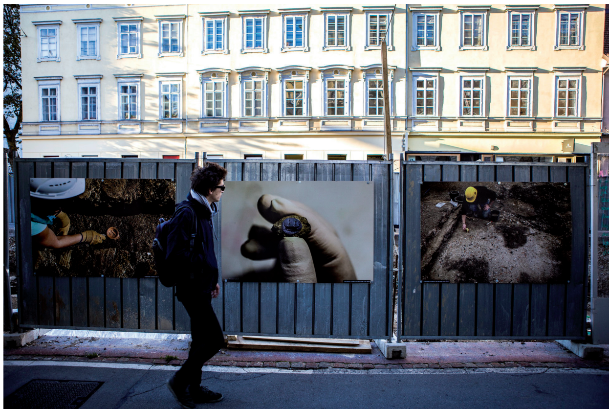
Slika 4. Fotografška razstava na ograji okoli najdišča na Gosposvetski cesti.

Poleg vsega zgoraj naštetega pa smo v letu 2017 okviru Mednarodnega dneva arheologije 13 21. oktobra pripravili dan odprtih vrat na najdišču Gosposvetska cesta. Javna vodenja so potekala vsako polno uro, izvajale pa so se tudi izkustvene delavnice, ki so jih vodili animatorji iz Arheofakta in Arheoveda, pomoč pri animiranju obiskovalcev pa nam je nudilo še kulturno društvo Vespesjan. Na delavnicah so se obiskovalci lahko preizkusili v vsakodnevnih veščinah, s katerimi so si življenje lajšali Emonci v 4. stoletju – torej v času, v katerega umeščamo