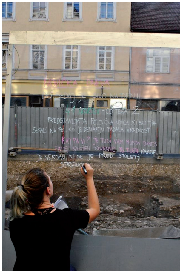
Slika 5. Dele kovinske ograje na Gosposvetski cesti smo zamenjali s prozornimi ograjami iz pleksi stekla, ki so se izkazale za izjemno uporabne. Po eni strani so lahko mimoidoči opazovali kaj se dogaja na najdišču za ograjo, po drugi strani pa smo prazen prostor izkoristili za sporočanje različnih novic iz izkopavanj.

Ekspres). Brez zadržkov lahko rečemo, da je bila medijska kampanja v tem času več kot uspešna.